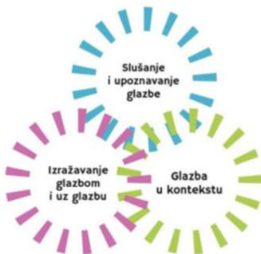
Slika 1. Domene u nastavi Glazbene kulture (MZO, 2019, n.s.).

Promatrajući Sliku 1., može se uočiti kako se domene predmeta Glazbena kultura nadopunjuju i međusobno povezuju, a u svim su domenama prisutni zajednički elementi: glazbeni jezik i informacijsko-komunikacijska tehnologija koja uključuje: