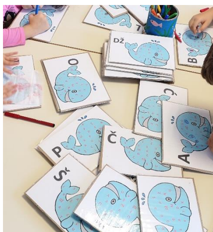
Slika 7 – kartice za uočavanje i prepoznavanje zadanih slova

Centar ćemo obogatiti slikovnom i/ili taktilnom abecedom te raznim materijalima koji će poticati djecu na stvaranje njihovih slikovnica. U nedostatku prostora, a u sklopu centra predčitačkih igara nalaziti će se dramski kutak s raznim vrstama lutaka, npr. štapne, prsne i ginjol lutke gdje će djeca primjenom dramskih igara razvijati svoje govorno-jezične sposobnosti.