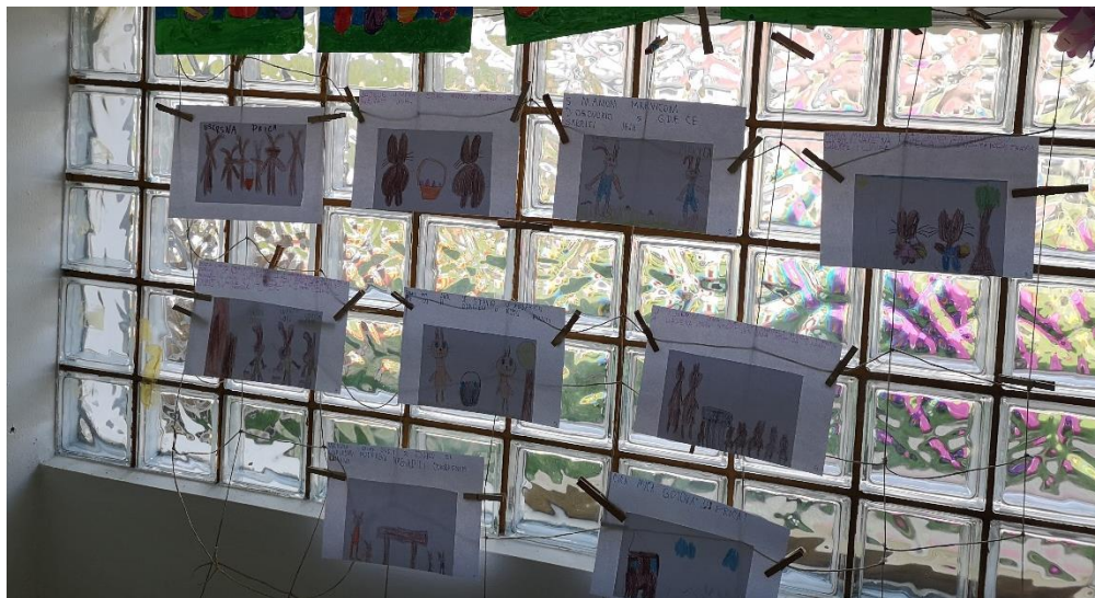
Slika 9 – „Uskrsna priča“

Na temelju svog rada u vrtiću primijetila sam kako okruženje ima veliki utjecaj na govorno-jezični razvoj kod djece. Poticaji koje sam, u suradnji s kolegicom, nudila djeci utjecali su njihov razvoj govora, kao i brojne jezične igre koje smo igrali. Kroz igru i razne poticaje djeca nisu bila ni svjesna koliko se njihov vokabular obogaćivao i koliko su postali kreativni i maštoviti. U prilog tome ide jedna priča koju su, uz manju pomoć, sami osmislili i ilustrirali. Priču smo kada je bila gotova postavili na pano, a zatim je uvezali kako bi joj se djeca mogla vratiti kada god požele.