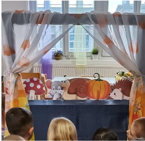
Slika 8 – jesenska predstava u izvedbi djece, njihov stvaralački rad

Na temelju svog rada u vrtiću primijetila sam kako okruženje ima veliki utjecaj na govorno-jezični razvoj kod djece. Poticaji koje sam, u suradnji s kolegicom, nudila djeci utjecali su njihov razvoj govora, kao i brojne jezične igre koje smo igrali. Kroz igru i razne poticaje djeca nisu bila ni svjesna koliko se njihov vokabular obogaćivao i koliko su postali kreativni i maštoviti. U prilog tome ide jedna priča koju su, uz manju pomoć, sami osmislili i ilustrirali. Priču smo kada je bila gotova postavili na pano, a zatim je uvezali kako bi joj se djeca mogla vratiti kada god požele.