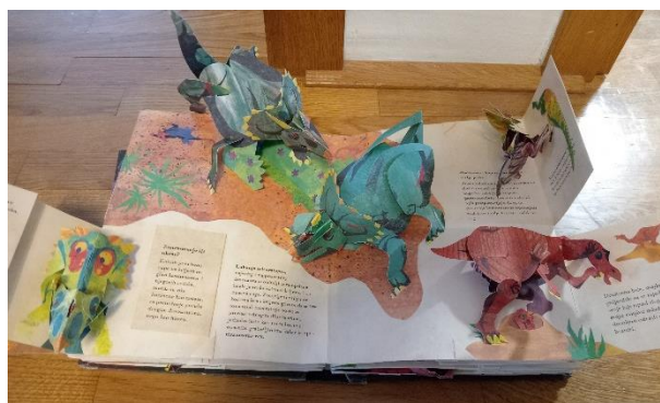
Slika 2 – pop-up slikovnica

Pop-up slikovnice djeci su zanimljive jer su drugačije od ostalih, nazovimo ih, klasičnih slikovnica. Njihova glavna karakteristika je trodimenzionalnost koja ih djeci čini privlačnima.