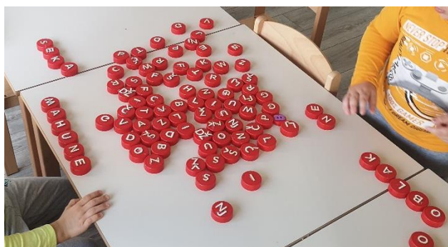
Slika 6 – slova na čepovima kojima djeca stvaraju riječi