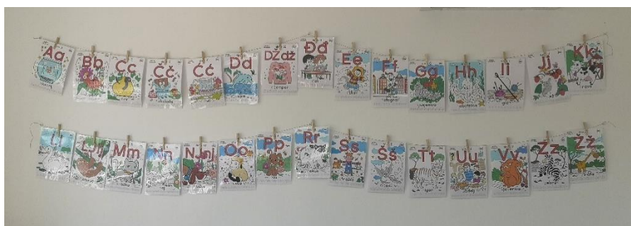
Slika 5 – slikovna abeceda