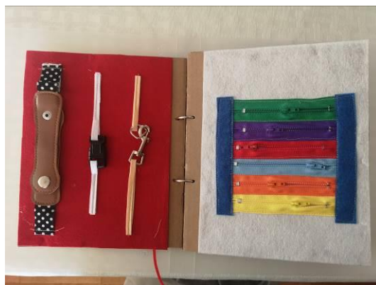
Slika 3 – tiha knjiga (vlastita izrada)

U novije vrijeme javljaju se tzv. tihe knjige izrađene od materijala različitih tekstura. Tematika ovih slikovnica može biti različita, a njima se uglavnom potiče razvoj fine motorike i okulomotorike. Svi materijali su ručno šivani i prilagođavaju se dobnoj skupini pa će se tako u tihoj knjizi naći zadatci kopčanja gumbi, kvačica, patent zatvarača, čičaka, provlačenja i vezanja vezica i drugo.