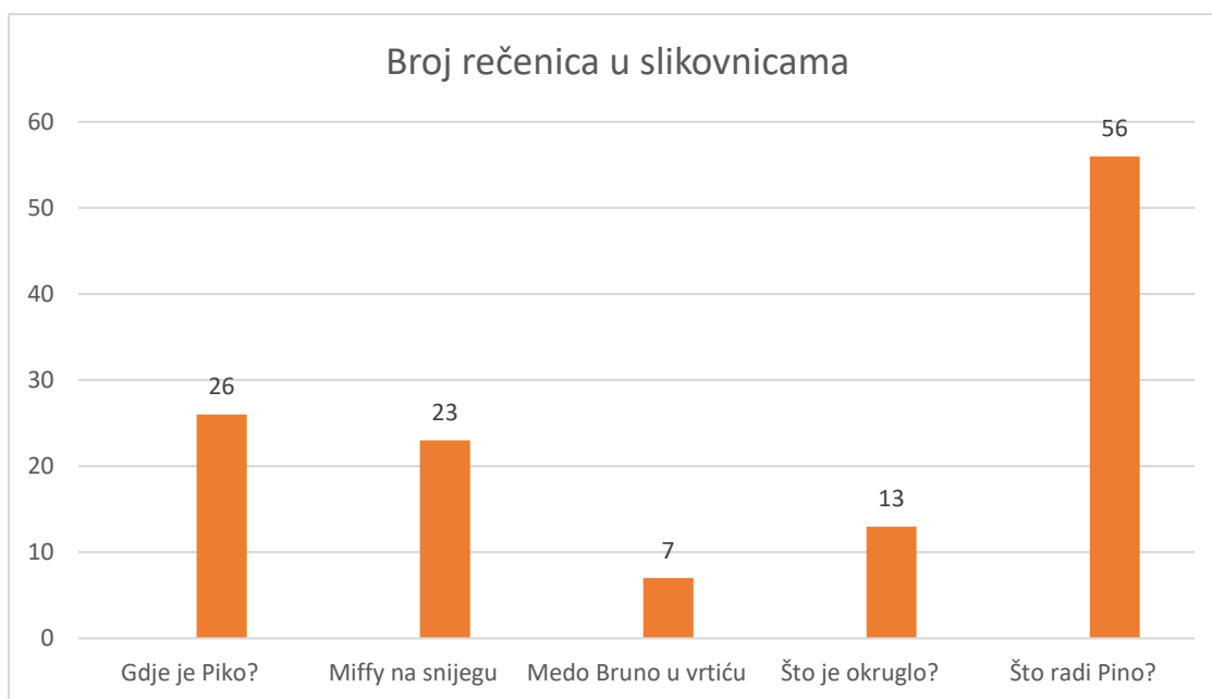
Grafikon 2 – broj rečenica u slikovnicama

Sljedeća analiza odnosi se na prosječan broj riječi u rečenicama, a rezultati su dobiveni dijeljenjem broja riječi s brojem rečenica. Navedeni rezultati prikazani su u tablici 1.