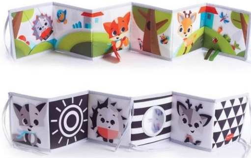
Slika 1 – leporello slikovnica

Leporello je, primjerice, slikovnica koja svojim izgledom podsjećaju na harmoniku gdje svaki dio izgleda kao jedna cjelina.