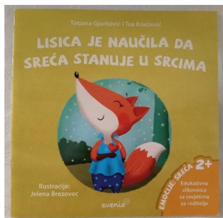
Slika 4 – problemska slikovnica

Postoji još jedna vrsta slikovnica o kojima se u zadnje vrijeme sve više govori, a to je problemska slikovnica za koju Majhut i Zalar (2010) kažu da govore o temama o kojima se prije nije smjelo govoriti. Najčešće teme problemskih slikovnica su emocije, odnosi u obitelji i društvu te zdravlje. Ova vrsta slikovnica sve se više koristi u radu s djecom jer pomaže djetetu da se prepozna u određenoj situaciji i pomaže mu da samo dođe do načina rješavanja neke situacije bez da se osjeća da mu je netko nešto nametnuo. Također, pomaže i roditeljima i odgojiteljima jer se na kraju problemskih situacija nalaze savjeti kako pomoći djetetu u određenoj situaciji. Važno je prepoznati koji problem muči dijete, pronaći odgovarajući slikovnicu i potaknuti ga na razmišljanje.