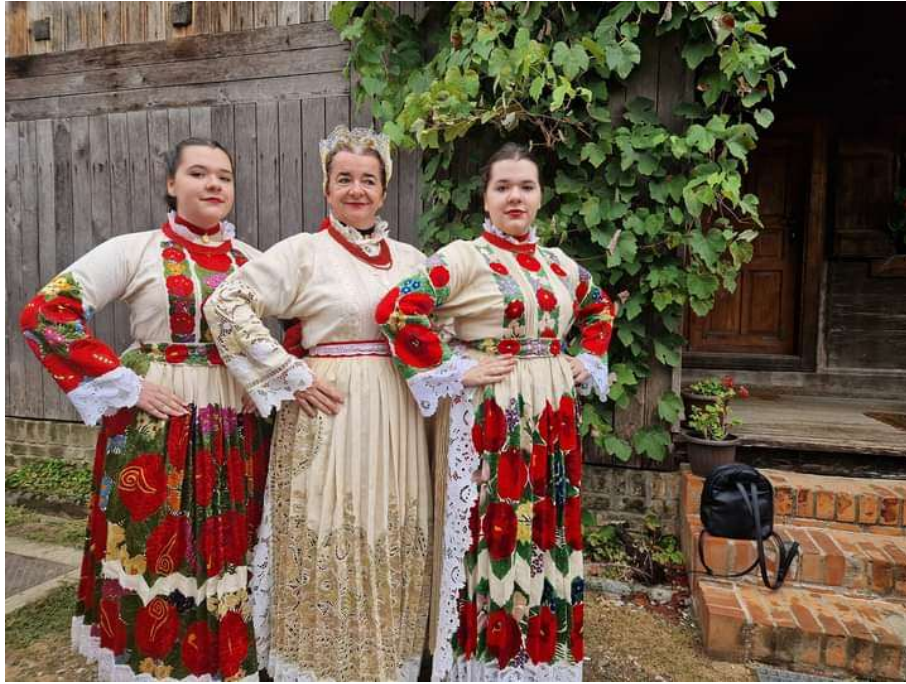
Slika 29. Primjer mladosti i starosti (osobna arhiva obitelji Kožić iz Krapja, 2023)

Ženska narodna nošnja sastoji se od opleće ili švabice (košulje), rubače, zastora, bijelih dokoljenica te od crnih, svečanih cipela, visokih, kožnih cipela ili opanaka. Za nakit su se stavljali kraljuži (ogrlice načinjene od crvenih koralja) ili dukati. Muška narodna nošnja sastoji se od šešira, rubače (košulje), gaća (hlača), lajbeka (prsluka), bijelih čarapa ili obojaka od vune ili platna te od opanaka (Slika 30.). Nošnje ovog područja bile su tkane, odnosno izrađivale su se od tkanine.