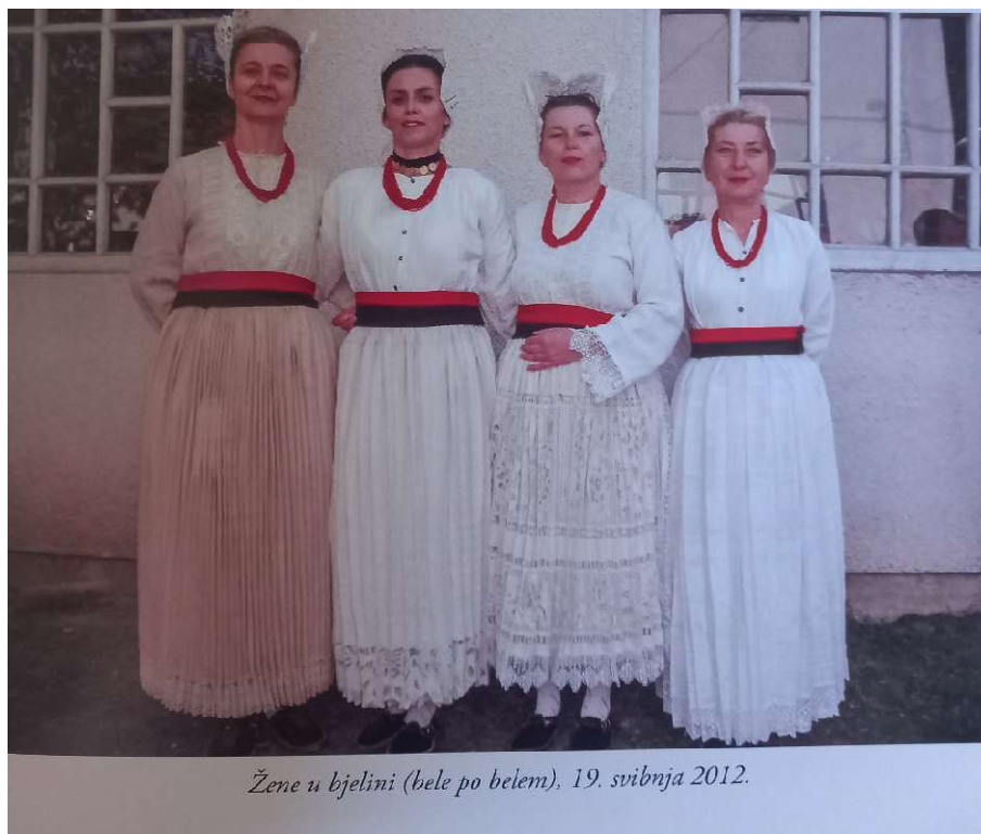
Slika 28. Udane žene (Rizmaul, 2023, str. 51)

Udovice i starije žene (u tadašnje vrijeme to su bile žene već sa 40 godina) nosile su bijelu odjeću. Tako je crvena boja označavala mladost, a bijela boja starost (Slika 29).