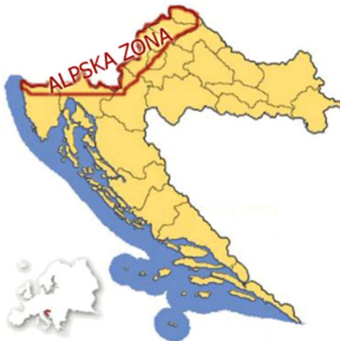
Slika 7. Alpska folklorna zona ( Hrvatski folklor 4 )

Alpska zona (Slika 7) obuhvaća prostor Istre, Gorskog kotara, Prigorja, Hrvatsko zagorje, Međimurje te dio Podravine. Vidljivi su i utjecaji alpske zone u Kalniku, Pokuplju, Bilogori, Banovini, Moslavini i Turopolju (Ivančan, 1996).