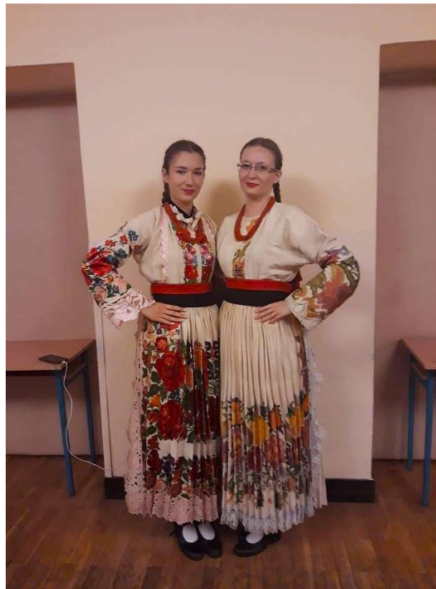
Slika 27. Neudane djevojke (osobna arhiva, 2019, Petrinja)

Narodna nošnja Banovine veoma je posebna po svojoj raznolikosti te po svome izgledu. U okolici Petrinje, Pokuplja i Gline, narodne nošnje su izgledom veoma slične. Na narodnim nošnjama ovih prostora, najčešći su cvjetni motivi (ruže, lišće) raznih boja kako i na ženskim tako i na muškim nošnjama. O tome je li žena neudata ili udata, moglo se znati i po izgledu njezine frizure. Neudate žene nosile su ukrašene pletenice (Slika 27), a udane žene su na glavi nosile poculicu, odnosno lanenu kapicu (Slika 28).