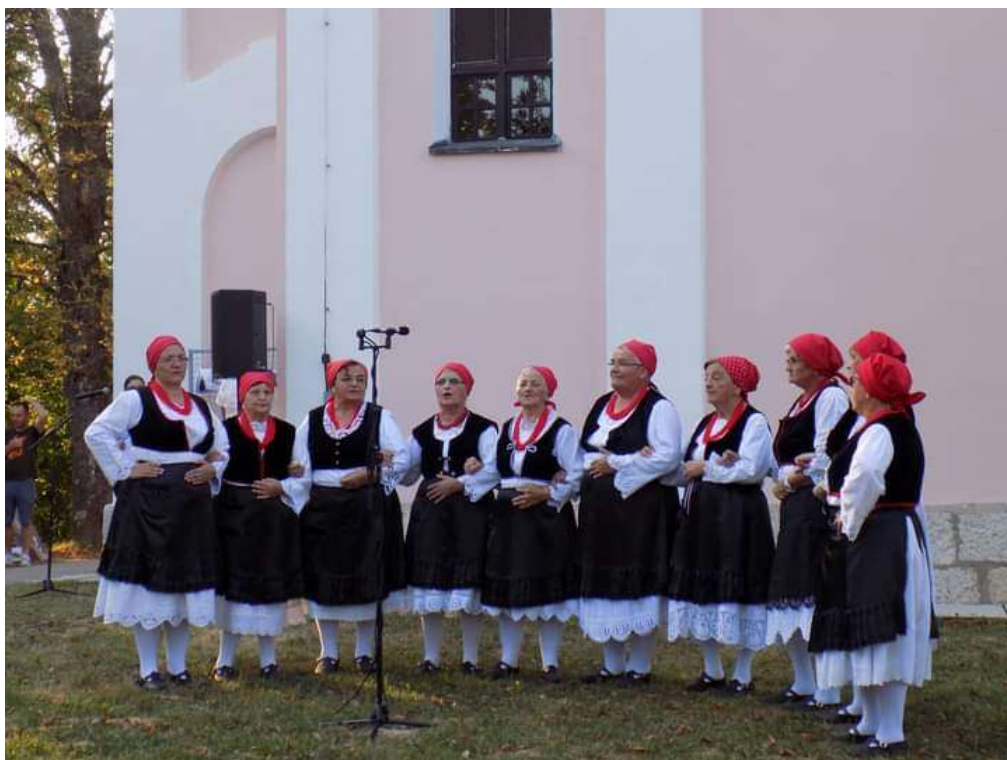
Slika 33. Ženska narodna nošnja Kostajničkog Pounja (KUD „Potočanka“ Potok, 2018)

Muška narodna nošnja ovog kraja sastoji se od bijele košulje, crnog prsluka (lajbeka), bijelih hlača (gaća), opanaka i crnog šešira.