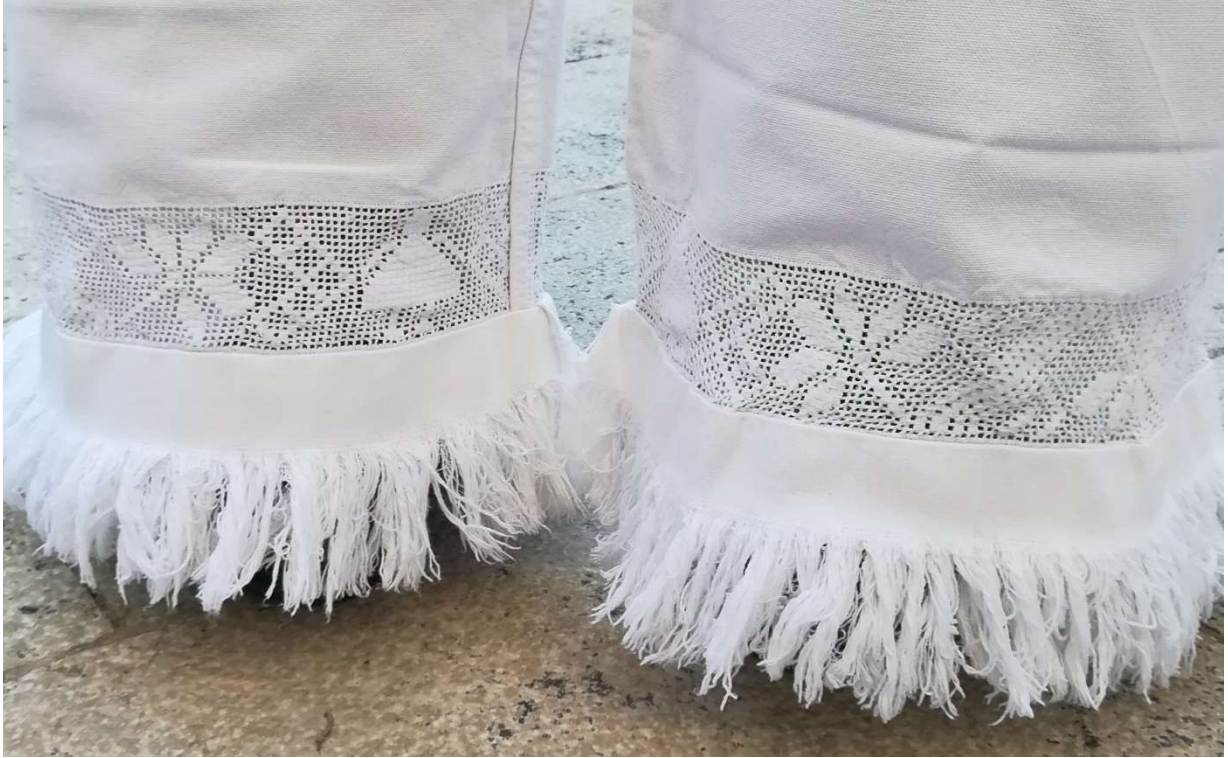
Slika 32. Bijeli vez pukan'ca

O važnosti umijeća izrade veza pukan'ca govori nam i to što je ovo umijeće upisano u listu nematerijalnih zaštićenih kulturnih dobara.