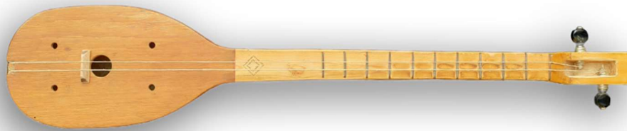
Slika 25. Tambura dvožica (Hrvatska tradicijska glazbala 16 )