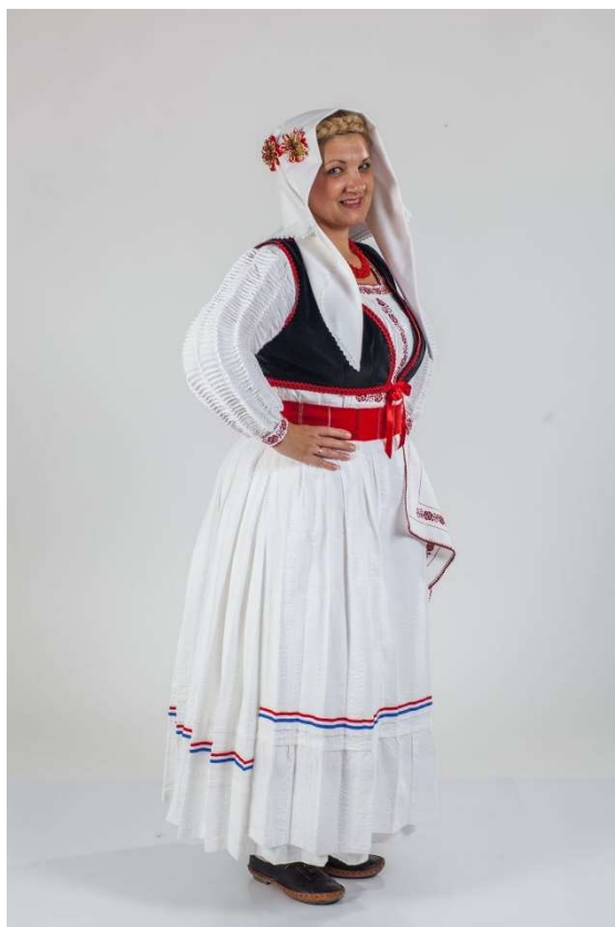
Slika 31. Ženska narodna nošnja Prnjavora i Hrvatskog Čuntića (Hrvatska katolička mreža, 2022)

Muška narodna nošnja specifična je po posebnoj tehnici bijelog veza, a naziva se pukan'ca. To je čipka koja se nalazi na nogavicama muške narodne nošnje. Ovakav vez pojavljuje se i kao uža ili šira poruba na prsima košulja, na rubu rukava, nogavica ili ženskih rubaca te ukras može biti skromniji ili raskošniji. Izrada pukan'ca veoma je zahtjevna te nastaje „izvlačenjem niti osnove i potke te opletanjem bijelom pamučnom niti“ (Umijeće izrade veza pukan'ce, 2024) kojom se dobivaju ukrasni i šupljikavi motivi. Prije se platno proizvodilo kod kuće na tkalačkom stanu te se tako točno znalo za što će ono biti upotrijebljeno te na koji način niti treba snovati kako bi sam proces šivanja i ukrašavanja bio lakši i jednostavniji (Hrvatska katolička mreža, 2022). O procesu izrade pukan'ca piše Varenica na Hrvatskoj katoličkoj mreži: