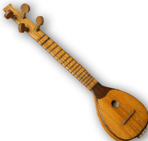
Slika 26. Tambura samica (Hrvatska tradicijska glazbala 18 )