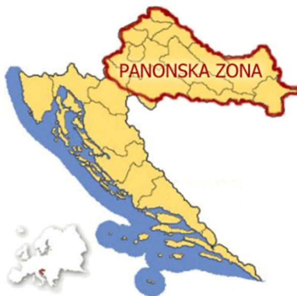
Slika 1. Panonska folklorna zona ( Hrvatski folklor 1 )

Većina kola izvodi se uz pjesmu, a ponekad se i uz pjesmu pojavljuje i svirka. Kola su često zatvorena te mogu biti veća ili manja. Njihov broj ovisi o broju plesača, ali i karakteristikama plesne zone. Prema alpskoj zoni češća su manja kola. Plesači unutar kola vezani su tako što svaki plesač pruža ruku drugom od sebe. Češće su rukama povezani prema naprijed, a rjeđe prema nazad, odnosno iza pojasa susjednih plesača. Veoma rijetko se plesači drže za dolje ispružene ruke, a plesačice im stavljaju ruke na ramena. Razlog tomu je što u većini slučajeva nema isti broj muških i ženskih plesača. Nekada davno, posebno su se izvodila ženska i muška kola ili bi muškarci i žene bili odijeljeni ako je riječ o zajedničkom kolu. Kola se uglavnom izvode u smjeru kazaljke na satu te su pomaci mali. Samim time, plesni prostor sveden je na minimum. Titranje, odnosno drmanje, unutar kola može biti blaže ili oštrije te to ovisi o geografskom položaju. Oštriji titraj karakterističan je za Bačku, Baranju, Podravinu, slavonsku Podravinu, Prigorje i Bosansku Posavinu, a blaži titraj karakterističan je za veći dio Slavonije. Stihovi pjesama često govore o seoskim problemima, prilikama i neprilikama, o seoskim aktualnostima, svekrvama, punicama i ostalo (Ivančan, 1996).