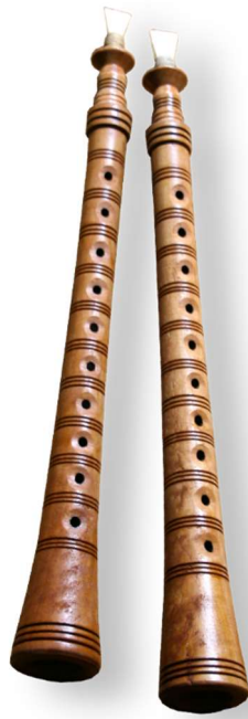
Slika 21. Banijske svirale (Hrvatska tradicijska glazbala 8 )