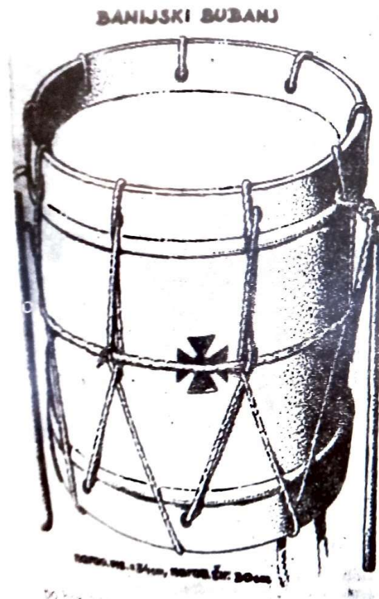
Slika 20. Banijski bubanj (Stepanov, 1964, str. 284)