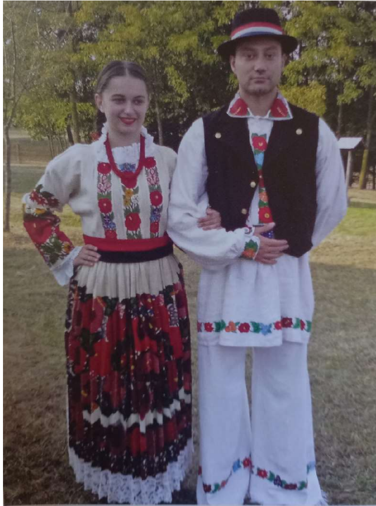
Slika 30. Muška i ženska narodna nošnja (Rizmaul, 2012, str. 105)

Za Prnjavor i Hrvatski Čuntić specifična je bijela narodna nošnja, odnosno bjelina. Ženska narodna nošnja sastoji se od gornjeg dijela koji sačinjavaju: oplećak s „rozanim“ rukavima, prsluka (lajbeca) od crnog pliša koji na sebi ima medaljicu i mašnu te od donjeg dijela: podsuknje, suknje (krila), zastora (pregače), tkanog pojasa i vezene maramice. Na glavi se nalazi peča koja na sebi ima cvjetne ukrase (perljine), a na nogama se nalaze opanci te končane pletene čarape. Od nakita nose ogrlice od crvenih perlica te se naziva još gerdan (Slika 31.).