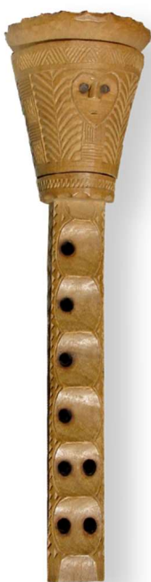
Slika 24. Diple (Hrvatska tradicijska glazbala 13 )