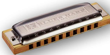
Slika 23. Usna harmonika (Hrvatska tradicijska glazbala 11 )