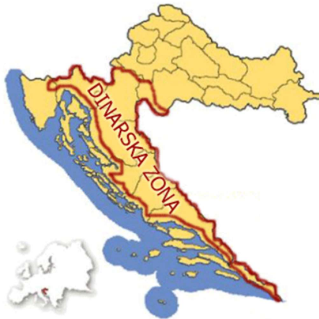
Slika 3. Dinarska folklorna zona ( Hrvatski folklor 2 )

Dinarska zona proteže se južno od Save i Dunava, a istočno od granice alpske i jadranske zone. Njezine granice možemo vidjeti i na karti (Slika 3). Isto tako, može se vidjeti kako dinarska zona većinom obuhvaća područje Gorske Hrvatske. Regije koje ovo područje obuhvaća su: Lika, Gorski kotar, dalmatinsko zaleđe, Banovina i Kordun.