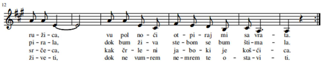
Slika 8. Notni zapis pjesme „Dober večer z mega srca ružica“ (Digitalna platforma Izzi, 2019)