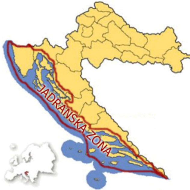
Slika 5. Jadranska folklorna zona ( Hrvatski folklor 3 )

Jadranska zona proteže se cijelom obalom Jadranskog mora te obuhvaća Istru i otoke hrvatske obale (Slika 5). Treba se izdvojiti Zadarsko i Šibensko primorje i otoke koji većinom sadrže dinarske elemente. Isto tako, jadranski se elementi pojavljuju u sjevernom dijelu Like i u zaleđu poluotoka Pelješca (Ivančan, 1996).