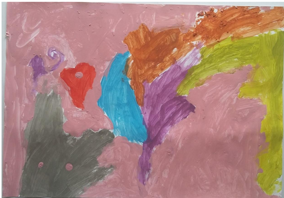
Slika 4 Vida (4) „Grom je tu i nevrijeme“

Vida (4) je u svojem radu prikazala grom na nebu uslijed nevremena. Tijekom motivacije u srednjoj dobnoj skupini djeca su prilikom promatranja fotografije djela „Zvezdana noć“ napomenula kako ih nebo podsjeća na olujno nebo u nevremenu. Vidu je stoga motiv neba na djelu asociirao na vlastito iskustvo nevremena i gromova na nebu. Možemo primijetiti kako je grom u nekoliko boja na ružičastoj podlozi koja predstavlja nebo. Na ovom radu ne pronalazimo tehniku slikanja kratkim potezima već je ovdje preuzet motiv neba i nevremena potaknut unutarnjim porivima i vlastitim asocijacijama, doživljajima umjetničkog djela. (slika 4)