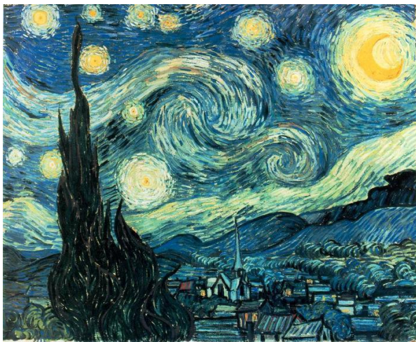
Slika 1 "Zvezdana noć"

„Zvezdana noć“ (slika 1) iz 1889. izrađena je tehnikom ulja na platnu u dimenzijama 73,7 cm x 92,1 cm. Na ovom djelu umjetnik je iskazao unutarnji, subjektivni doživljaj prirode. Korišteni su debeli namazi boje, a čempresi koji podsjećaju na plamen spajaju uzburkano nebo i mirno selo.