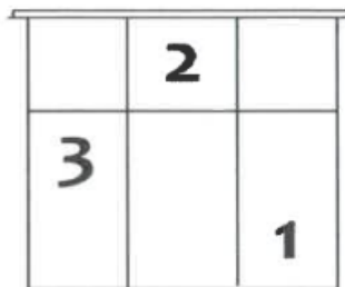
Slika 1. Teren mini odbojke (Hrvatski odbojkaški savez)

Ekipa mora imati najmanje 6 igrača kako bi mogla sudjelovati i igrati utakmicu, a najviše može imati 14 igrača. Na terenu uvijek stoji ekipa od 3 igrača. Svaki od njih stoji u svojoj zoni, zoni 1 (natrag desno), zoni 2 (naprijed na mreži) i zoni 3 (natrag lijevo).