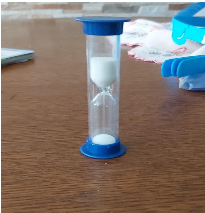
Slika 2. Pješčani sat kojim se mjerilo vrijeme pogađanja u igri Tko je to