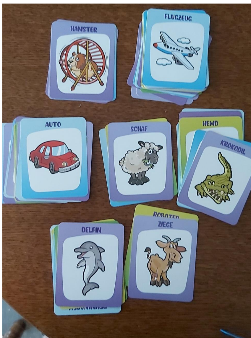
Slika 1. Sličice iz društvene igre Overheadz za igru Tko je to?