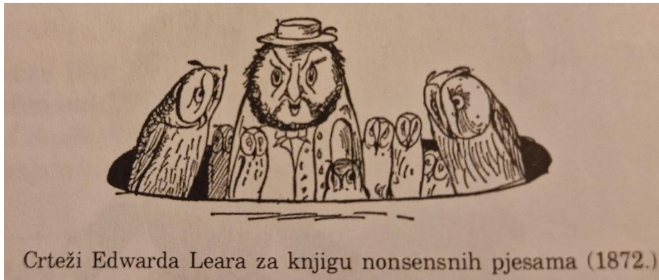
Slika 1:

Primjer slike 1 je ilustracija Learovog limericka o starcu s bradom, u kojoj su sove, ševe i kokoš napravile svoja gnijezda – što je primjer besmisla zato što životinje ne rade gnijezda u bradama.