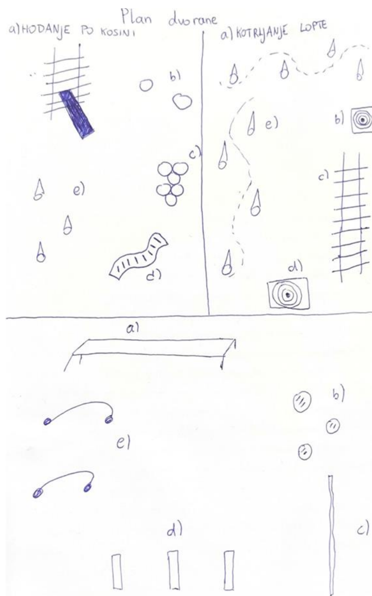
Slika 2. Plan dvorane za glavni „A“ dio sata.