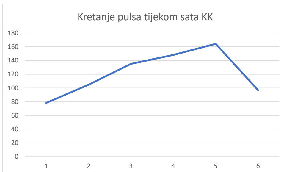
Graf 1. Krivulja prosječnog kretanja pulsa tijekom sata Kineziološke kulture...

Aritmetička sredina inicijalnog mjerenja, odnosno mjerenja srčanih frekvencija prije početka sata manja je od izmjerene srčane frekvencije na završetku sata Kineziološke kulture. Iz tablice je vidljivo da je prema izračunatoj aritmetičkoj sredini, fiziološko opterećenje bilo najveće nakon glavnog „B“ dijela sata. Raspon podataka iskazuje razliku između maksimalne i minimalne vrijednosti. Najveća razlika je nakon opće pripremnog dijela sata, a najmanja u glavnom dijelu sata. Sljedeći podatak u tablici je standardna devijacija koja iskazuje odstupanja od prosjeka– aritmetičke sredine. Nakon pripremnog dijela sata odstupanje je najveće, dok je nakon glavnog „B“ dijela sata najmanje.