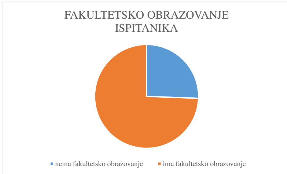
Graf 2 Struktura ispitanika prema obrazovanju

Jedna od nezavisnih varijabli bila je i spol djeteta čiji roditelj je sudionik istraživanja. U istraživanju je sudjelovalo 46,3% roditelja ženske djece i 53,7% roditelja muške djece (Graf 3).