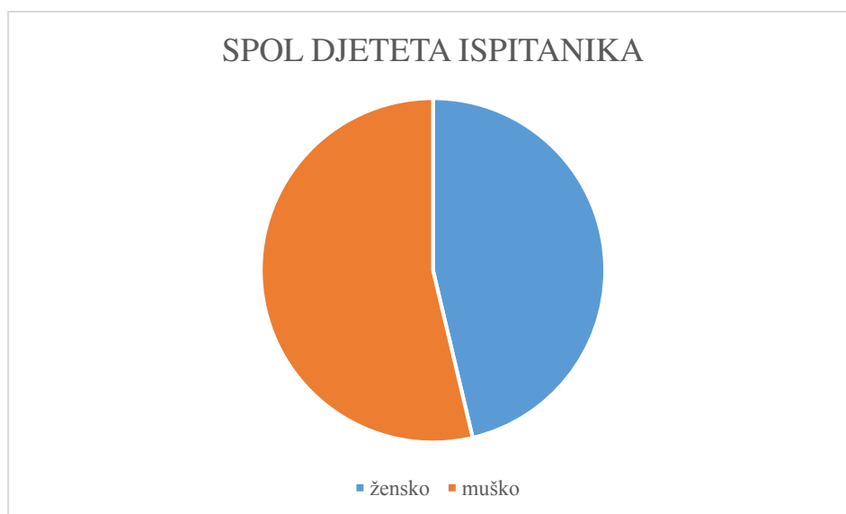
Graf 3 Struktura ispitanika prema spolu njihovog djeteta

Jedna od nezavisnih varijabli bila je i spol djeteta čiji roditelj je sudionik istraživanja. U istraživanju je sudjelovalo 46,3% roditelja ženske djece i 53,7% roditelja muške djece (Graf 3).