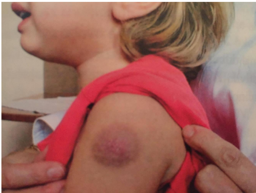
Slika 1. Ubrzana reakcija na ponovno BCG- cijepljenje u djeteta s urednim ožiljkom od ranijeg cijepljenja.

Takva posljedica vjerojatno se javlja zbog primljene veće doze i/ili dublje primjene cjepiva. Komplikacija je postala rjeđa nakon uvođenja preciznijih doza. Promjene obično nestaju nakon nekoliko tjedana. Ukoliko se cijepi dijete kojemu je već uspostavljena imunost, javlja se ubrzana reakcija. Tada se u roku od 2 do 7 tjedana razvija burna lokalna reakcija (slika 2.) Promjene se prate i po potrebi previjaju.