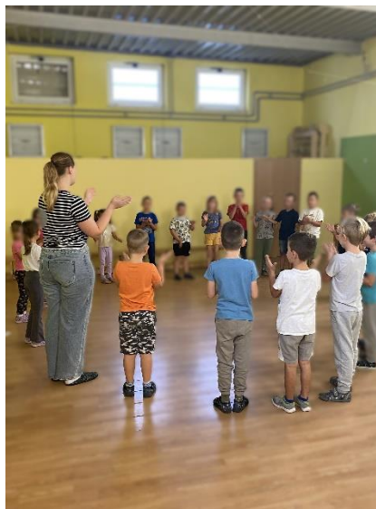
Slika 3. Izvođenje igre s pjevanjem