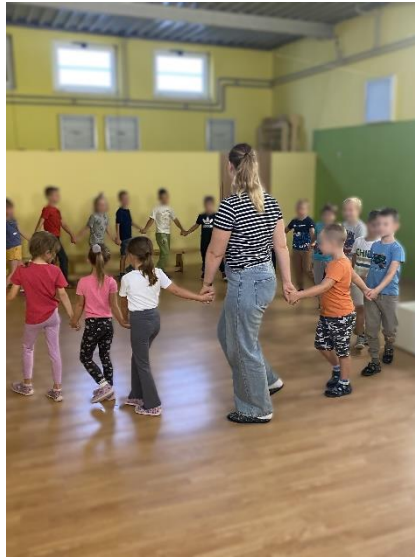
Slika 2. Izvođenje igre s pjevanjem

puta jer su djeca baš to zahtijevala. Iz njihovih osmjeha i želje za ponavljanjem ove igre s pjevanjem moglo se je naslutiti da uživaju u izvođenju.