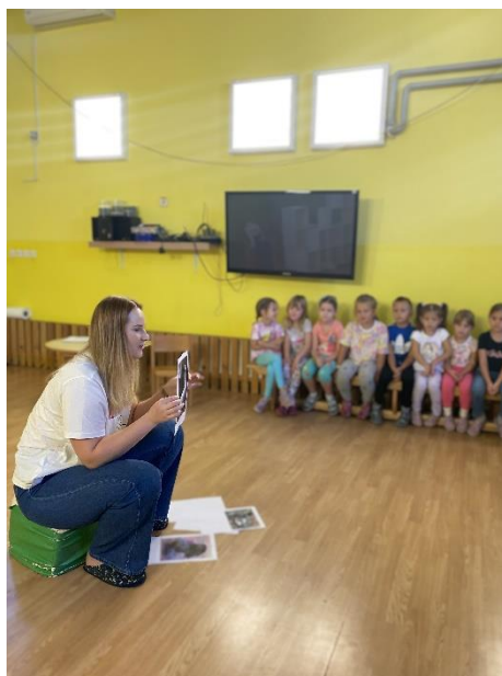
Slika 5. Motivacija - razgovor o domaćim životinjama