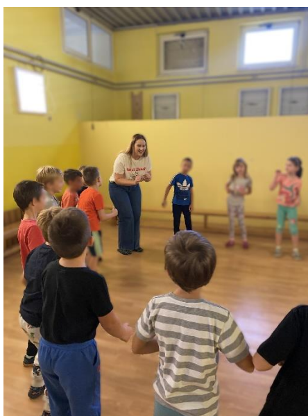
Slika 6. Izvođenje dječje tradicijske pjesme uz ples