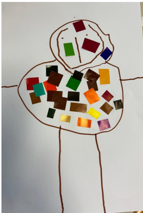
Slika 8. Portret prijatelja (Niko, 4 god., 2024.)

Dječaku Niki bila je izrazito zabavna ova aktivnost, poigrao se kolažem i zalijepio ga je posvuda, čak i na lice. Dječak je na početku faze izražavanja složenim simbolima. Na prikazu njegovog prijatelja vidimo da nije sastavljen samo od glave i nogu, nego imamo i tijelo; nema toliko detalja koliko je inače često u ovoj fazi. Na upit o svom radu rekao je: „Napravio sam ova velika usta zato šta se Ivano stalno smije.“ Time pokazuje kako primjećuje raspoloženja i emocije svojih prijatelja.