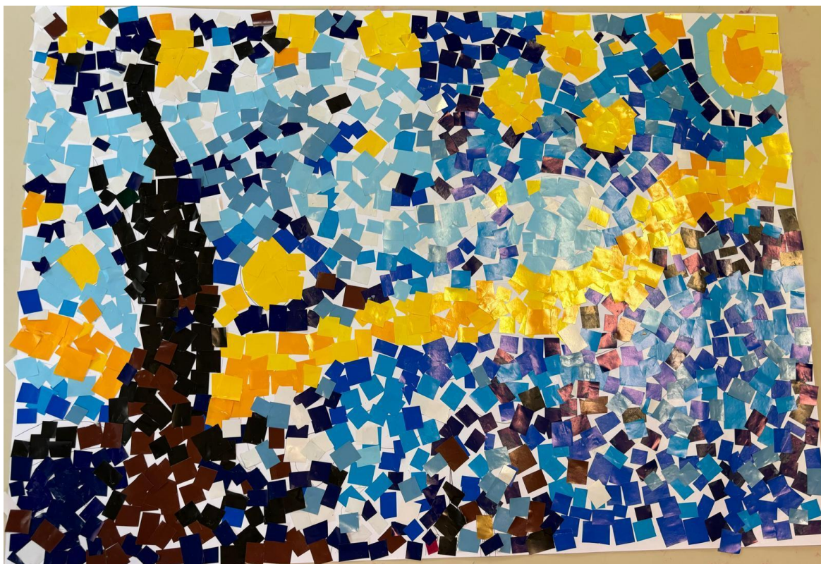
Slika 15. Zajednički rad djece potaknut van Goghovim djelom „Zvezdana noć“

Djeca su radeći ovu likovnu aktivnost uvidjela pravu važnost timskog rada i surađivanja. Nakon što smo nacrtali skicu olovkom, zajednički smo se dogovorili koje nijanse kojih boja će ići na koji dio rada. Nakon dogovora, tri djevojčice i dva dječaka krenuli su lijepiti papiriće. Neko vrijeme su lijepili, dogovarali se tko će lijepiti koji dio, a zatim su se i druga djeca htjela uključiti. Djeca, koja su dio slike već napravila, otišla su se dalje igrati poticajima kako bi bilo mjesta za novu djecu. Neki od komentara djece bili su: „Jedva čekam da bude gotovo, bit će super!“; „Oćeš nam ti ovo ostavit' u sobi da stavimo na zid?“; „Baš mi je zabavno.“ Iz navedenih dječjih izjava vidimo kako su bila ponosna na sebe, uživali su u procesu i sve im je ovo bilo izrazito zabavno. Sjedili su i lijepili, usredotočili se, ali nitko ih nije tjerao ni na što pa su zato toliko aktivno sudjelovali i igrali se. Ovim sam dječjim radom jako zadovoljna; bilo nam je zabavno i kroz igru i smijeh smo napravili prekrasno umjetničko djelo.