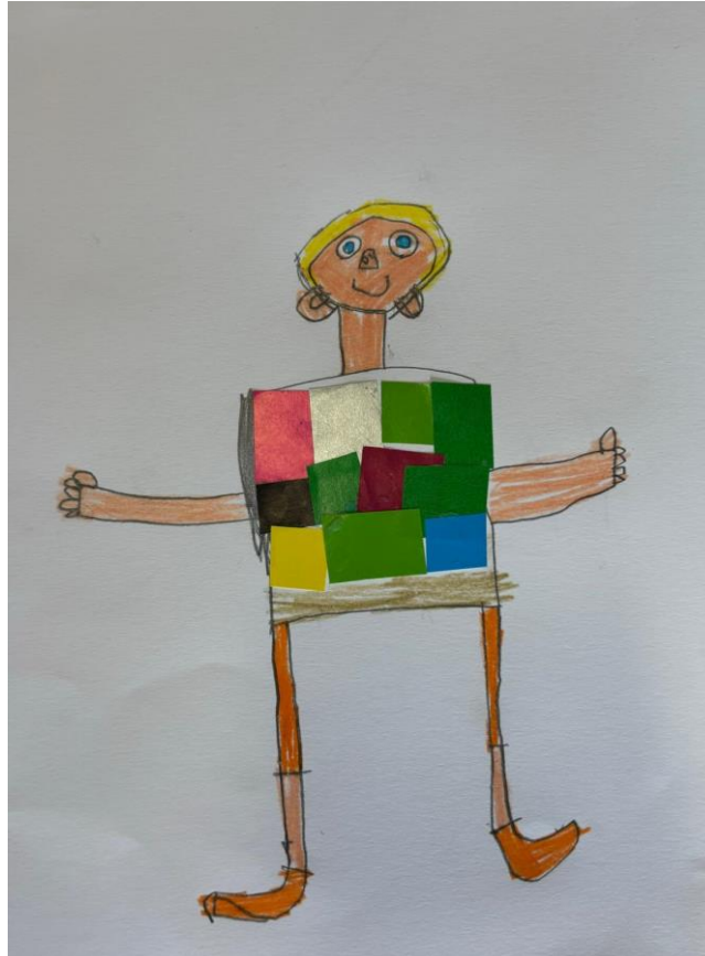
Slika 7. Portret prijatelja (Filip, 7 god., 2024.)

Dječak Filip nacrtao je svog prijatelja Vitu. Uložio je puno truda u svoj rad i jako se usredotočio. Bio je zadovoljan krajnjim rezultatom, a kada je završio, pozvao me da mi pokaže: „Gledaj kak' sam mu od ovih papirića napravio njegovu šarenu majicu!“ Dječak Filip nalazi se u fazi intelektualnog realizma, u kojem je karakterističan šabloniziran način rada, kojeg pomalo možemo uočiti. Na crtežu vidimo mnoge detalje poput prstiju, nosa, plave boje očiju te vidimo originalan način prikaza majice.