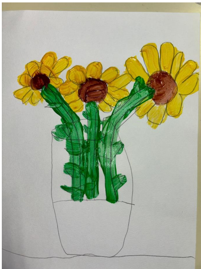
Slika 10. Suncokreti potaknuti van Goghovim djelom „Suncokreti“ (Tamara, 6 god., 2024.)

Djevojčica Tamara naslikala je tri suncokreta koja su bila u vazi na stolu ispred nje. Njezin komentar na ovu aktivnost bio je: „Baš sam ko prava slikarica!“ Iz njezinog komentara možemo uočiti da je zadovoljna svojim djelom te da se za vrijeme slikanja osjećala kao prava umjetnica, baš kao van Gogh. Ona se prema svojoj dobi nalazi u fazi izražavanja složenim simbolima, a možemo se uvjeriti u to uočavajući detalje na njezinoj slici. Također, vidimo liniju tla, odnosno u ovom slučaju stola; figure više ne lebde u zraku, a to je karakteristično za ovu fazu.