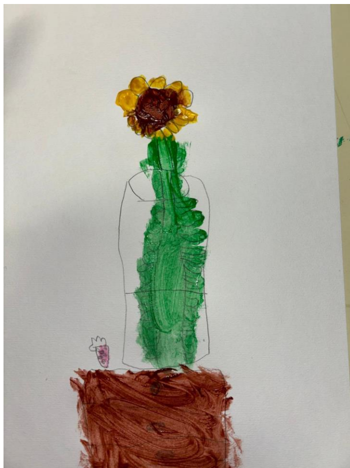
Slika 13. Suncokreti potaknuti van Goghovim djelom „Suncokreti“ (Slavica, 4 god., 2024.)

Djevojčica Slavica iznimno se potrudila oko svog suncokreta. Rekla je da će ona naslikati jedan, ali da će biti jako lijep pa neće stići druge naslikati. Iako je mlađa od druge djece, vidimo kako se usredotočila na detalje kod svoga suncokreta, čak je nacrtala i stol.