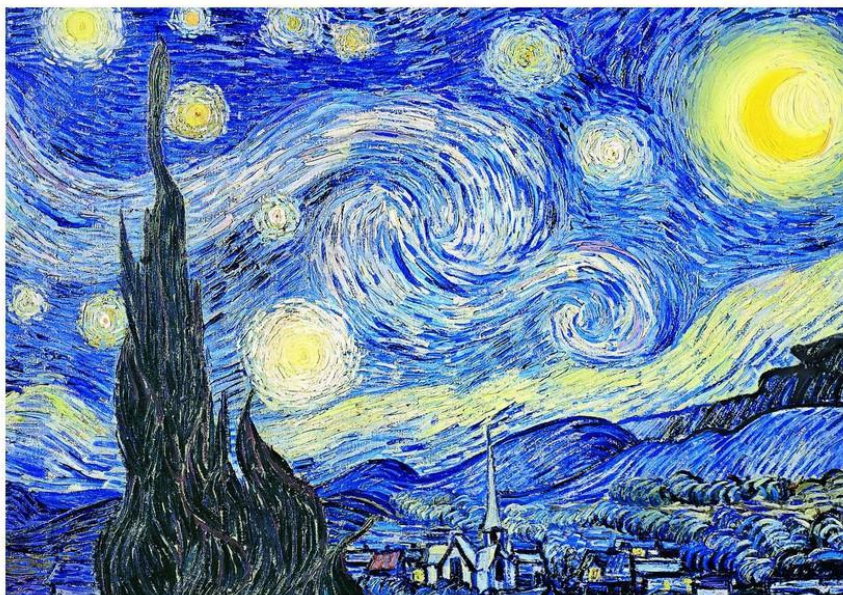
Slika 4. „Zvezdana noć“ (Vincent van Gogh, 1889.)