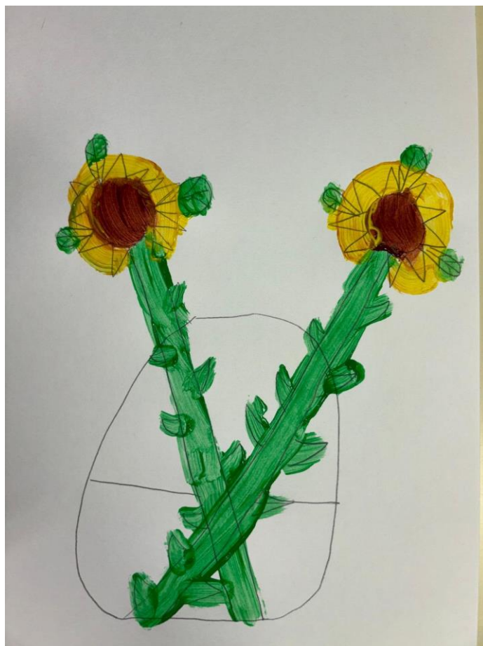
Slika 12. Suncokreti potaknuti van Goghovim djelom „Suncokreti“ (Tea, 6 god., 2024.)

Djevojčica Tea naslikala je dva suncokreta. Kao što se vidi na slici, djevojčica se usredotočila na detalje i odlučila ih je istaknuti, a to je jedna od značajki faze izražavanja složenim simbolima. Ona mi je na pitanje kako se osjeća rekla: „Ja se osjećam sretno dok slikam.“