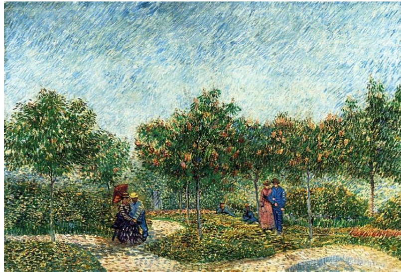
Slika 2. „Park u Asnieresu“ (Vincent van Gogh, 1887.)

https://www.wikiart.org/en/vincent-van-gogh/the-voyer-d-argenson-park-in-asnieres-1887 (preuzeto 21. 5. 2024.)