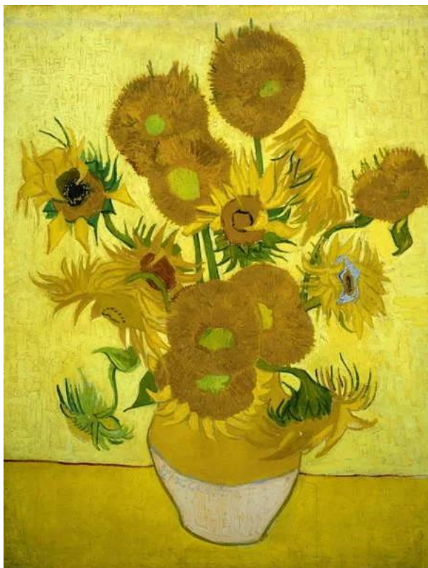
Slika 3. „Suncokreti“ (Vincent van Gogh, 1888.)

https://www.europosteri.hr/art-photo/vincent-van-gogh-suncokreti-v51033