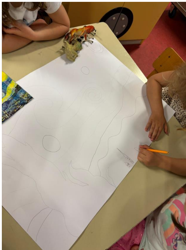
Slika 14. Djevojčice crtaju skicu za izradu plakata (2024.)

Likovna tehnika korištena u trećoj aktivnosti bila je kolaž. Djeca su se za početak ponovno poigrala poticajima, a uvod u aktivnost bio je razgovor. Razgovarali smo o prijateljstvu, suradnji, dogovoru i zajedništvu. Rekla su svoja mišljenja o tome, koliko im je to važno i koliko je lijepa stvar u životu imati prave prijatelje s kojima možeš razgovarati, igrati se i dogovarati. Također smo razgovarali o noći, o mraku, o zvijezdama i o svjetlosti koju dobivamo od zvijezda. Nakon razgovora uslijedilo je zajedničko rezanje papirića različitih nijansa plave, žute, narančaste i smeđe boje. Dok su djeca rezala papiriće, tri djevojčice su uz moju pomoć napravile skicu na velikom plakatu, što vidimo na slici 14. Kada su djeca to napravila, krenula su lijepiti papiriće na veliki plakat i nakon nekog vremena dobili smo predivan zajednički rad djece na temu slike van Gogha „Zvezdana noć“ (slika 15.)