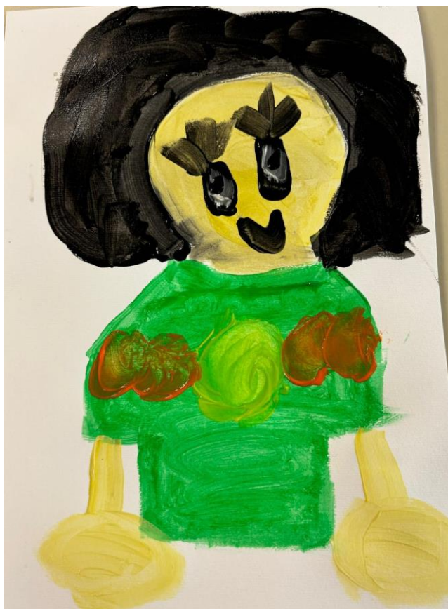
Slika 6. Portret prijatelja (Tea, 6 god., 2024.)

Djevojčica Tea nacrtala je portret svoje prijateljice Mihaele. Bila je jako ponosna na sebe i zadovoljna time kako ju je prikazala. Djevojčica bi prema svojoj dobi trebala biti u fazi izražavanja složenim simbolima što vidimo kroz isticanje različitih detalja poput trepavica i cvijeća na majici. Samouvjereno je pitala: „Je l' vidiš kak' sam joj nacrtala ovo cvijeće na majici, izgleda ko pravo?“ Na prikazu njezine prijateljice vidi se tijelo te ruke kako izlaze iz njega, međutim ne vidimo prste na rukama, što je inače često u ovoj fazi.