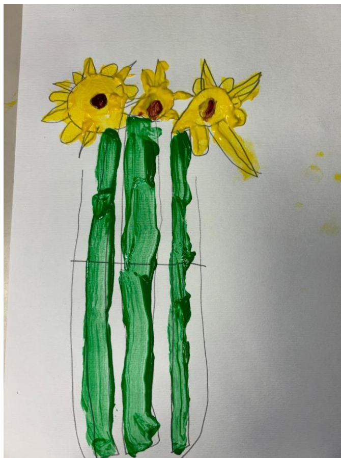
Slika 11. Suncokreti potaknuti van Goghovim djelom „Suncokreti“ (Luka, 5 god., 2024.)

Dječak Luka naslikao je tri suncokreta u vazi koja je bila ispred njega. Djeci sam za vrijeme slikanja postavila pitanje kako se osjećaju dok slikaju, a dječak Luka mi je odgovorio: „Ja se osjećam baš opušteno, sigurno je tak' i drugim slikarima kad slikaju.“ Luka se nalazi u fazi izražavanja složenim simbolima, međutim nema toliko detalja na slici kao što je inače uobičajeno za djecu u ovoj fazi likovnog izražavanja, ali je vidljiv njegov trud oko latica i kako je istaknuo da su neke latice veće, a neke manje.