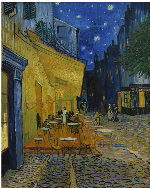
Slika 5. „Cafe Terrace, Place du Forum, noću“ (Vincent van Gogh, 1888.)

https://en.wikipedia.org/wiki/Caf%C3%A9_Terrace_at_Night (preuzeto 25. 6. 2024.)