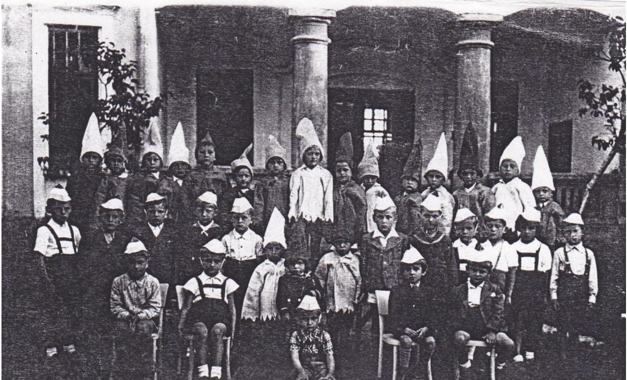
Slika 2. Dječje zabavište osnovano 1941. godine u Virovitici (Izvor:

Slijedeći zapis o ranom predškolskom odgoju u Virovitici je izdan 1941. godine, gdje se spominje prvo Dječje zabavište u Virovitici, koje je otvoreno od strane hrvatskih školskih sestara. U prvom krugu upisa u Dječje zabavište je upisano 85 djece. Iste godine doneseno je Rješenje o osnivanju i otvaranju zabavišta u nadležnosti časnih sestara iz rada školskih sestara sv. Franje. Ovo zabavište pohađalo je 95 djece, a bilo je smješteno u oštećenoj zgradi samostanske ljekarne (Slika 2) (Dječji vrtić Cvrčak, 2024).