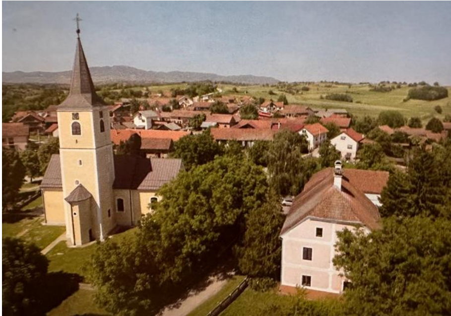
Fotografija 1: Panorama naselja Miholec, pogled od župne crkve Sv. Mihaela