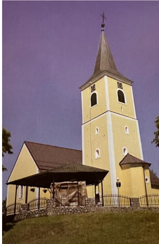
Fotografija 4: Crkva Sv. Mihaela vrijedna je barokizirana gotička građevina