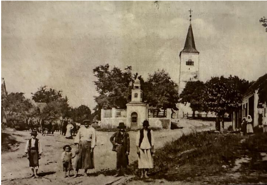
Fotografija 3: Jedinствена razglednica Miholca s početka 20. stoljeća