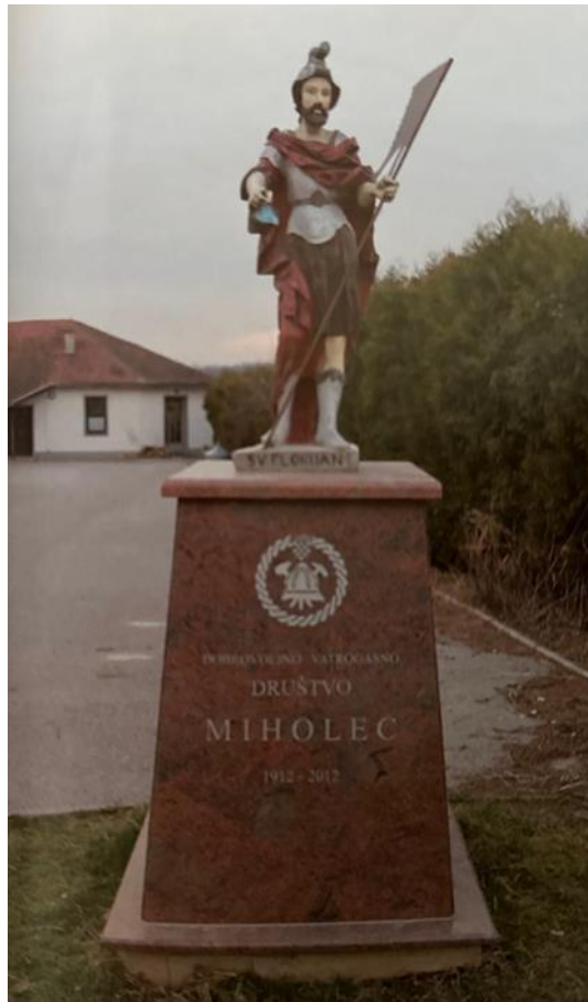
Fotografija 5: Spomenik Sv. Florijanu pred vatrogasnim domom u Miholcu