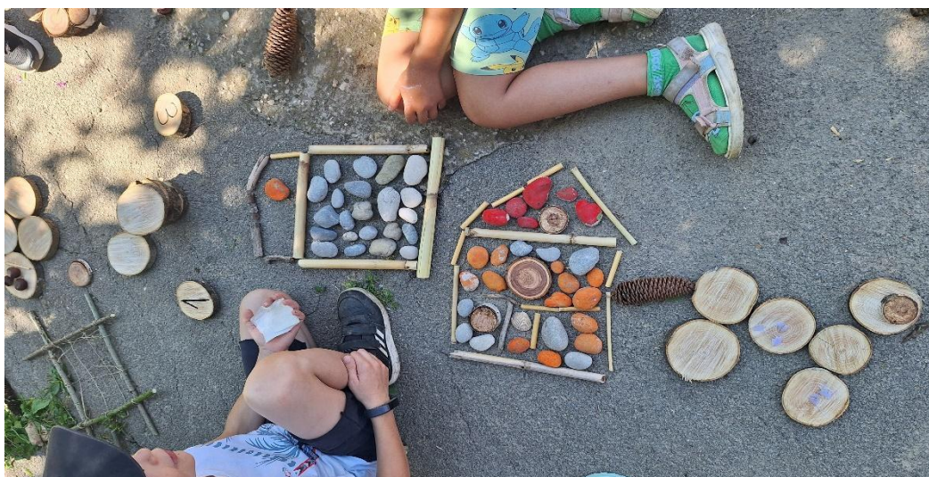
Slika 19