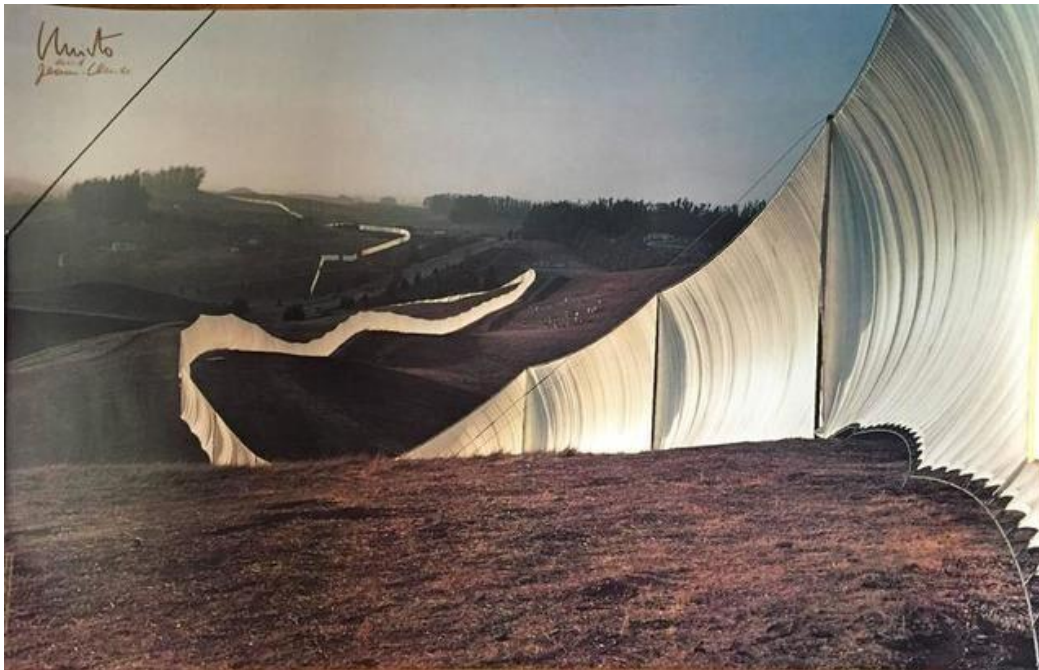
slika: Running Fence

7,503 narančastih vrata duž staza parka, a svako vrata imalo je srebrne panelne trake koje su se micala na vjetru. Christo i Jeanne-Claude financirali su svoje projekte prodajom skica, crteža i modela vezanih uz projekte. Također su odbijali prihvatiti sponzorstva ili donacije kako bi zadržali potpunu umjetničku kontrolu nad svojim projektima. Svaki njihov projekt zahtijevao je godine planiranja, pregovaranja s vlastima i logističke pripreme prije nego što bi bio realiziran. Jedna od najvažnijih karakteristika njihovih projekata bila je njihova privremena priroda. Većina instalacija trajala je samo nekoliko tjedana ili mjeseci prije nego što bi bile uklonjene, što dodatno naglašava njihovu jedinstvenost i prolaznost. Christo je nastavio s umjetničkim projektima nakon Jeanne-Claudeove smrti 2009. godine, ističući se svojom strašću i predanošću prema umjetnosti koju su dijelili. Njihov rad ostaje inspiracija za umjetnike diljem svijeta, a njihova naslijeđa će živjeti kroz njihova djela koja su ostavila trajan utjecaj na kulturu i umjetnost