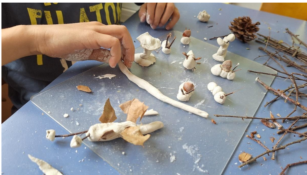
slika 8

Materijala i prirodnina sakupili smo s vremenom sve više tako da su i dječji radovi postajali sve bogatiji i zanimljiviji.