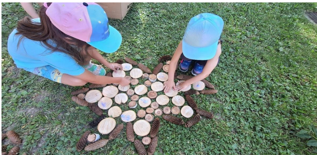
slika 18