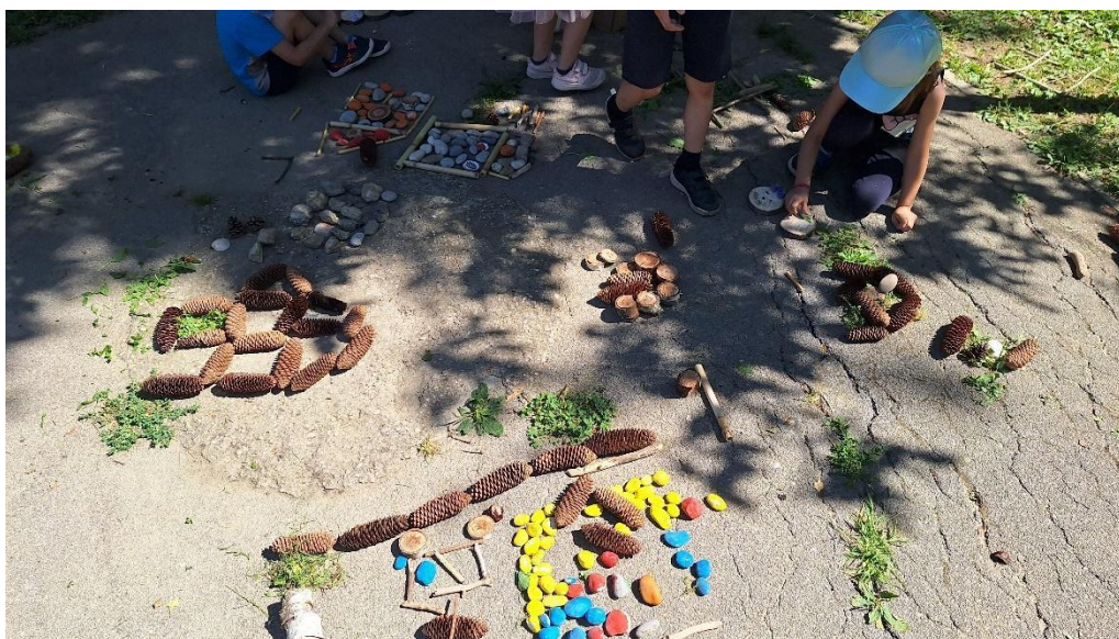
slika 21 (privatna arhiva)