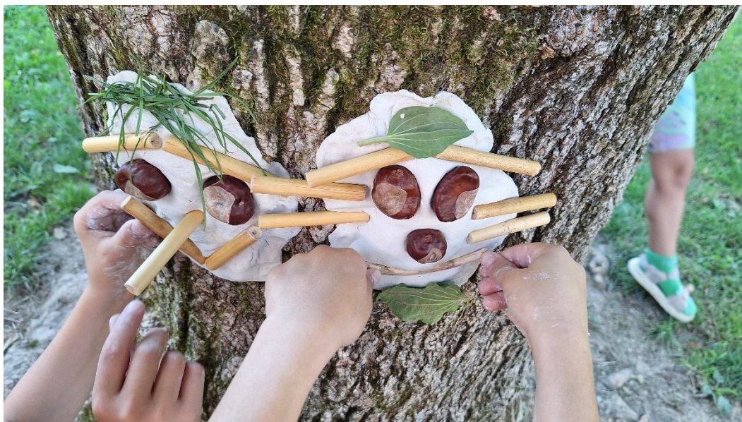
slika 17

Školjke i morski organizmi - na obalnim područjima, školjke i morski materijali mogu se koristiti za dekorativne i strukturalne elemente.