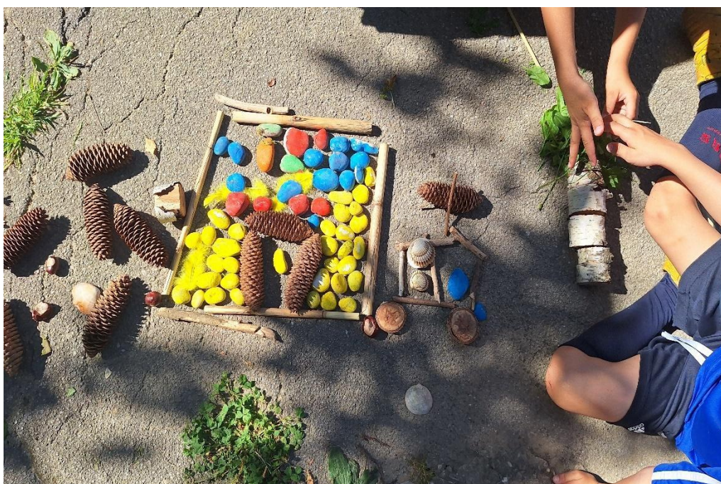
slika 20