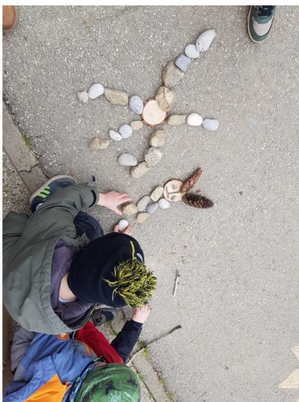
slika 5