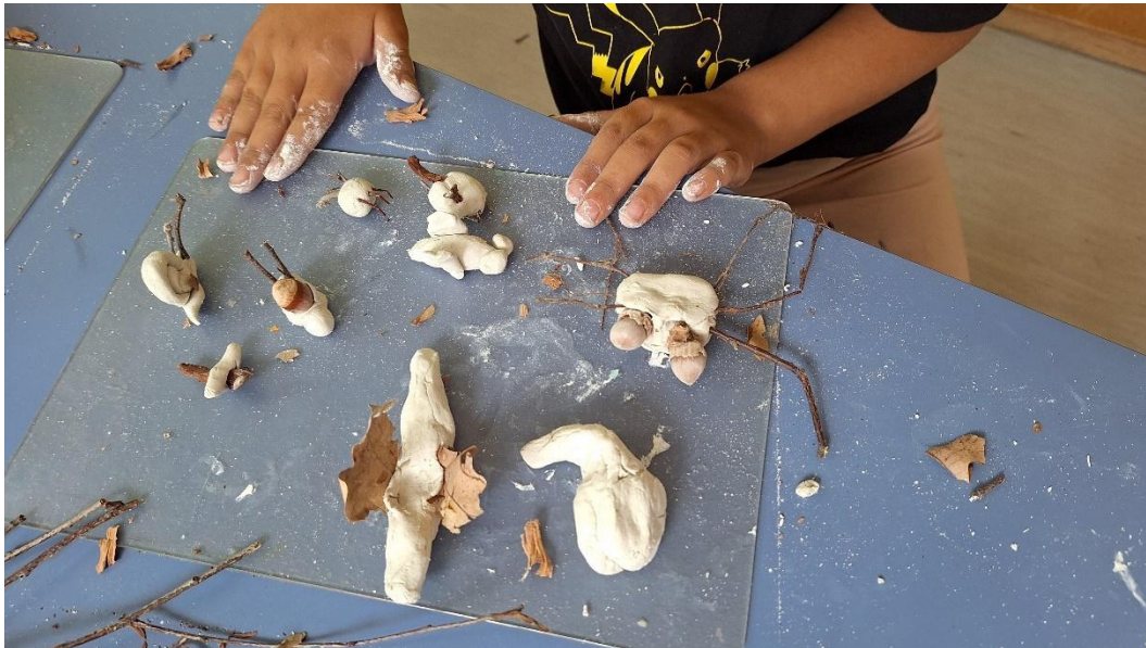
slika 7

Projekt smo nastavili u sobi dnevnog boravka skupine za vrijeme kišnog vremena. Djeci sam ponudila glinamol, suhe grančice te druge prirodne (češere, žirove, suho lišće). Plakat s kukcima nalazio se na zidu sobe tako da su djeca spontano odlučila izraditi neke od kukaca s plakata. Nastali su sljedeći radovi: