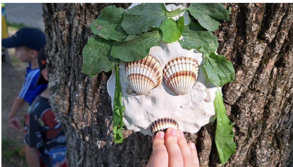
slika 22