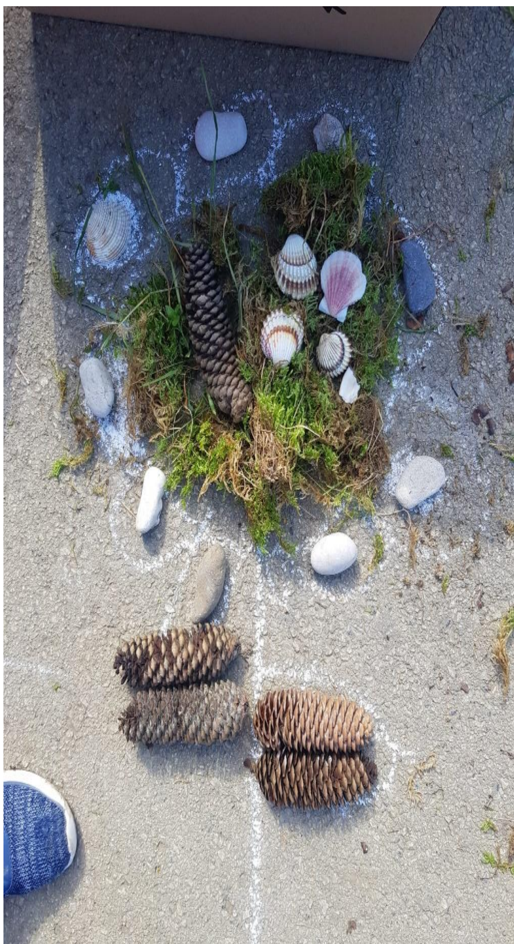
slika 10