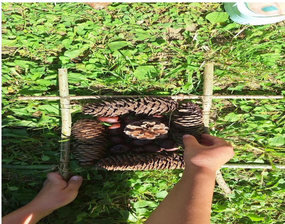
slika 16

Navodim neke od najdostupnijih materijala u prirodi, s kojima smo radili land art u našem vrtiću: