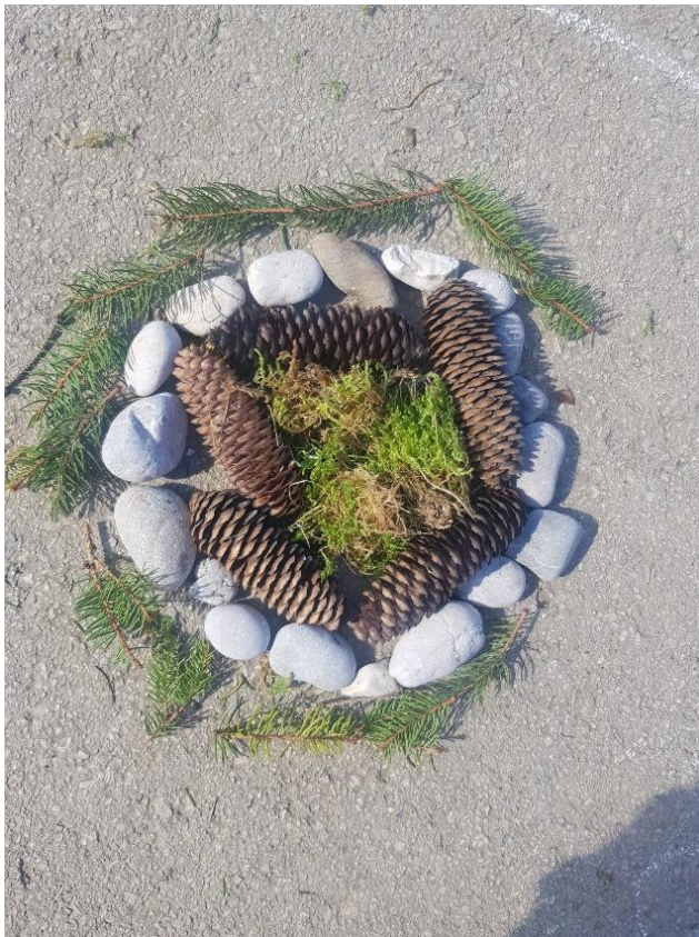
slika 2