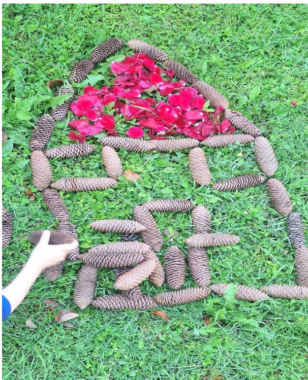
slika 14