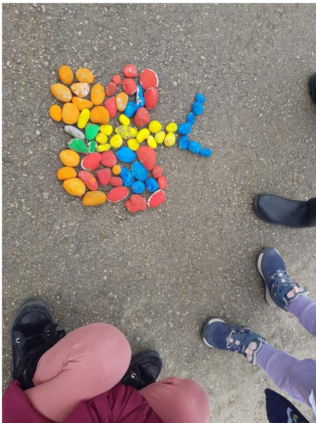
slika 3