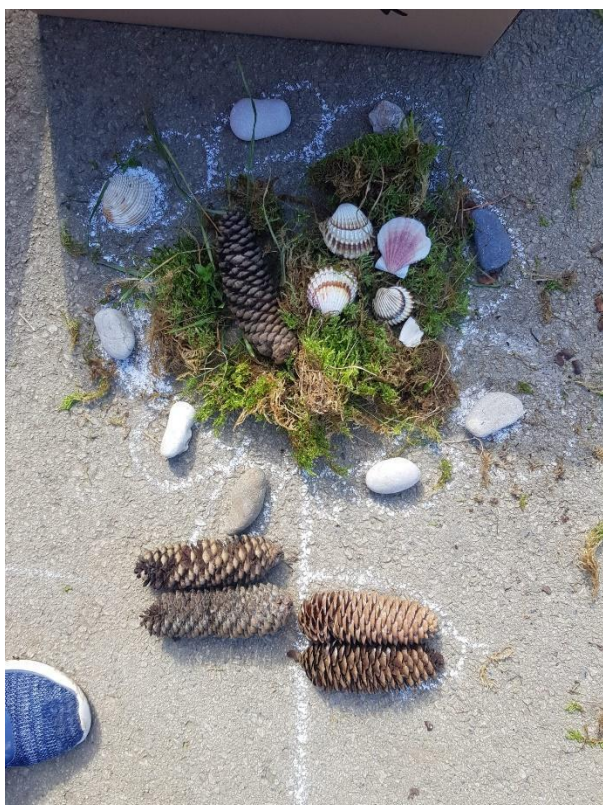
slika 4