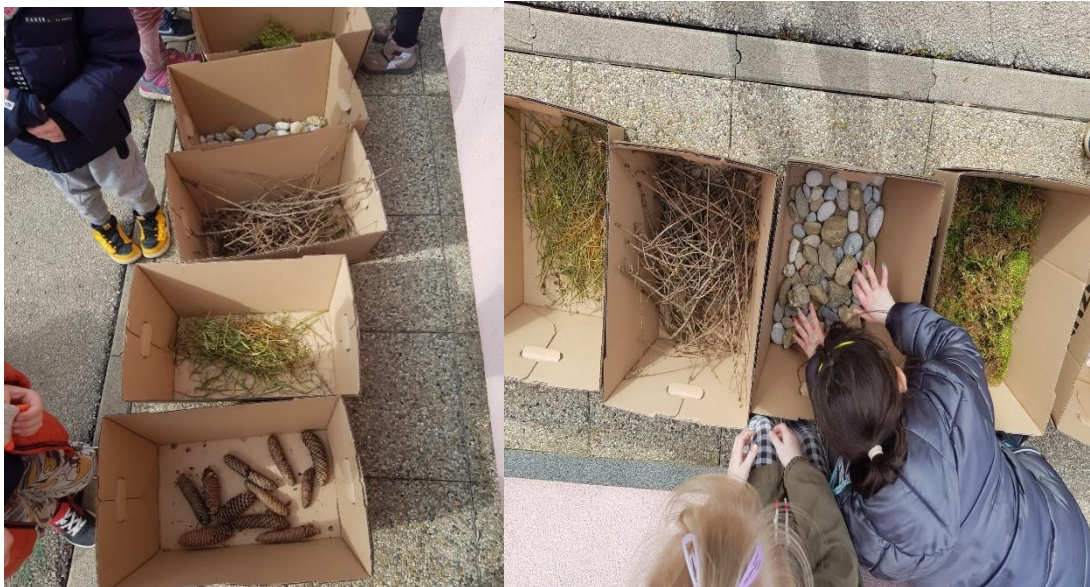
slika 1

prikupljanju materijala kao i poštovanja prirode. Djeca trebaju naučiti da ne uništavaju biljke ili uzimaju previše materijala.