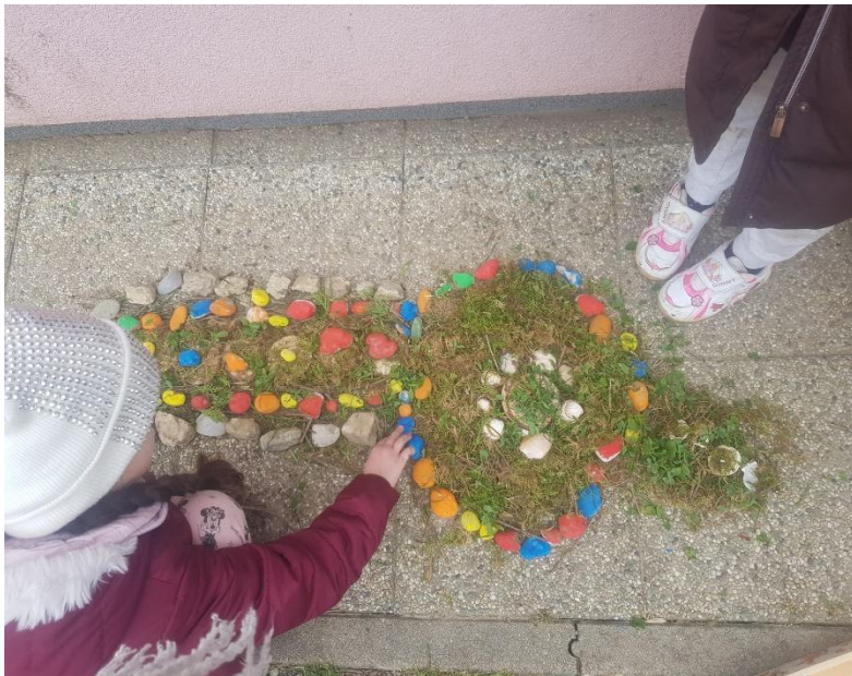
slika 13