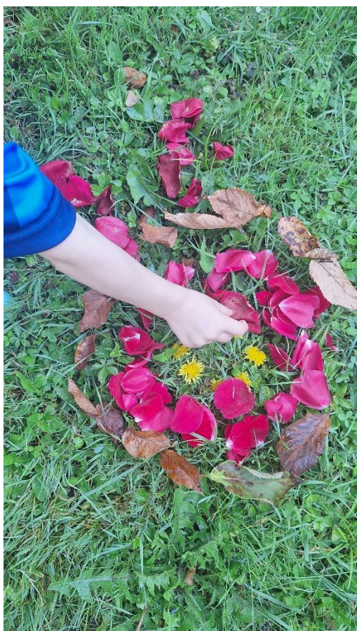
slika 6

Izdvojila bih nekoliko izjava djece o land artu tijekom rada na projektu :