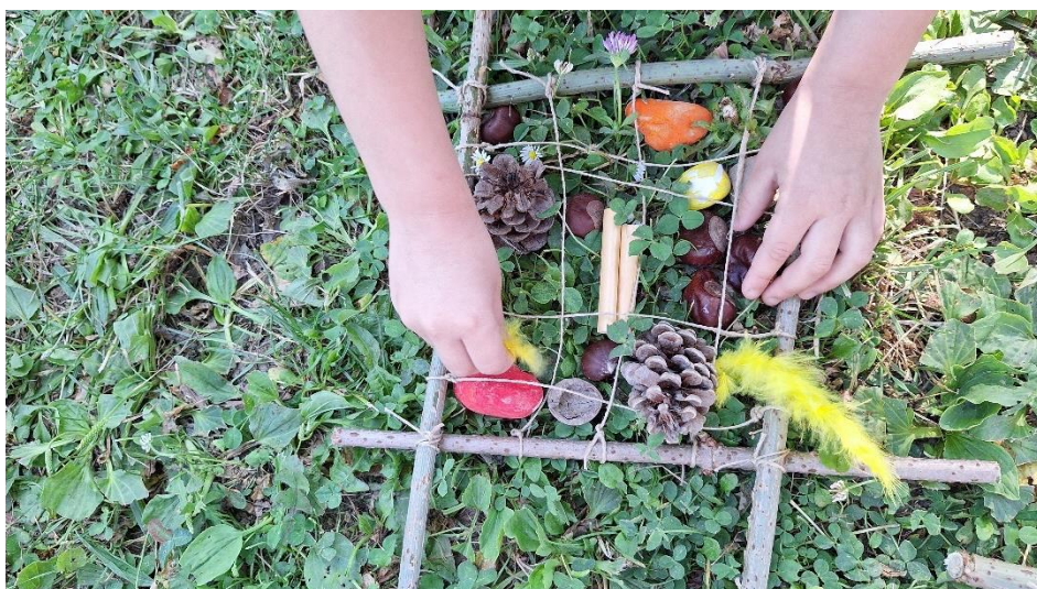
slika 15