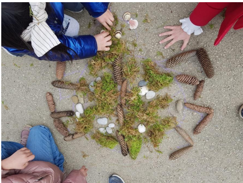
slika 11 (privatna arhiva)