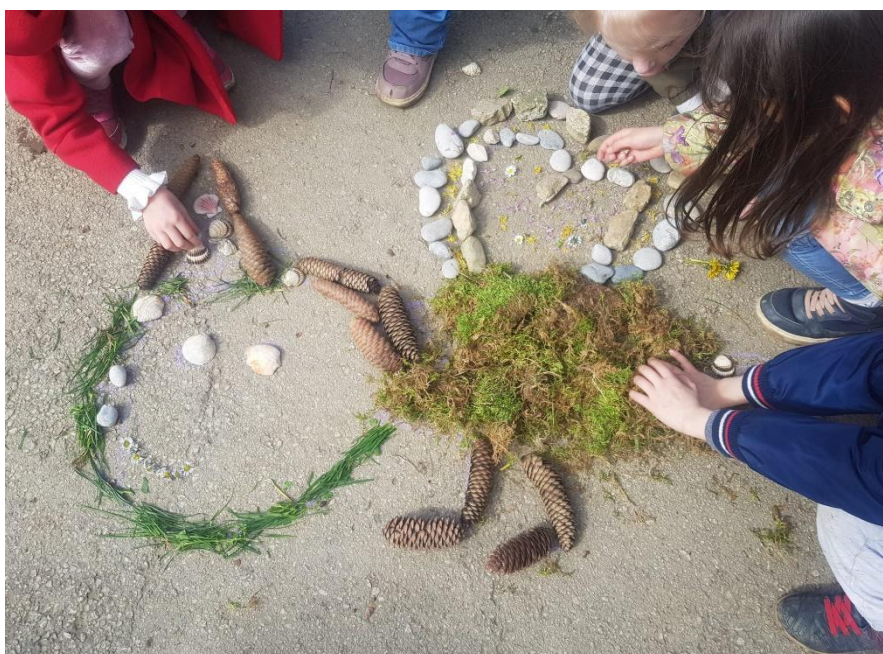
slika 9

Materijala i prirodnina sakupili smo s vremenom sve više tako da su i dječji radovi postajali sve bogatiji i zanimljiviji.