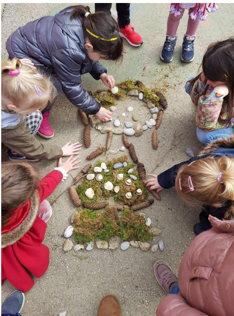
slika 12