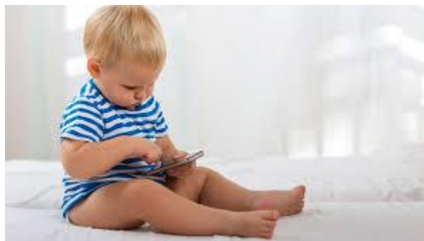
Slika 2. Prikaz djeteta koje gleda mobitel

Tu dolazi i do korištenja suvremene tehnologije u prevelikoj mjeri. Roditelji djeci, u nedostatku vremena, ali i zbog djetetovih zahtjeva, prerano dopuštaju korištenje mobilnih telefona, tableta, laptopa. Sadržaji koji se nude mogu biti od koristi ako su kvalitetni i koriste se umjereno. No danas se nude djeci od najranije dobi što svakako nije prikladno. Prema Žderić (2009) vidljive su negativne posljedice prekomjernog korištenja interneta kod mlađe djece. Nadalje Brezičević (2018) govori o djeci kao podložnijima negativnom utjecaju medija zbog stupnja razvoja u kojem se nalaze. No upozorava i na važnost roditeljskog utjecaja na vrijeme koje dijete provodi koristeći medije. Nešto starija djeca predškolskog uzrasta igraju igrice na mobitelima ili video igrice, što nikako ne može pozitivno utjecati na njihov razvoj. Danas se djeca rađaju u suvremenom svijetu u kojem je sve dostupno. Od najranije dobi kada rukom mogu dohvatiti neku stvar, u njihovim rukama su pametni telefoni. Oni s njima rastu, tako da kasnije ne mogu zamisliti život bez njih. Nešto starija djeca se nalaze u parku, sjede na klupici jedan pored drugog i igraju igrice svatko na svojem mobitelu. Ljudi se približavanjem tehnologiji udaljuju jedni od drugih, što se primjećuje već u djetinjstvu.