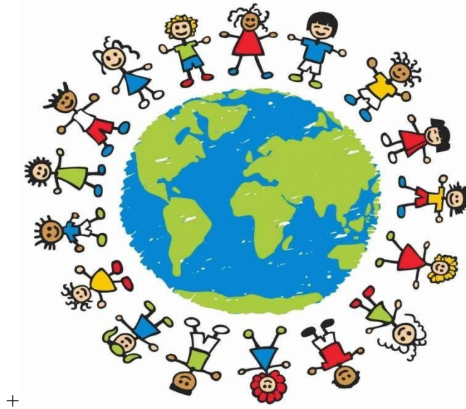
SLIKA 1. Prava djece

Opća deklaracija o ljudskim pravima je dokument koji govori o ljudskim pravima, a potječe iz 1948. godine. Na Općoj skupštini Ujedinjenih naroda, 1959. godine nastaje Deklaracija o pravima djeteta u kojoj su definirana prava djeteta. Ovom deklaracijom čovječanstvo je dobilo novi uvid u vrijednosti. Nakon ovog slijede dokumenti kao što su Konvencija o pravima djeteta iz 1989. godine. Važnost je na odraslima da djeca znaju svoja prava, kao i odgovornosti koje njima dobivaju.