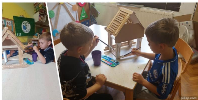
Slika 38. Ponovna izrada kolibice

Kada je kolibica bila gotova i kada su se djeca počela s njom igrati, shvatili smo da često pada i da nije previše stabilna. To je kod djece izazvalo ljutnju, pa sam izradila novu, stabilniju verziju kolibice. Djeca su se ponovno uključila u bojanje.