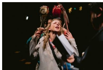
Slika 11. Kazalište predmeta i kazalište materijala

Karakteristično za ovu vrstu kazališta jest da sve može postati lutka. Važno je da se predmetu da „život“. Glumac može upotrijebiti jabuku ili telefon te mu dati svrhu i „život“, pa predmet postaje lutka koja priča priču. Ta vrsta kazališta daje beskrajne mogućnosti baš u svojoj jednostavnosti.