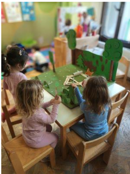
Slika 37. Igra s kolibicom

Konstrukciju kolibice raditi smo zajedno s djecom; djeca daju svoje ideje kako bi kolibica trebala izgledati. Moja je uloga, osim pomagača pri konstruiranju, bila zalijepiti konstrukciju. Djeca sudjeluju u bojanju.