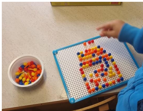
Slika 14. Slobodna igra izrade kolibice

Ovom igrom djeca otkrivaju nove načine slaganja. Ovom aktivnošću potičemo finu motoriku, koordinaciju „oko – ruka“, uzorkovanje te snalaženje i pozicioniranje na podlozi.