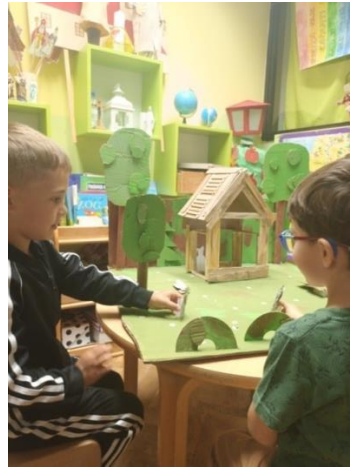
Slika 42. Dramatizacija stolnim lutkama

Igra dviju djevojčica je zabavna. Jedna drugoj pomažu oko teksta, a najzanimljivije je kada medo-trapavi ulazi u kolibicu i kolibica se sruši. Nekoliko puta ponavljaju priču samo da bi došle do toga dijela gdje se kolibica ruši.