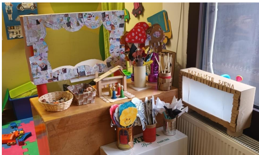
Slika 12. Dramsko-scenski kutić u sobi dnevnog boravka