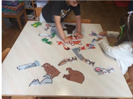
Slika 20. Spajanje dvaju dijelova životinje

Aktivnost potiče spoznajni razvoj, logičko razmišljanje te razvoj govora. Aktivnost je prvenstveno bila namijenjena mlađoj djeci jer u skupini imam djecu u 3. i 4. godini života. Dok sam s njima provodila individualni rad te ih poticala na govor, u igru su se uključili i stariji dječaci, koji su tu igru pretvorili u natjecateljsku. Natjecali su se tko će složiti više životinja. U igri razgovaraju o boji, veličini životinja, ali i uočavaju da su od svake životinje po dvije slagarice te dolaze do zaključka da su iste životinje različite.