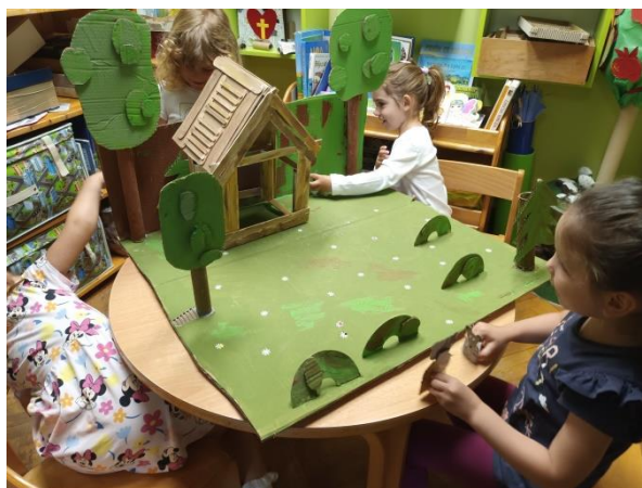
Slika 39. Slobodna igra s lutkama i scenografijom

Djeca najprije slobodno manipuliraju lutkama izmišljajući tekst. Često uzimaju lutke te se s njima igraju. Projekt smo započeli u ožujku 2024., i još uvijek djeca pokazuju interes za njega iako je polovica lipnja. Svakodnevno je nekoliko djece u dramsko-scenskom kutiću te dramatiziraju priču, a ponekad se samo igraju lutkama.