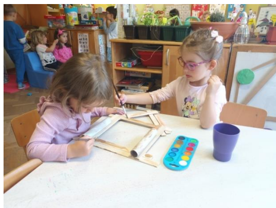
Slika 36. Bojenje konstrukcije kolibice

Brojni stručnjaci ističu važnost stvaralačke igre, u kojoj djeca vlastitom aktivnošću stječu nove spoznaje i iskustva o sebi i svojoj okolini. U tom procesu oni razvijaju svoje ideje, istražuju ih, testiraju, promišljaju i sl. Jedna od stvaralačkih igara djece jest i igra građenja i konstruiranja. Građenje i konstruiranje može privući više djece koja razmjenjuju svoje ideje, surađuju, pomažu jedna drugima te tako razvijaju i svoje socijalne vještine. Konstrukcije i drugi trodimenzionalni uradci djece, poput građevina od kocaka i drugih objekata izrađenih od ne oblikovnih materijala, predstavljaju važno sredstvo komuniciranja s djetetom u procesu njegova učenja. Dijete u tim aktivnostima razvija i unaprjeđuje sposobnost rješavanja problema. To se događa kad ono ima plan koji pokušava ostvariti i pritom nailazi na problemske situacije, koje zatim različitim metodama nastoji riješiti.