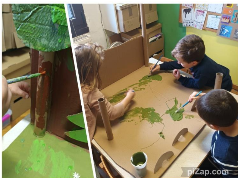
Slika 29. Proces bojanja scenografije 1