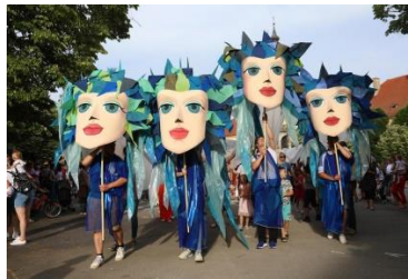
Slika 8. Velike ili gigantske lutke

Gigantske lutke specifične su jer ih najčešće vidimo u uličnim povorkama te ih nije uobičajeno vidjeti u predstavama. Karakteristično za njih jest njihovo pojavljivanje samo po sebi, njihov pokret i veličina.