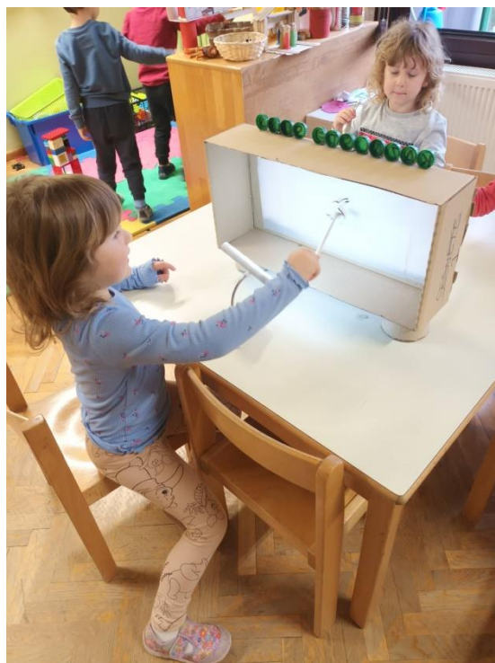
Slika 22. Dramatizacija lutkama kazališta sjena

Igra sjenama djeci je zabavna, pomalo mistična. Cilj aktivnosti jest stjecanje novih iskustava, ali na prvom mjestu poticanje govora. Djeci je kazalište sjena ponuđeno prvi put, pa je početak dramatizacije bio relativno nespretan. Dječaci u skupini uzimali su različite predmete (najčešće autiće i dinosaure) te ih stavljali između lampe i paravana i proučavali njihove sjene. Često sam se uključivala u igru i pokušala upoznati djecu s pravilnom upotrebom lutaka, ali djeca pritom gube interes za dramatizaciju. Kazalište sjena nije izazvalo velik interes kod djece. Pretpostavljam da je to zbog toga što je kazalište prvi put ponuđeno, ali i zato što je ponuđeno s ostalim vrstama lutaka koje su djeci bile atraktivnije.