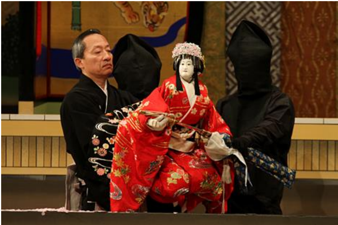
Slika 7. Bunraku-lutka

Bunraku-lutke oslikavaju japansku tradiciju i tema predstava obično oslikava prošlost Japana, odnosno doba samuraja (Županić Benić, 2009).