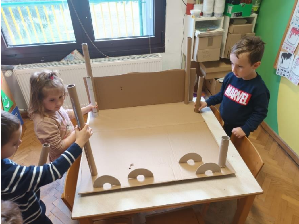
Slika 28. Dogovor oko rasporeda

Nakon što su djeca osmislila scenu započinje bojanje, što djeca također rade samostalno.