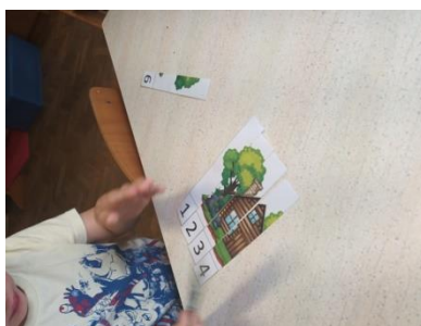
Slika 19. Slaganje brojevnih slagarica

Slagaricama potičemo razvoj logičkog razmišljanja, koje pomaže u rješavanju problemskih zadataka ili situacija koje uključuju međusobno povezivanje informacija.