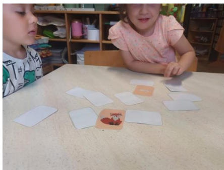
Slika 18. Igra parnim slikama

Dio djece za svoju aktivnost bira parne slike, čime potiču razvoj pamćenja te međusobnu suradnju.