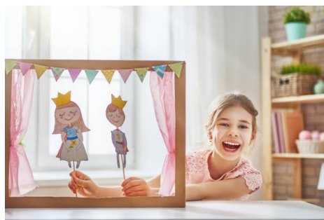
Slika 5. Igra plošnim lutkama

Autor Majaron (2004) navodi da su plošne lutke važne za poboljšanje vizualne senzibilnosti i orijentacije u prostoru – prenošenje crteža u pokret u odnosu na neku drugu animiranu formu.