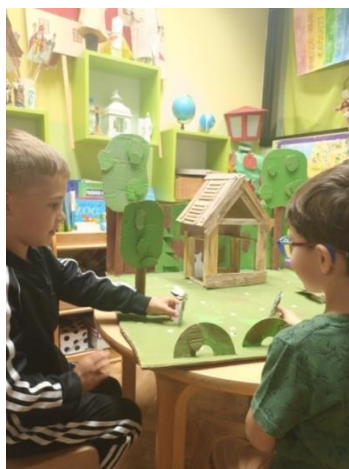
Slika 42. Dramatizacija stolnim lutkama

Igra dviju djevojčica je zabavna. Jedna drugoj pomažu oko teksta, a najzanimljivije je kada medo-trapavi ulazi u kolibicu i kolibica se sruši. Nekoliko puta ponavljaju priču samo da bi došle do toga dijela gdje se kolibica ruši.