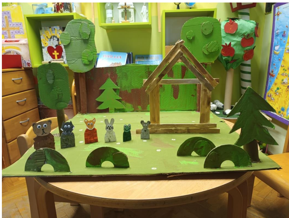
Slika 31. Završena scenografija