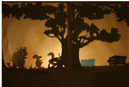
Slika 4. Kazalište sjena

Kao izvor svjetla nekada davno koristilo se svjetlo svijeća i uljnih lampi, a danas se koriste reflektori, žarulje i sl. Svjetlo daje poseban ugođaj predstavi i stvara određeni ugođaj lutkama. U novije vrijeme svjetlost se boja različitim filtrima u boji koji se stavljaju ispred samog reflektora. Prema Županić Benić (2009), lutke sjene mogu se animirati na tri načina mehaničkog pokretanja. Tako se razlikuju: sjene animirane odozdo, sa strane i odostraga.