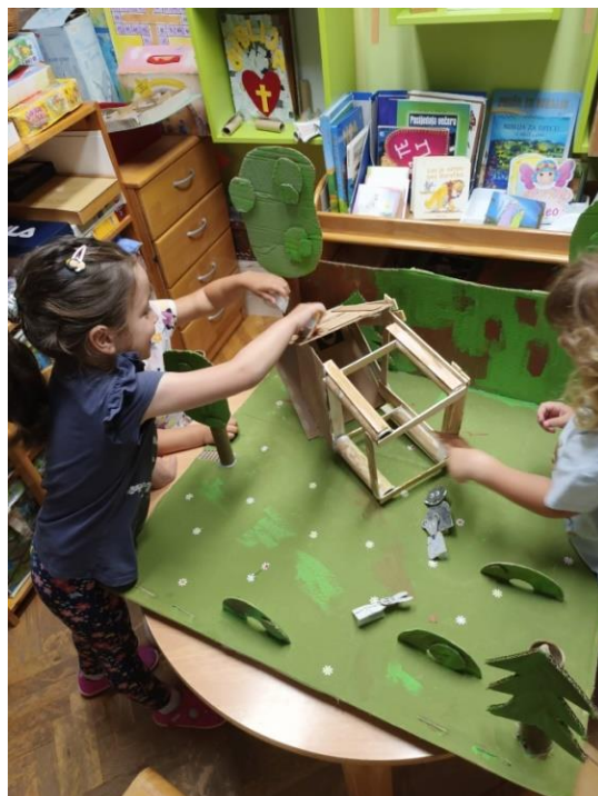
Slika 41. Dramatizacija priče „Kolibica“

Ovdje je prikazana samostalna igra dječaka koji malo kasni u govoru. On prvi ujutro dolazi u skupinu i često sjeda za stol i počinje dramatizaciju priče. Primjećujem da tijekom dana rijetko prihvaća poziv druge djece na dramatizaciju. I inače pokazuje nesigurnost kada treba nešto reći ili ispričati pred cijelom grupom.