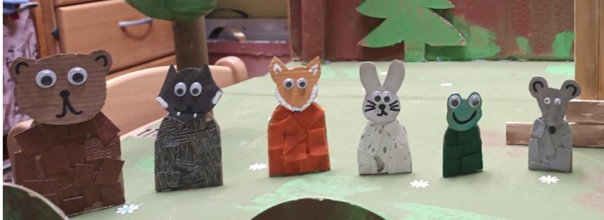
Slika 35. Završene stolne lutke

Nakon što su djeca napravila i glave i tijelo lutaka, ja sam polijepila dijelove i stavila oči te su lutke napokon bile spremne za manipuliranje. Djeca s ponosom gledaju lutke koje su napravila te se čak i roditeljima koji dolaze po njih poslijepodne hvale što su danas napravila u vrtiću.