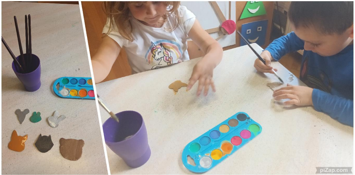
Slika 32. Proces izrade glave lutaka

Uz scenografiju, odlučila sam da djeca sudjeluju i u izradi stolnih lutaka. Djeca su uključena u cijeli proces. Od rezanja, lijepljenja do bojanja. Primjećujem da kada djeca sudjeluju u izradi, više paze na lutke te se rjeđe događa da se lutke potrgaju.