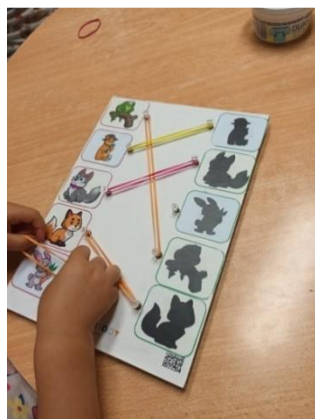
Slika 15. Igra povezivanja sjene i slike

Aktivnost kojom potičemo uočavanje sličnosti i razlike između likova i sjena te finu motoriku i koordinaciju „oko – ruka“.