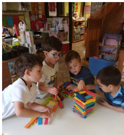
Slika 21. Igra drvenim kockama

„Mora biti velika da svi uđu.“ (R. J. M., 4,8 godina)