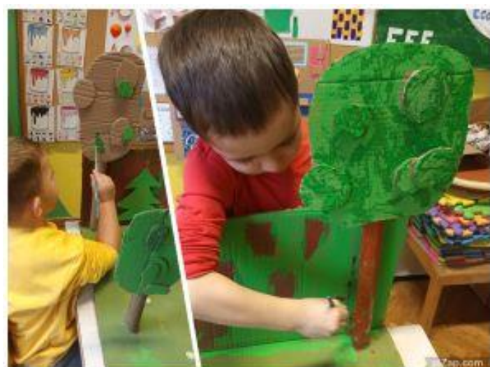
Slika 30. Proces bojanja scenografije 2