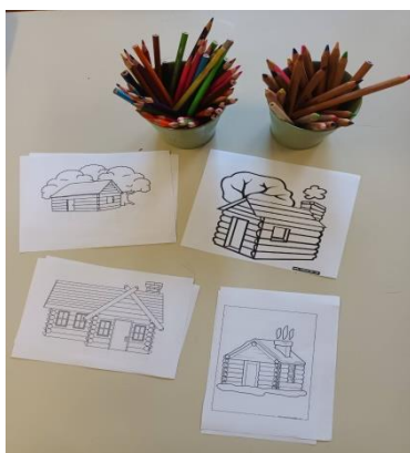
Slika 16. Likovna aktivnost bojanja zadanih oblika (izvor: Ivana Reštegorac)

Iako mnogi stručnjaci tvrde da bojanje ograničava kreativnost i slobodu djeteta, smatram da bojanje ima svojih dobiti i da utječe na cjelokupni razvoj djeteta.