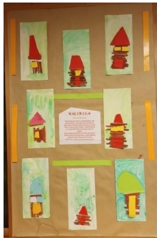
Slika 27. Gotov likovni rad „Kolibica“