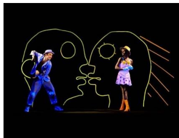
Slika 10. Crno kazalište

Prema autorici Županić Benić (2009), lutkom u crnom kazalištu može biti sve: dio tijela animatora ili bilo kakav predmet, bez obzira na to radi li se o nečemu dvodimenzionalnom ili trodimenzionalnom.