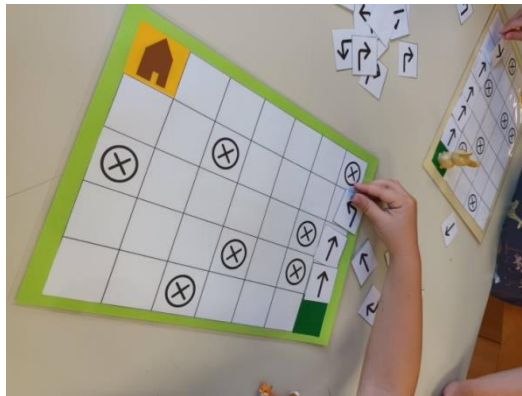
Slika 17. Igra programiranja

Djeca putem ovoga didaktičkog materijala uče osnove programiranja te razvijaju svoje logičko razmišljanje, finu motoričku sposobnost, komunikacijske vještine, prostornu orijentaciju, pažnju, pamćenje i kreativnost.