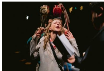
Slika 11. Kazalište predmeta i kazalište materijala

Karakteristično za ovu vrstu kazališta jest da sve može postati lutka. Važno je da se predmetu da „život“. Glumac može upotrijebiti jabuku ili telefon te mu dati svrhu i „život“, pa predmet postaje lutka koja priča priču. Ta vrsta kazališta daje beskrajne mogućnosti baš u svojoj jednostavnosti.