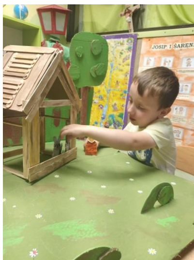
Slika 40. Samostalna dramatizacija dječaka

Ovdje je prikazana samostalna igra dječaka koji malo kasni u govoru. On prvi ujutro dolazi u skupinu i često sjeda za stol i počinje dramatizaciju priče. Primjećujem da tijekom dana rijetko prihvaća poziv druge djece na dramatizaciju. I inače pokazuje nesigurnost kada treba nešto reći ili ispričati pred cijelom grupom.