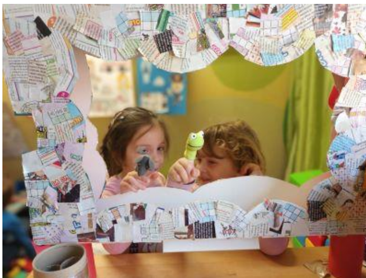
Slika 24. Dramatizacija lutkama za prst

Ta je vrsta lutke vrlo lagana za korištenje. Dijete može koristiti više lutaka odjednom. Lutke za prste odlične su za mala kazališta te ih djeca često uzimaju da bi manipulirala s njima. S ovim lutkama upoznali smo se još prošle godine, kada smo provodili eTwinning projekt „Životinjski carstvo“, ali djeci su i dalje atraktivne i zanimljive. Ta vrsta lutke izaziva kod djece najviše smijeha jer pomicanjem prsta lutka ponekad ispadne.