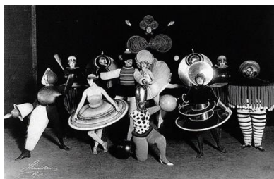
Slika 9. Bauhaus lutke

Prema Županić Benić (2009), bauhaus je avangardni umjetnički pravac koji se pojavio u svim granama umjetnosti, pa tako nije zaobišao ni lutkarstvo. Naime, unutar spomenutog pravca dolazi do promjene dotad uvriježenog stava da lutka mora oponašati živo biće. Zamjenjuje ga sada potpuno nova težnja da lutkar, animator, izgleda kao lutka. Ta ideja javlja se u bauhausu, točnije u Ballettu Oskara Schlemmera, u kojem balet plešu automati. Na plesače je pričvršćen kostim geometrijskih zakonitosti koji im ograničava kretanje i nameće jednu vrstu pokreta koji ponavlja u određenom ritmu, poput automata.