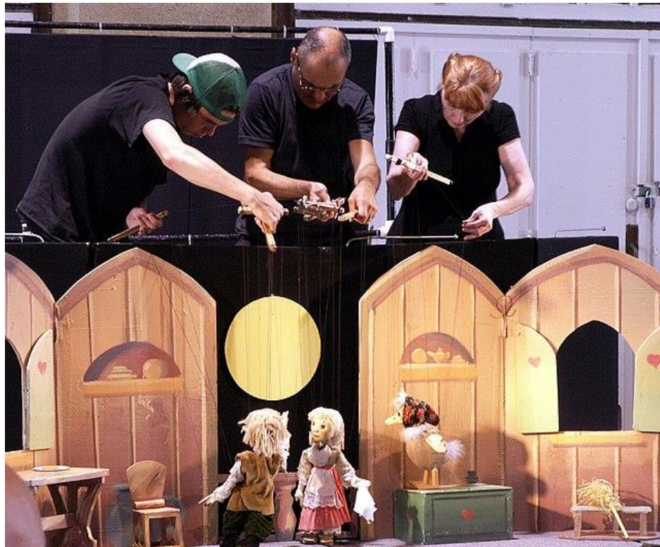
Slika 6. Predstava s marionetama

„Animirane su sa šipkom koja ide od glave, a noge i ruke su dugim vježbanjem na principu inercije postigle pokrete koji su slični hodu. S vremenom su te lutke dobivale konce za animaciju ruku i nogu. Stvoren je tzv. kontrolnik, drveni nosač za koji su privezani konci. U profesionalnom kazalištu marioneta može imati i trideset konaca.“ (Pokrivka, 1991: 11)