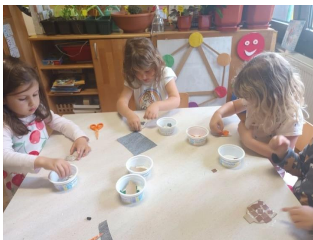
Slika 34. Likovna aktivnost lijepljenja materijala

Kao što sam već naglasila, najveća je vrijednost dječjeg stvaralaštva kada dijete samo izradi svoju lutku. „Poželjno je da dijete samo stvara lutku. Tada je ta lutka samo njegova, zamišljena u njegovoj mašti, napravljena njegovim rukama, oživljena njegovom energijom i osjećajima. Prigodom takvoga stvaranja i oživljavanja dijete nadilazi sve svoje stvaralačke aktivnosti“. (Majaron, 2002, prema Hicela, 2010: 55)