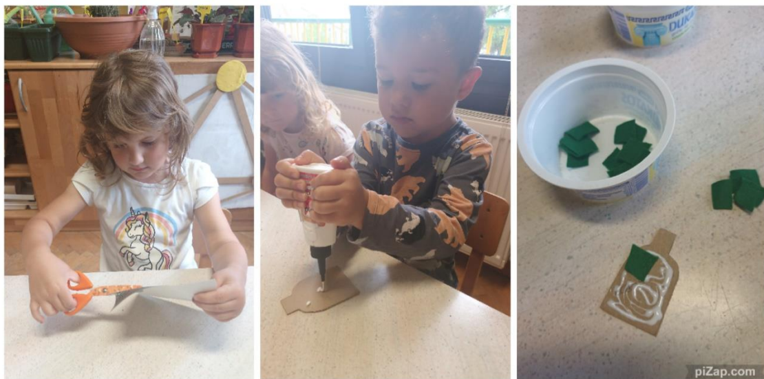
Slika 33. Proces izrade tijela lutaka