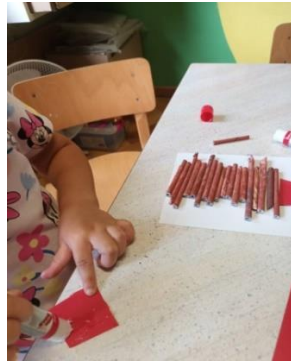
Slika 26. Likovna aktivnost lijepljenja