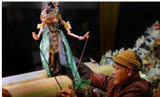
Slika 3. Javajka

Pokrivka (1978) navodi kako lutka javajka predstavlja jednu od najljepših i najneobičnijih manifestacija azijske kulture. Kod nas je zadržala samo tehniku animiranja. Originalna lutka „vajang“ izrađena je od drva te joj dugačak štap prolazi kroz tijelo i pokreće glavu lutke. Ruke imaju zglobove u ramenu, laktu, šakama i pokreću se pomoću dvaju štapova pričvršćenih za šake.