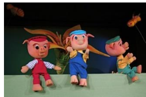
Slika 1. Lutkarska predstava s ginjol lutkama

Glava ginjol lutke može se napraviti od različitih materijala, poput drva, papira, tkanine i sl. Djeca jako vole ginjol lutke jer kada je žele oživjeti animacijom, mogu je kontrolirati i nesputano se uživjeti u predstavu s njom.