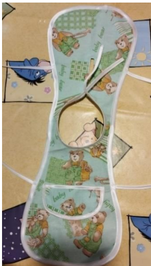
Slika 44. Završni izgled kute

Kutu sam obrubila bijelom vrpcom zašivši ju pomoću šivaće mašine. Od tkanine sam izrezala oblik džepića te sam ga također obrubila bijelom vrpcom i zašila za kutu lutke na odabrano mjesto. Bijele sam vrpce ostavila duže na vratu i na bokovima kako bi se mogle zavezati u mašne, a kuta lakše oblačiti (slika 44.).