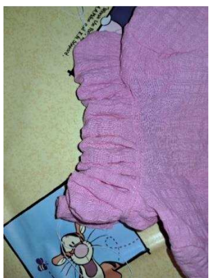
Slika 38. Ovratnik

Kako bih sakrila grlo boce, odnosno lutkin vrat, odlučila sam na tom mjestu sašiti ovratnik vidljiv na slici 38. Za njega sam iskoristila trakicu tkanine širine duplo veće od širine ovratnika haljine