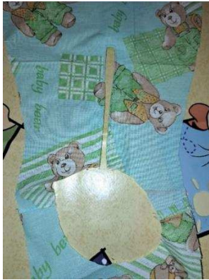
Slika 43. Oblik kute od tkanine

Kad sam se uvjerala da sam zadovoljna veličinom kute od papira, isti sam oblik izrezala od tkanine koju sam namijenila za izradu kute (slika 43.).