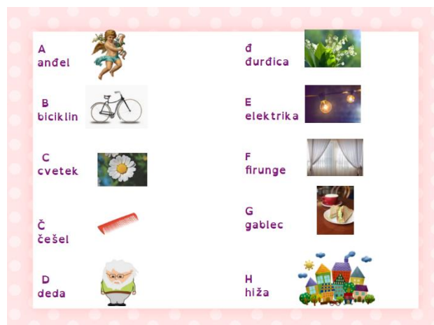
Slika 3. Abeceda na kajkavskom narječju

Igranje igara s riječima: odgojitelji mogu osmisliti različite igre s riječima koje potiču uporabu kajkavskog jezika. To može uključivati igre asocijacije, rješavanje zagonetki, rimovanje riječi ili stvaranje abecede i priča na kajkavskom jeziku.