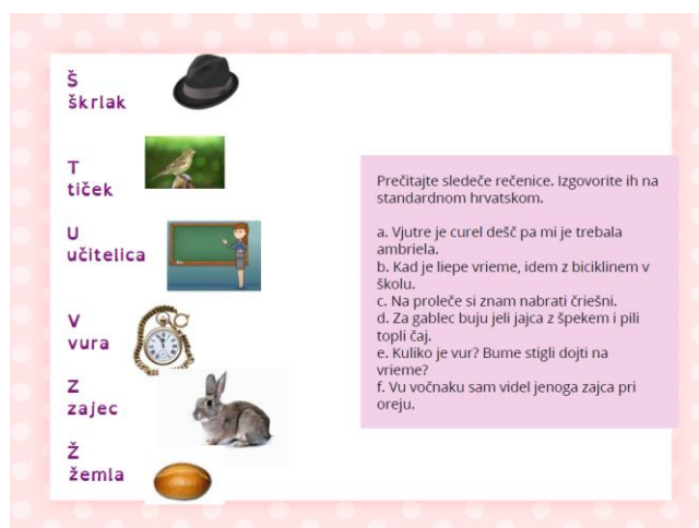
Slika 5. Abeceda na kajkavskom narječju

Pripovijedanje kajkavskih priča: kroz pripovijedanje kajkavskih priča, odgojitelji mogu prenijeti bogatu kajkavsku tradiciju i kulturnu baštinu na djecu. Primjerice, legende, mitovi i narodne priče mogu se ispričati na kajkavskom jeziku kako bi djeca uživala u pričama i istovremeno učila o kajkavskoj kulturi.