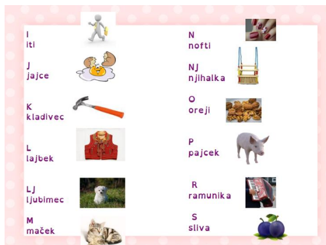
Slika 4. Abeceda na kajkavskom narječju