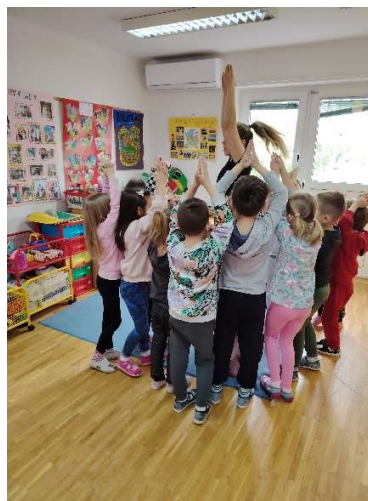
Slika 2. Druga skupina