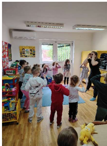
Slika 4. Druga skupina