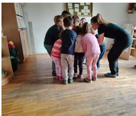
Slika 3. Prva skupina