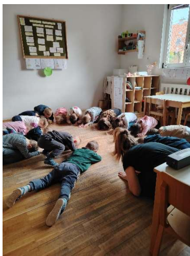
Slika 1. Prva skupina