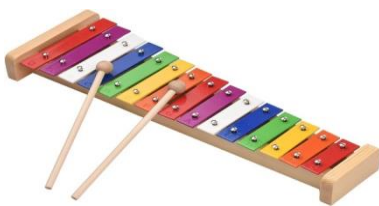
Slika 2. Ksilofon