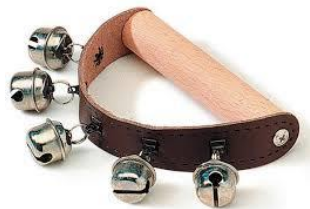
Slika 13: Praporci