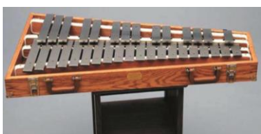
Slika 3. Zvončići