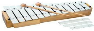
Slika 4: Metalofon