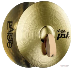
Slika 11: Činele