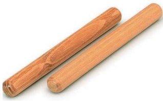
Slika 6. Štapići