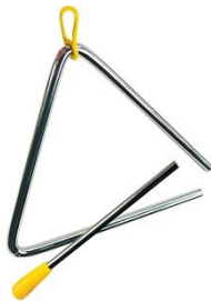
Slika 7. Triangl