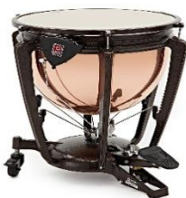
Slika 8: Timpani