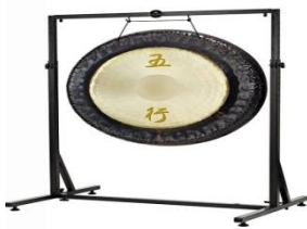
Slika 12: Gong