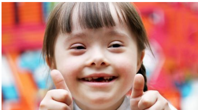
Slika 1. Specifičan izgled djeteta s Down sindromom

( https://www.dosomething.org/sites/default/files/styles/550x300/public/images/Smiling%20Girl.jpg?itok=aygyo6xj )