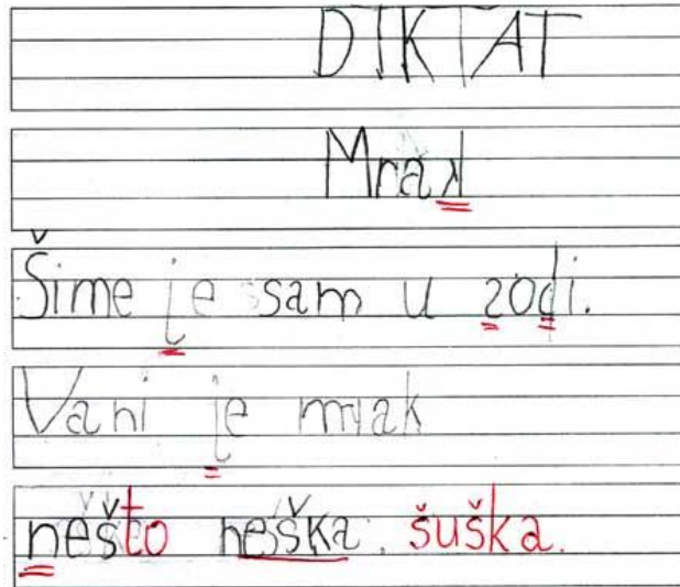
Slika 2. Djevojčica, 1.razred, diktat, teškoće s vizualnom percepcijom, disgrafija i disleksija

smetnju su: nezgrapnan i nečitak rukopis, izostavljanje i zamjena slova u riječi, zrcalno pismo na neka slova i brojke te pisanje riječi zajedno (Vizek-Vidović i sur., 2003).