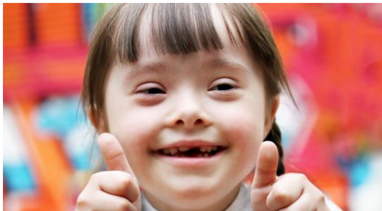
Slika 1. Specifičan izgled djeteta s Down sindromom

( https://www.dosomething.org/sites/default/files/styles/550x300/public/images/Smiling%20Girl.jpg?itok=aygyo6xj )