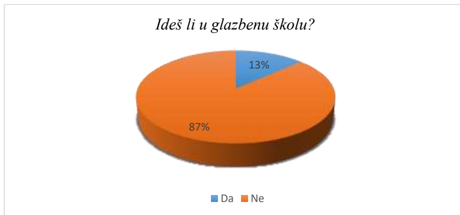
Slika 9. Pohađanje glazbene škole

Iz grafa (Slika 9.) se iščitava podatak da svega 13% učenika pohađa glazbenu školu. To je ukupno 10 od 75 ispitanih učenika. Od tih 10 učenika, njih troje u glazbenoj školi svira klavir, po dvoje gitaru i violončelo, a po jedno violinu, saksofon i harmoniku. Na pitanje zašto idu u glazbenu školu njih petoro odgovorilo je da voli svirati taj instrument, četvoro voli pjevati, a dvoje je reklo kako želi naučiti svirati određeni instrument.