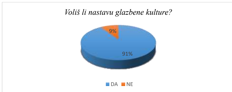
Slika 1. Ljubav prema nastavi glazbene kulture

Prema rezultatima dobivenima u anketama, iz prikaza (Slika 1.) se može vidjeti da 91% ispitanika voli nastavu glazbene kulture, dok svega 9% ispitanika nastavu glazbe ne voli. Ljubav prema glazbi opada tek u četvrtome razredu u kojemu je čak 29% ispitanika odgovorilo kako nastavu glazbene kulture ne voli. Razlog tome može biti zahtjevniji nastavni sadržaj koji se u tom razredu obrađuje ili promjena učitelja, budući da u četvrtome razredu nastavu glazbene kulture predaje nastavnik. Za razliku od četvrtog razreda, ispitanici u prva tri razreda drže konstantu u odgovorima te 96% ispitanika odgovara potvrdno na pitanje o ljubavi prema nastavi glazbene kulture. Ispitanici uglavnom gaje pozitivne osjećaje prema nastavi glazbene kulture. 78. 67% ispitanika izjavilo je kako se na nastavi glazbene kulture osjeća veselo. Razlozi zbog kojih ispitanici razvijaju uglavnom pozitivne osjećaje prema nastavi glazbe su razni, a najčešći su navedeni u grafu (Slika 2).