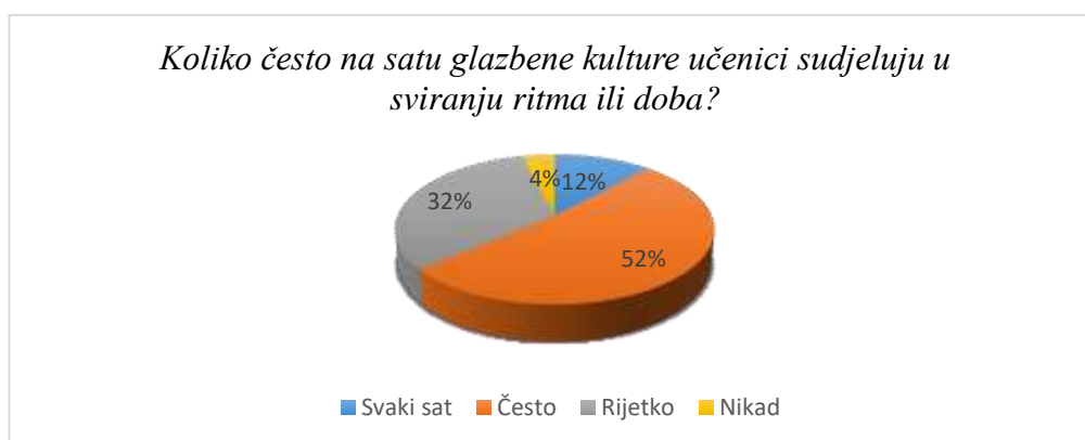
Slika 6. Učestalost učeničke aktivnosti u nastavnom području sviranja

12% učenika svira na svakom satu glazbene kulture (u vidu sviranja ritma i doba); često to radi 52% ispitanika, 32% njih reklo je da na satu svira rijetko, a 4% nikad. Prema rezultatima anketa, ova se aktivnost najrjeđe provodi u prvom razredu; čak 64. 71% ispitanika odgovorilo je kako rijetko svira na satu glazbene kulture, a za prvim razredom slijedi četvrti razred u kojem 58. 83% ispitanika odgovara isto.