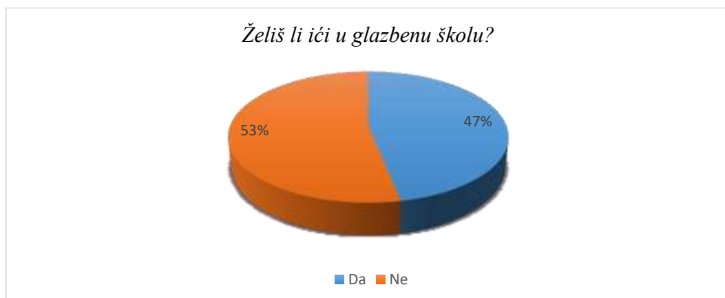
Slika 10. Želja za pohađanjem glazbene škole

U željama za pohađanjem glazbene škole postotci su gotovo izjednačeni. 47% ispitanika koji ne pohađaju glazbenu školu izrazilo je želju za pohađanjem, a 53% to ne bi htjelo.