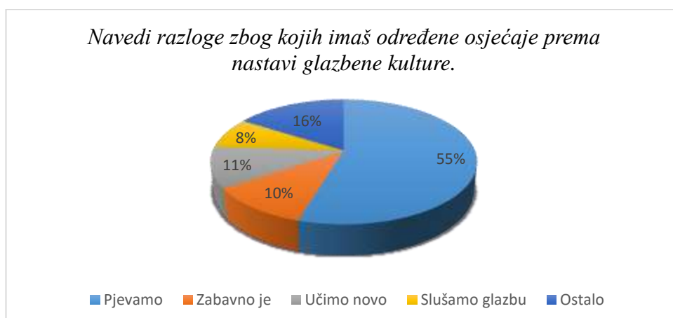
Slika 2. Razlozi pozitivnog stava prema nastavi glazbene kulture

Prema rezultatima dobivenima u anketama, iz prikaza (Slika 1.) se može vidjeti da 91% ispitanika voli nastavu glazbene kulture, dok svega 9% ispitanika nastavu glazbe ne voli. Ljubav prema glazbi opada tek u četvrtome razredu u kojemu je čak 29% ispitanika odgovorilo kako nastavu glazbene kulture ne voli. Razlog tome može biti zahtjevniji nastavni sadržaj koji se u tom razredu obrađuje ili promjena učitelja, budući da u četvrtome razredu nastavu glazbene kulture predaje nastavnik. Za razliku od četvrtog razreda, ispitanici u prva tri razreda drže konstantu u odgovorima te 96% ispitanika odgovara potvrdno na pitanje o ljubavi prema nastavi glazbene kulture. Ispitanici uglavnom gaje pozitivne osjećaje prema nastavi glazbene kulture. 78. 67% ispitanika izjavilo je kako se na nastavi glazbene kulture osjeća veselo. Razlozi zbog kojih ispitanici razvijaju uglavnom pozitivne osjećaje prema nastavi glazbe su razni, a najčešći su navedeni u grafu (Slika 2).