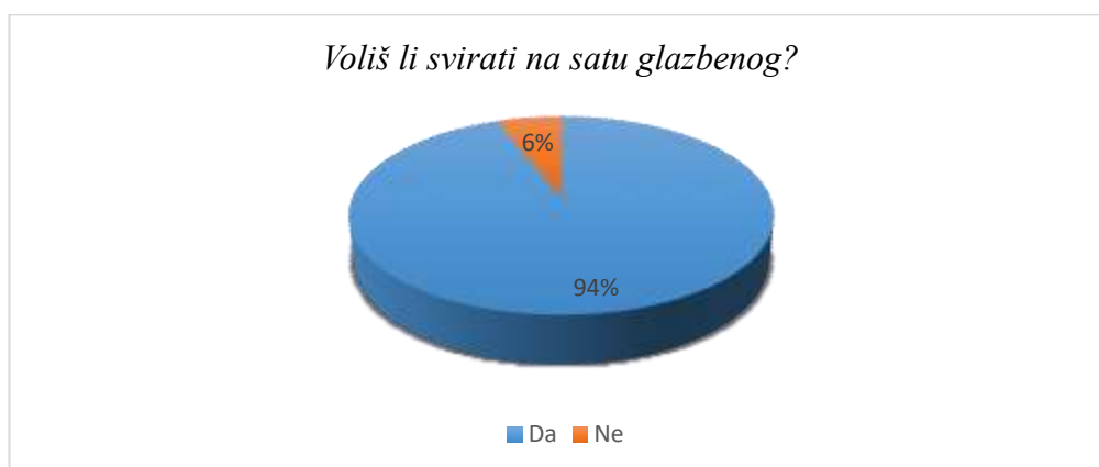
Slika 7. Osjećaji učenika prema sviranju na satu glazbene kulture

12% učenika svira na svakom satu glazbene kulture (u vidu sviranja ritma i doba); često to radi 52% ispitanika, 32% njih reklo je da na satu svira rijetko, a 4% nikad. Prema rezultatima anketa, ova se aktivnost najrjeđe provodi u prvom razredu; čak 64. 71% ispitanika odgovorilo je kako rijetko svira na satu glazbene kulture, a za prvim razredom slijedi četvrti razred u kojem 58. 83% ispitanika odgovara isto.