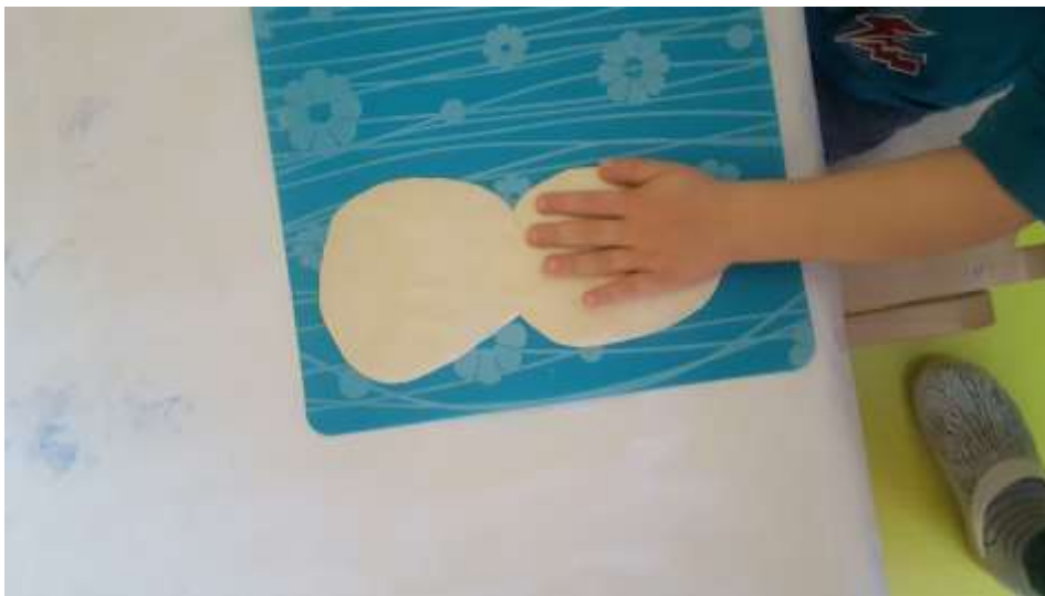
Slika 12. Pokušaj otiskivanja dlana u tijesto

Djeca pokazuju oduševljenje pri ponovnom spuštanju ruke u svoj otisak, ali isto tako pokazuju iznenađenje kada su opipali tijesto koje više nije mekano već tvrdo.