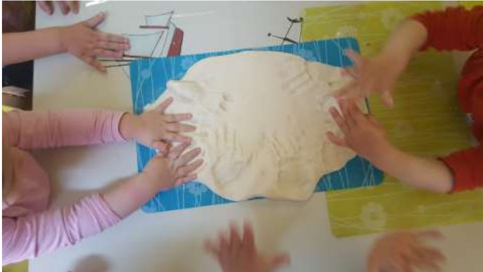
Slika 16. Zajednička aktivnost otiskivanja dlana