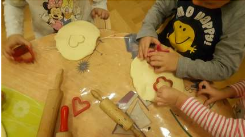
Slika 22. Prikaz rezanja oblika uz pomoć modlica