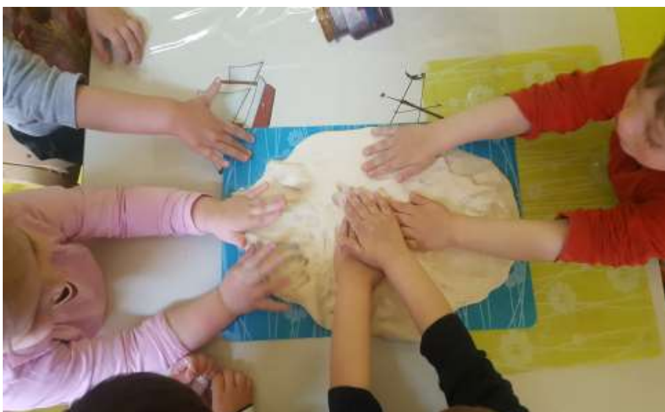
Slika 17. i 18. Pridruživanje djece u aktivnost