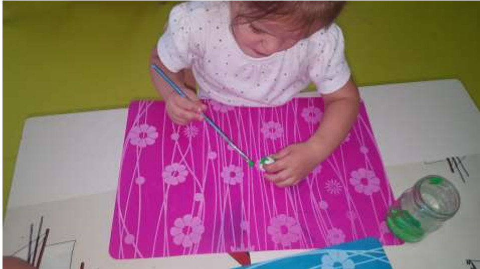
Slika 29. Djevojčica ne odustaje od aktivnosti, usmjerava pažnju na bojanje