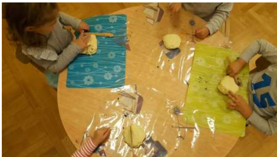
Slika 5. Djevojčica N.Z. promatra što radi djevojčica N.D.

Na samom početku aktivnosti djeca promatraju dječaka M.B. što radi. Osluškiju zvuk koji se čuje. Neki malo hrabriji odlučuju da žele i oni raditi isto to što i taj dječak. Primijetila sam da je mlađoj djeci potrebna pomoć pri udaranju. Vrlo brzo nakon prezentiranja pokušavaju samostalno to učiniti. U samom procesu fasciniralo ih je zvuk i udarac od tijesto. Ponaaljali su nekoliko puta za redom. Aktivnost je dosta dugo trajala te su se djeca izmjenjivala. Odgojitelj je bio u ulozi promatrača te je pustio da tijekom aktivnosti određuju djeca.