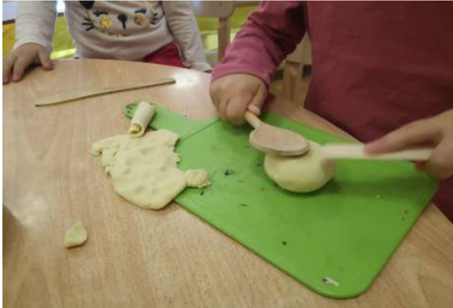
Slika 6. Djevojčica odlučuje udarati tijesto