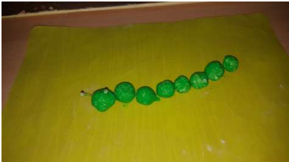
Slika 30. Prikaz gusjenice