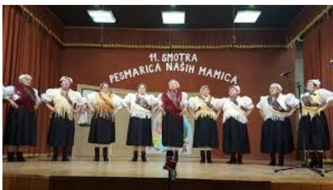
Slika 7. KUD katruže