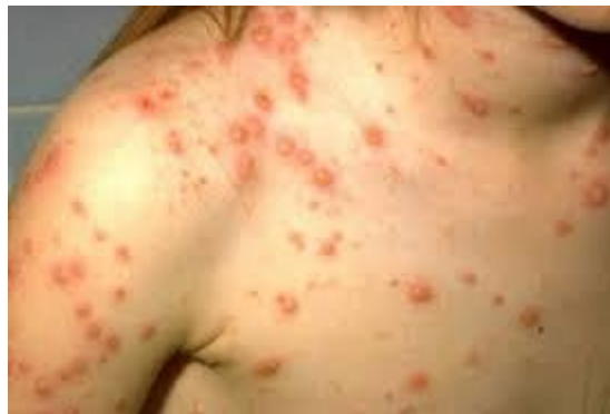
Slika 5: Izbijene vodene kozice po tijelu