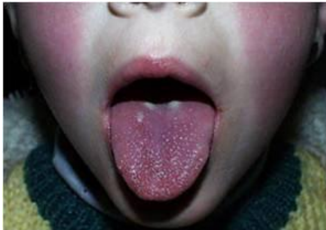
Slika 9: Dijete zaraženo šarlalom