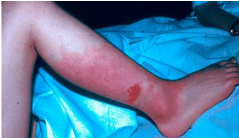
Slika 1: Erizipel - crvenilo i bolest kože na nozi