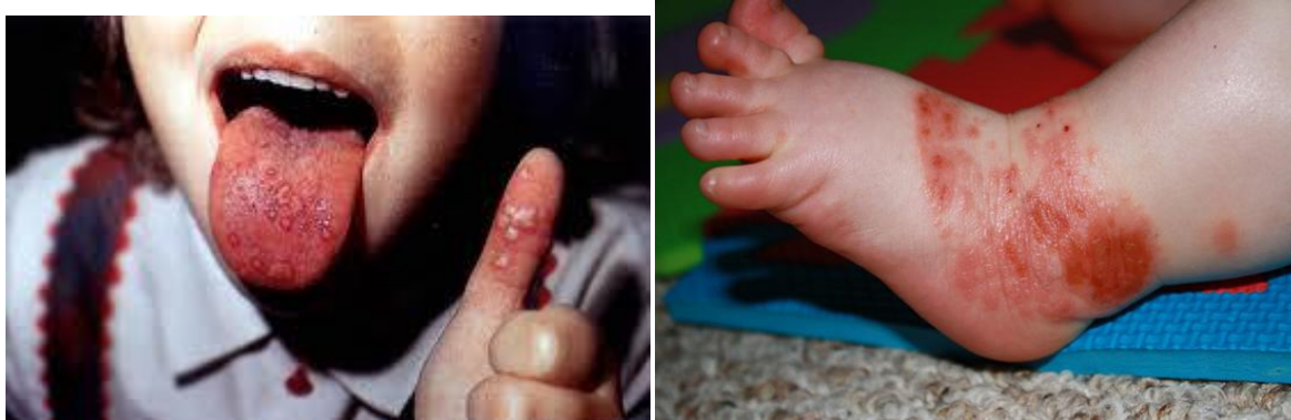
Slike 4: Bolest šaka, usta i stopala