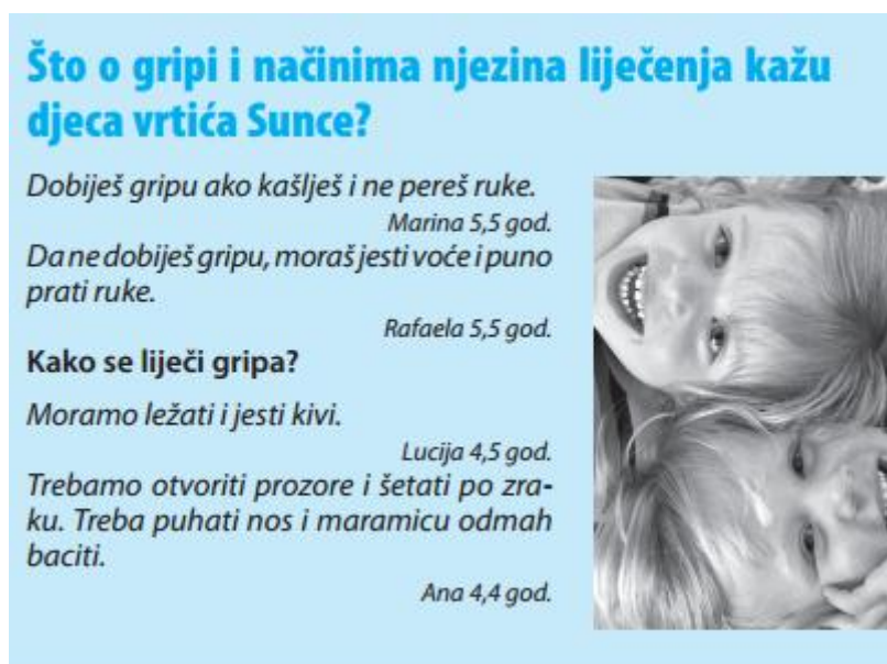
Slika 7: „Dječja usta“ o gripi i kako se gripa liječi