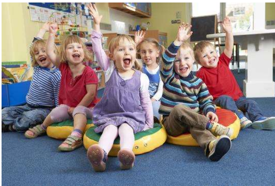
Slika br. 1: Kompetentna djeca u vrtiću.

Od dobre i kvalitetne suradnje najveću korist ima dijete. Ono stječe emocionalnu vezu s roditeljima, a onda i s odgajateljima, što je dobar temelj daljnjoj socijalizaciji. Ujedno stječe nova socijalna iskustva, osjećaj sigurnosti, osobne važnosti i povjerenja u druge, te slobodnije raste i razvija se.