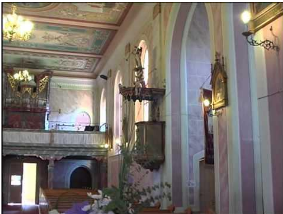
Slika br.8. Crkva Uzvišenja Sv.Križa