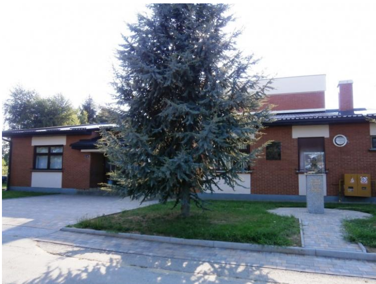
Slika br.5. Škola dr. Vinka Žganca

otežanih uvjeta rada i smanjenog broja učenika, škola je 1977. godine pripojena OŠ Mursko Središće te je postala njezinom područnom školom. Te je godine zabilježena velika pobuna mještana Vratišince koji su prosvjedovali protiv ukidanja samostalnosti škole. Autonomija je vraćena prema želji mještana, nakon punih osamnaest godina djelovanja PŠ Vratišinec u sastavu OŠ Mursko Središće. 1979. godine otvorena je nova školska zgrada, a godine 1995. školi je vraćena samostalnost. Od te godine Škola nosi naziv po velikom etnomuzikologu, sakupljaču narodnog blaga iz Međimurja i šire, mještaninu Vratišince, dr. Vinku Žgancu. Stoga se danas s pravom može reći da škola blista kao samostalna odgojno - obrazovna ustanova u svojoj sredini.