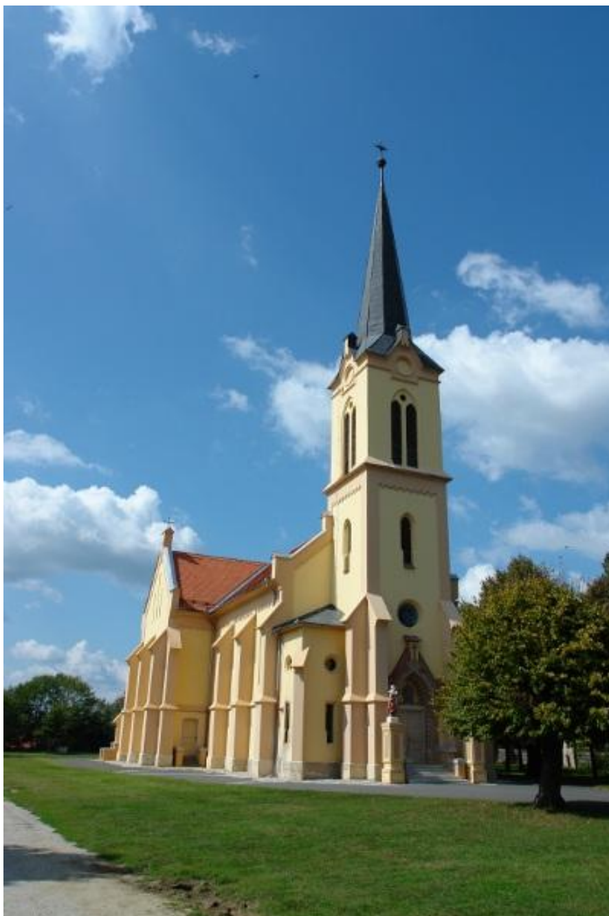
Slika br.7. Crkva Uzvišenja Svetog Križa

Sv. Valentinu koji se u župi časti od pamtivijeka i Snježnoj Mariji. Na oltaru Marije Snježne nalazi se slika Bogorodice s Djetetom koja se kvalitetom ističe među slikama međimurskih crkava. S vanjske strane uzidane su nadgrobne ploče. Među njima se ističe ploča Lovre Hranjeca, vratišinečkog župnika, koji je umro 1815.