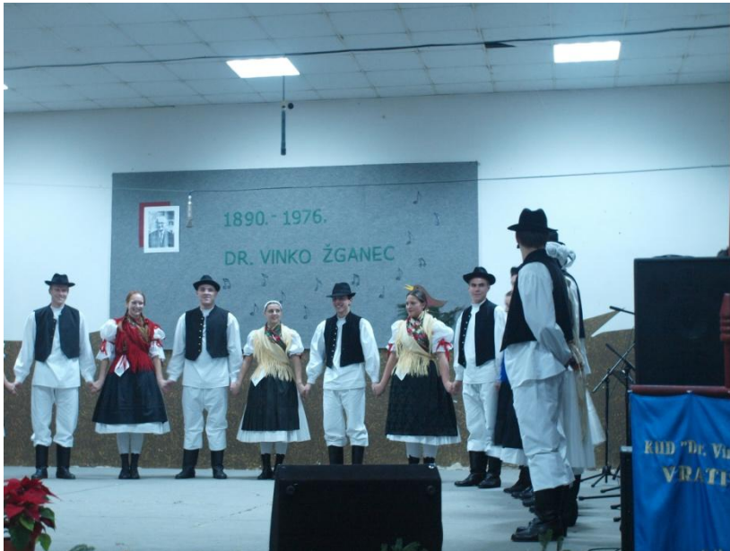
Slika br.6. KUD dr. Vinka Žganca

KUD od samog osnutka do danas s ponosom nosi ime neumornog sakupljača pučkih popijevki, etnomuzikologa svjetskog glasa, našeg sumještana, rođenog Vratišinčara, akademika, doktora Vinka Žganca.