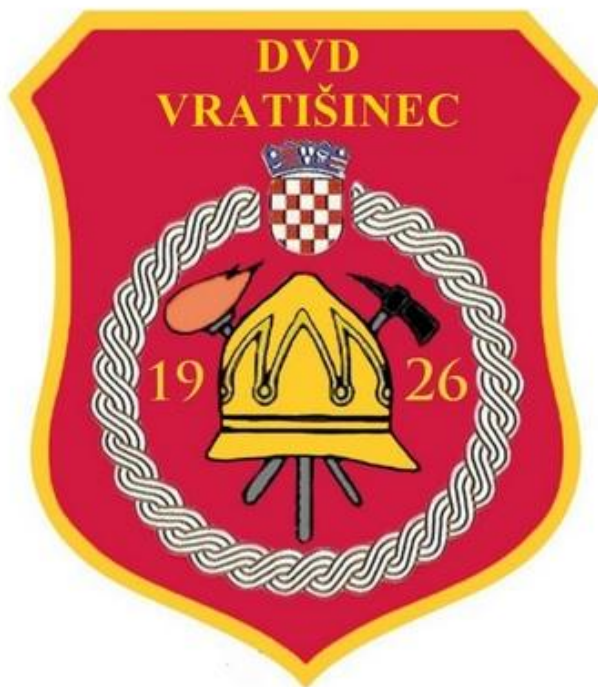
Slika br.10. DVD Vratišinec

Društvo se tijekom godine odaziva na razna natjecanja u svim kategorijama na kojima osvaja zavidne rezultate. Neki od značajnijih rezultata Društva na natjecanjima ostvarenim u posljednjih 5 godina: