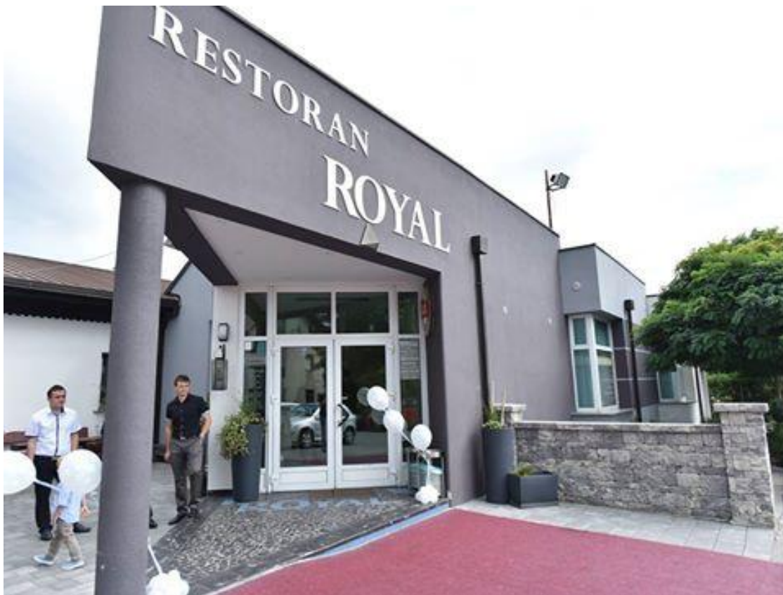
Slika br.3. "Royal" Vratišinec