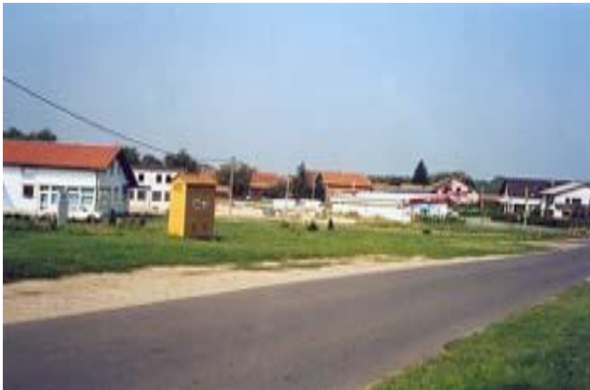
Slika br.2. Ciglenice

Poduzetnička zona CIGLENICE je površine 93350 m 2 . Zemljište je u vlasništvu Republike Hrvatske, ali je Programom raspolaganja poljoprivrednim zemljištem u vlasništvu RH, u Općini Vratišinec predviđeno za poduzetničku zonu.