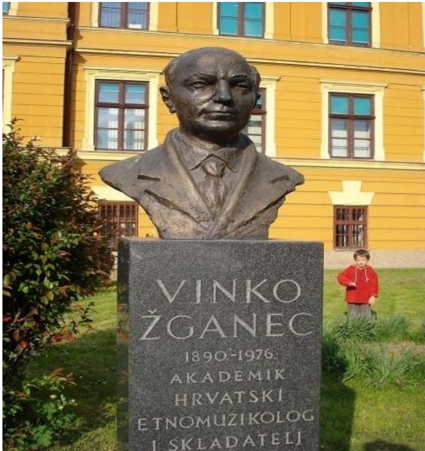
Slika br.4. Vinko Žganec