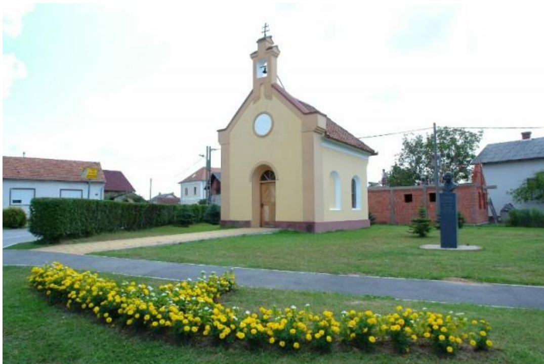
Slika br.9. Bista dr. Vinka Žganca