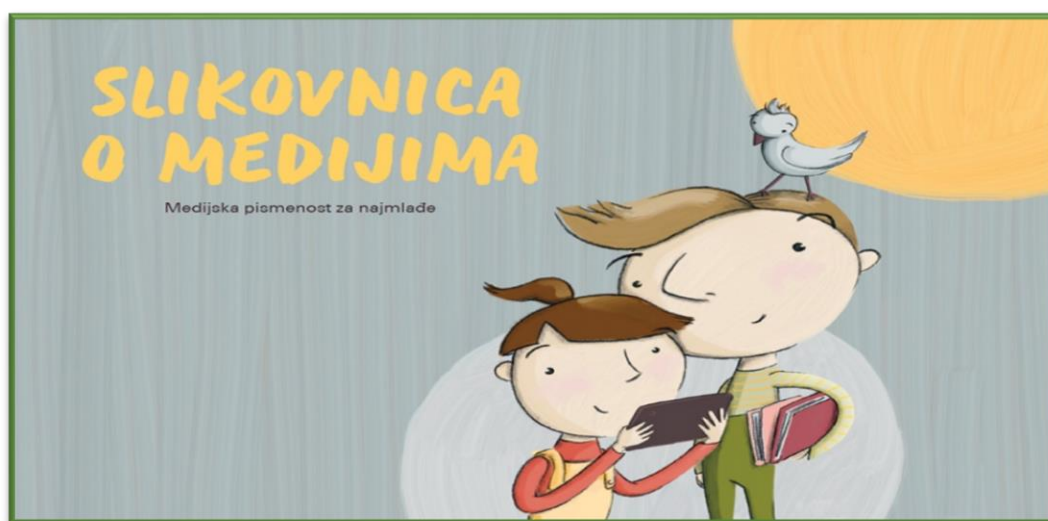
Slika 2. Naslovna stranica Slikovnice o medijima

Slikovnica je izdana povodom svjetskog dana medijske pismenosti, a namijenjena je djeci, roditeljima, skrbnicima i odgojiteljima. Slikovnica pomaže djeci da prepoznaju razliku između svijeta medija i stvarnog svijeta, a može poslužiti kao odličan uvod u brojne druge aktivnosti i razgovore o medijima i medijskim sadržajima.