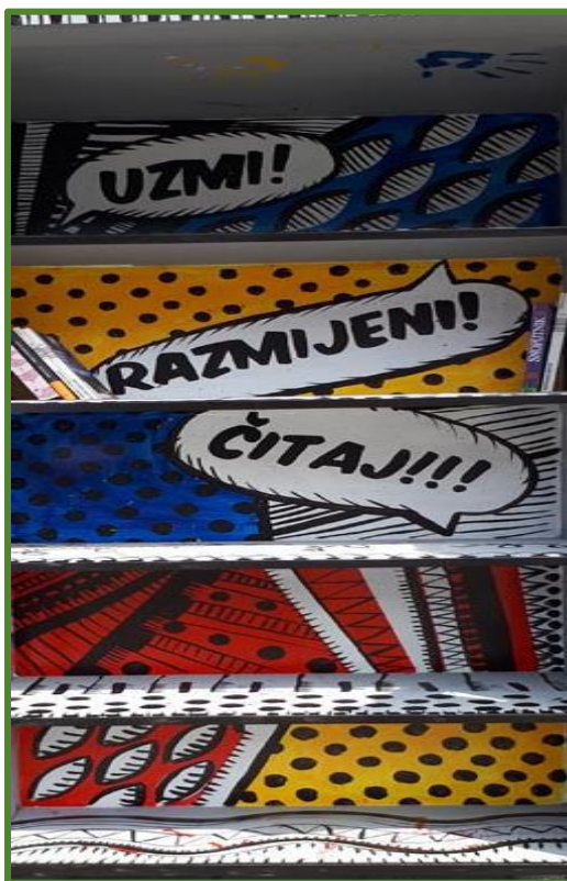
Slika 3. Javni regal za dijeljenje i razmjenu knjiga

Regal za dijeljenje i razmjenu literature, u centru Svetog Ivana Zelina, mjesto je razmjene knjiga i drugih publikacija. Građani se smiju služiti njime i njegovim sadržajem, puniti ga izdanjima čijeg se vlasništva dobrovoljno odriču, posuđivati odnosno uzimati knjige i publikacije, koje mogu ali ne moraju vratiti. Projekt je osmislilo i realiziralo Pučko otvoreno učilište Sv. Ivan Zelina, na dobrobit svih mještana odnosno članova lokalne zajednice. Na zelinski je trg regal instaliran u lipnju 2018., za vrijeme 1. Međunarodnoga književnog festivala sa sajmom knjige.