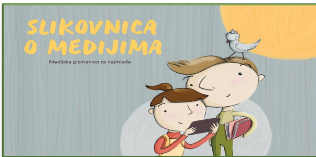
Slika 2. Naslovna stranica Slikovnice o medijima

Slikovnica je izdana povodom svjetskog dana medijske pismenosti, a namijenjena je djeci, roditeljima, skrbnicima i odgojiteljima. Slikovnica pomaže djeci da prepoznaju razliku između svijeta medija i stvarnog svijeta, a može poslužiti kao odličan uvod u brojne druge aktivnosti i razgovore o medijima i medijskim sadržajima.