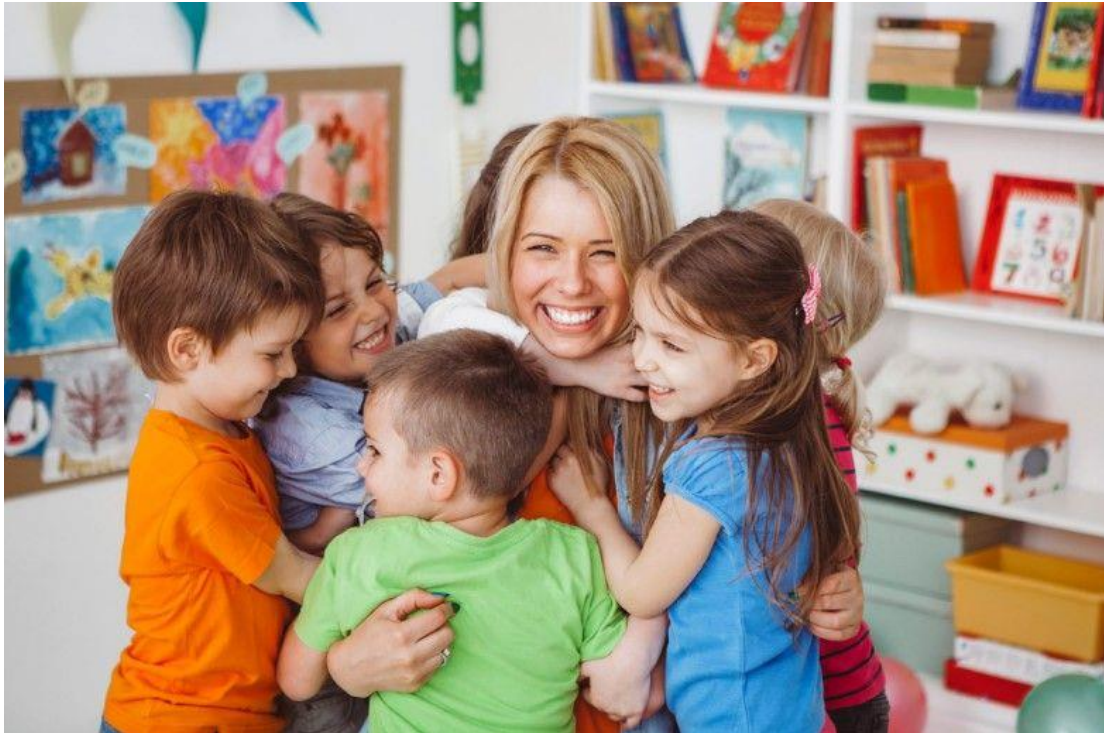
Slika 2. Tjelesni kontakt