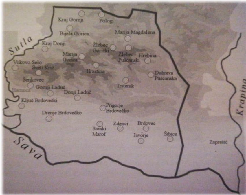
Slika 1: Zemljovid rasprostranjenosti kajkavske ikavice, autor Branimir Brgles

Kajkavska donjosutlanska ikavica prostire se na području četiri općine zapadnog dijela Zagrebačke županije: općine Brdovec i naselja Vukovo Selo, Ključ Brdovečki, Šenkovec, Drenje Brdovečko, Laduč, Prudnice, Prigorje Brdovečko; općina Marija Gorica i naselja Sveti Križ, Kraj Donji, Bijela Gorica, Kraj Gornji, Hrstina, Marija Gorica, Oplaznik, Celine Goričke, Žlebec Gorički, Trstenik; općina Pušća s naseljima Marija Magdalena, Žlebec Pušćanski, Hrebine te općina Dubrava s rubnim naseljima Kraj Gornji, Pologi i Bobovec Rozganski. Iz općine Brdovec izuzeto je naselje Harmica, u kojem starosjedioci govore kajkavskim ekavskim govorom. Također valja napomenuti da se u već spomenutim naseljima Brdovec, Javorje, Zdenci Brdovečki, Prudnice i Bobovec Rozganski osim ikavskoga govora nailazi i na kajkavski ekavski refleks jata i poluglasa ( stolëc ).