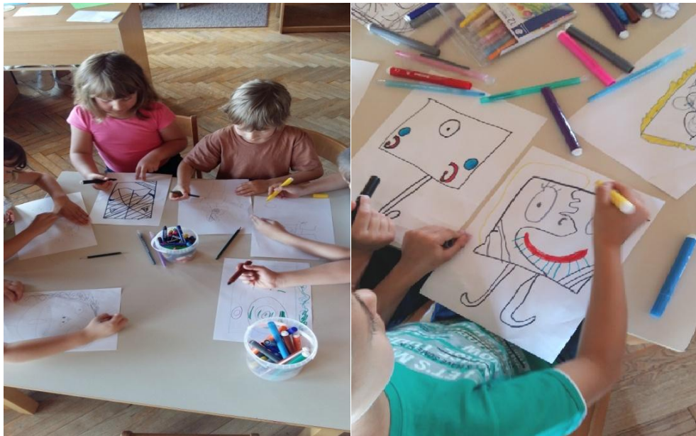
Slika 2. Tijek procesa, pastele i flomasteri

Nakon uvodnog dijela aktivnosti i razgovora o umjetniku i prikazanim slikama, djeca su pristupila individualnom radu. Pastele i flomasteri su ponuđene likovne tehnike koje su djeca imala na izbor te su krenula u realizaciju likovne aktivnosti. Na ploči su ostavljeni poticaji spomenutih djela Pabla Picassa.