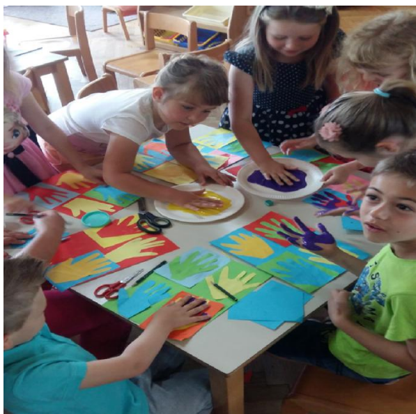
Slika 25. Tijek procesa, otiskivanje