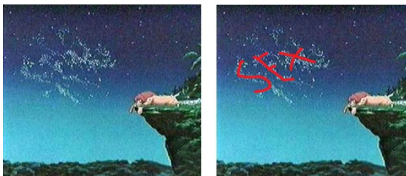
Slika 7 . Prikaz primjera iz animiranog filma 'Kralj lavova'