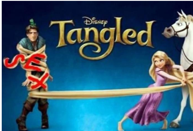
Slika 6 . Prikaz primjera iz animiranog filma ' Tangled'