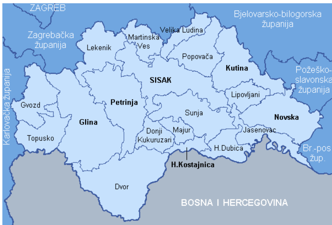
Slika 1. Prikaz ustroja Sisačko-moslavačke županije i susjednih županija

Sisačko-moslavačka županija je jedinica regionalne samouprave u Republici Hrvatskoj. Sisačko-moslavačka županija površinom od 4.463 km 2 treća je županija po veličini u Republici Hrvatskoj te čini gotovo 8% njenog kopnenog teritorija. Današnjim ustrojem Sisačko-moslavačku županiju čini 7 gradova (Sisak, Kutina, Novska, Petrinja, Glina, Hrvatska Kostajnica, Popovača) i 12 općina (Donji Kukuruzari, Dvor, Gvozd, Hrvatska Dubica, Jasenovac, Lekenik, Lipovljani, Martinska Ves, Sunja, Topusko, Majur i Velika Ludina) sa središtem u gradu Sisku. Županija na zapadu graniči s Karlovačkom županijom, sjeveru sa Zagrebačkom županijom, sjeveru i sjeveroistoku s Bjelovarsko-bilogorskom županijom, istoku s Požeško-slavonskom županijom, jugoistoku s Brodsko-posavskom županijom te na svom jugu županija graniči sa susjednom državom Bosnom i Hercegovinom. 1