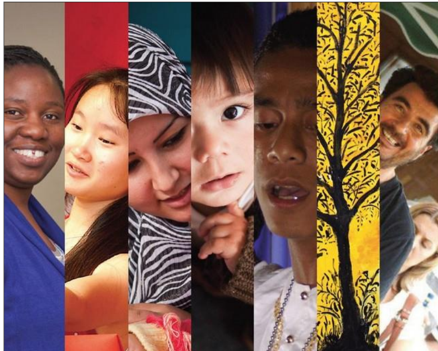
Slika 4: Komunikacija različitih kultura (

Većina ljudi smatra da je za „uspješnu komunikaciju u stranoj kulturi dovoljno naučiti strani jezik (...), ali stručnjaci za pitanja kulture odbacuju takva mišljenja (...), jer je jezik samo sredstvo izražavanja misli i čuvstava“ (Reardon, 1998, str. 175).