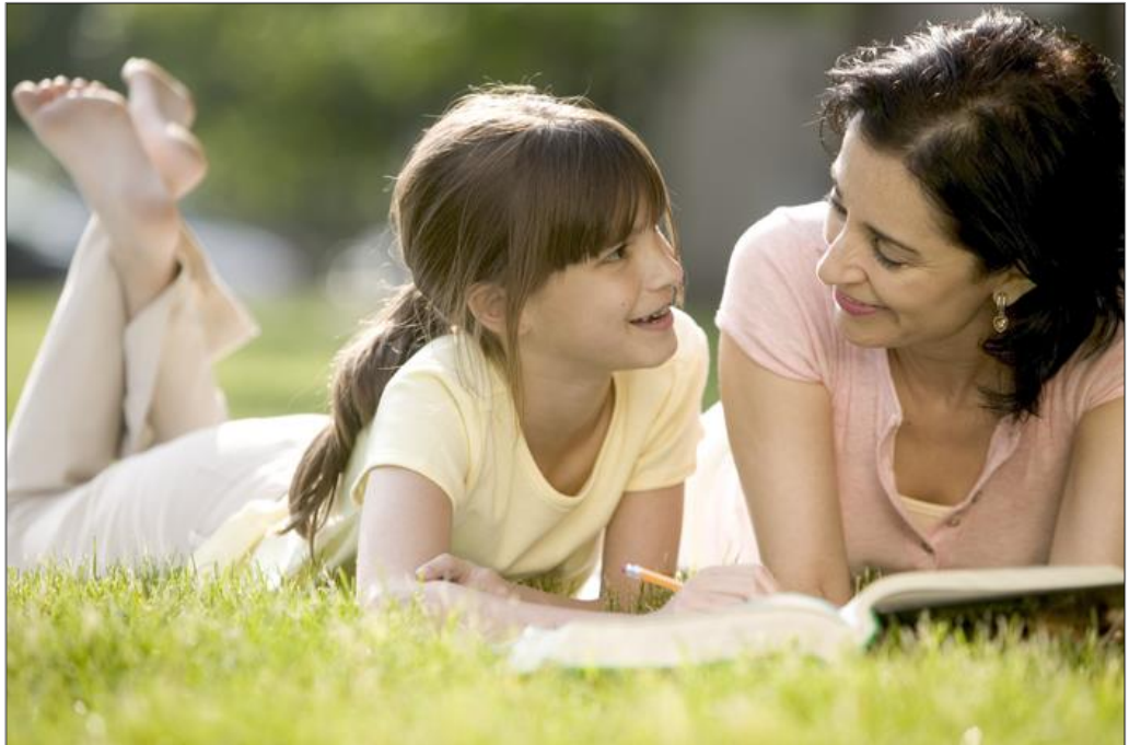
Slika 2: Verbalna komunikacija majke s djetetom ( https://www.google.com/search?client=firefox-b-ab&biw=1366&bih=654&tbm=isch&sa=1&ei=Db2PW88IwdnAAqP6pagH&q=verbalna+komunikacija+kod+djece&oq=verbalna+komunikacija+kod+djece&gs_l=img.3...376254.376254.0.376886.1.1.0.0.0.334.334.3-1.1.0....0...1c..64.img..0.0.0....0._fy6MiDg1Gc#imgcr=GUZNI2AIj7W62M: )