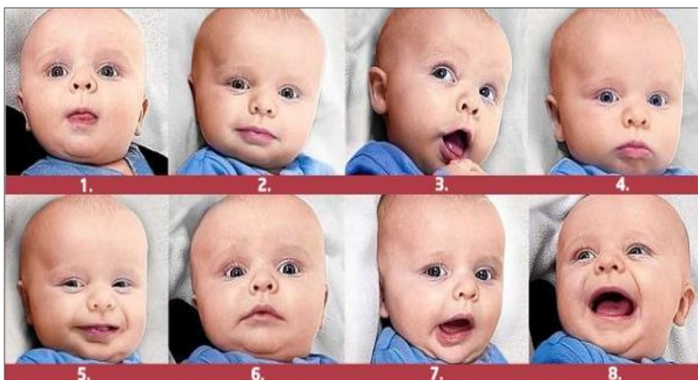
Slika 3: Neverbalna komunikacija kod djeteta ( )

Pod neverbalnu komunikaciju podrazumijevaju se „ton glasa, izraz lica, geste, dodiri, držanje tijela te oni govore o prirodi odnosa među sudionicima u procesu komunikacije“ (Fox, 2001, str. 22). „Pogled, kimanje glavom, gesta, osmijeh, sve su to elementi uspostavljanja ili potvrđivanja posebnih veza između dvije i/ili više osoba, ali i čimbenik obeshrabrivanja nečlanova grupe u pokušaju komunikacije“ (Fox, 2001, str. 22). Neverbalnom komunikacijom najviše se koriste mala djeca koja još nemaju dobro razvijene govorne sposobnosti (slika 3). Na taj način najlakše izražavaju svoje osjećaje, misli i želje. Kod odrasle osobe možemo primijetiti da neverbalna komunikacija uvelike utječe na značenje cijele rečenice. Koliko god odrasla osoba izgovorila neku riječ ili rečenicu i da je ona pozitivna, neverbalna komunikacija tu riječ ili rečenicu može promijeniti na skroz drugačiji način.