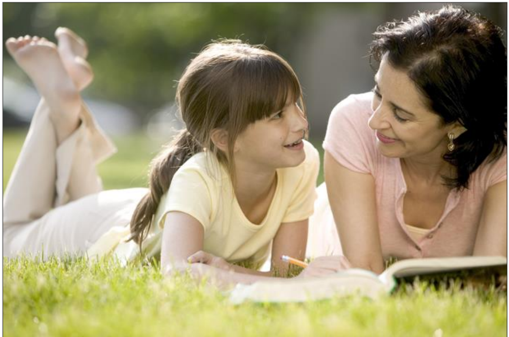
Slika 2: Verbalna komunikacija majke s djetetom ( https://www.google.com/search?client=firefox-b-ab&biw=1366&bih=654&tbm=isch&sa=1&ei=Db2PW88IwdnAAqP6pagH&q=verbalna+komunikacija+kod+djece&oq=verbalna+komunikacija+kod+djece&gs_l=img.3...376254.376254.0.376886.1.1.0.0.0.334.334.3-1.1.0....0...1c..64.img..0.0.0....0._fy6MiDg1Gc#imgcr=GUZNI2AIj7W62M: )