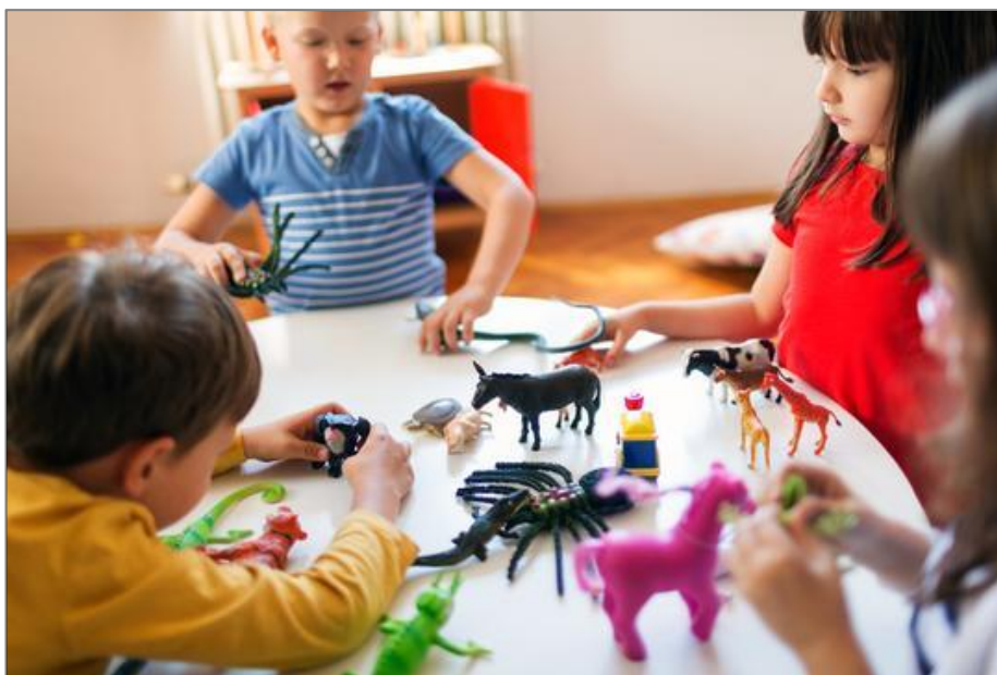
Slika 6: Komunikacija među dječacima i djevojčicama

„Dok je spol naslijeđen, ponašanja koja su s time vezana vjerojatno se moraju naučiti“ (Reardon, 1998, str. 66). „Drugim riječima, dijete se rađa kao dječak ili djevojčica, ali ponašanja u skladu s društvenim očekivanjima prema djetetu svoga spola tek mora usvojiti u procesu socijalizacije“ (Reardon, 1998, str. 66) (slika 6). Jedan od načina na koji roditelji mogu izbjeći zamku spolnih stereotipa sastoji se u razvijanju osjetljivosti prema vlastitim spolnim sklonostima (Reardon, 1998, str. 66).