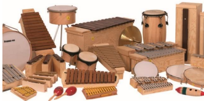
Slika 2. „Orffov instrumentarij“

Inicijativom njemačkog liječnika Theodora Hellbrüggea nastala je Orffova metoda glazboterapije putem koje se na temelju Orff-Schulwerka i djecu s posebnim potrebama željelo uključiti u stvaranje glazbe i glazboterapiju. U tome mu je pomogla Gertruda Orff (supruga Carla Orffa) koja je kasnije osposobljavala mnoge glazboterapeute za rad po ovoj metodi. Ciljevi koji se žele postići ovom metodom glazboterapije mogu biti specifični i opći. Specifični ciljevi ovise o potrebama i obilježjima pojedinog djeteta i mogu se odrediti tek nakon što se utvrde poteškoće i potrebe određenog djeteta. S druge strane, opći ciljevi jednaki su za svu djecu, a odnose se na razvoj dječje razigranosti, spontanosti i kreativnosti (Bruscia, 1988, prema Svalina, 2009). Glazbena sredstva koja se koriste u Orff-glazboterapiji su: pokret/ritam/ples, pjevanje, sviranje na instrumentima i govor/mimika/geste koje se različito kombiniraju tijekom terapije. Instrumenti koji se koriste poznati su pod nazivom „Orffov instrumentarij“ u koji ubrajamo udaraljke s neodređenom visinom tona (zvečke, drveni štapići, bubnjevi, tamburin i sl.) i udaraljke s određenom visinom tona (ksilofoni, metalofoni, zvončići) (Slika 2).