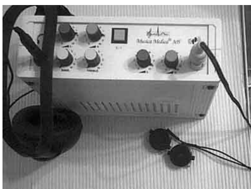
Slika 3. Musica Medica aparatura

Musica Medica multisenzorna je metoda koju su osmislili Schifftan i Stendicky (2007) u kojoj se istovremeno koristi zvuk i vibracija. Terapijski učinak temelji se na transmisiji glazbe putem slušalica i istovremeno na recepciji njegovih vibracija kroz dvije vibracijske sonde postavljene na razne dijelove tijela. Dakle, potrebna je određena aparatura (Slika 3), a to su: sonde, slušalice, posebno dizajnirani zvučnici ugrađeni u stolicu, krevet i slično (Škrbina, 2015).