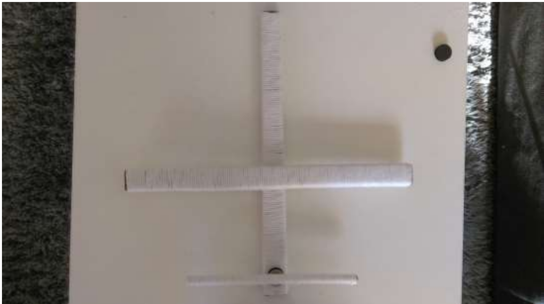
Slika 26 Dovršeni mehanizam za pokretanje