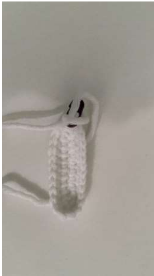
Slika 7 Početak izrade prsa

Poslije glave, počela sam raditi prsa koja sam isto kao i glavu napunila rižom.