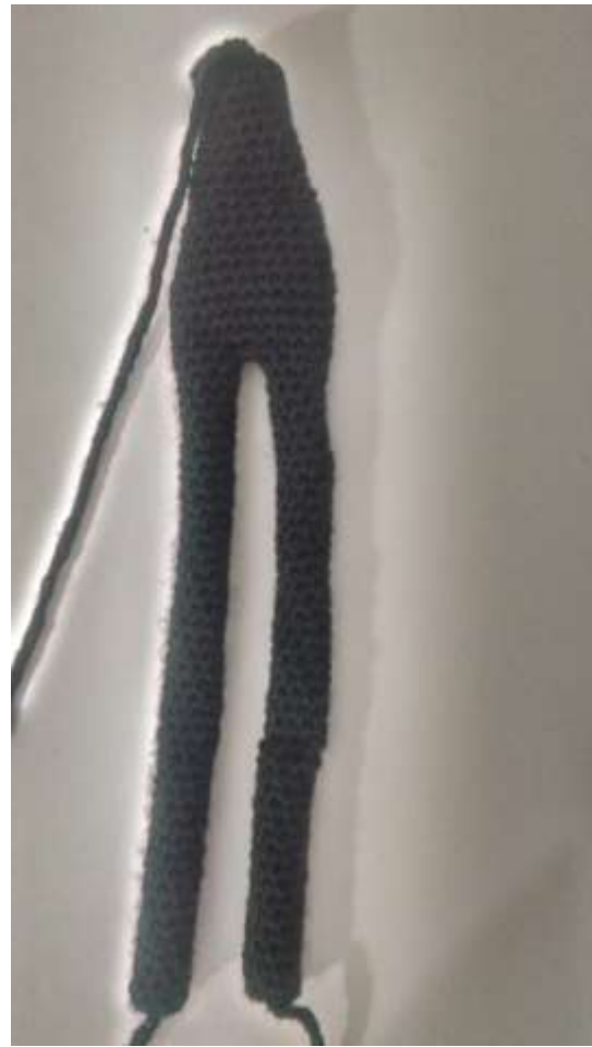
Slika 14 Dovršene noge i trup

Noge sam zašila po sredini kako bi se savijale kako lutka hoda. Kada sam spojila trup i noge s prsima i glavom lik je napokon počeo uzimati oblik.