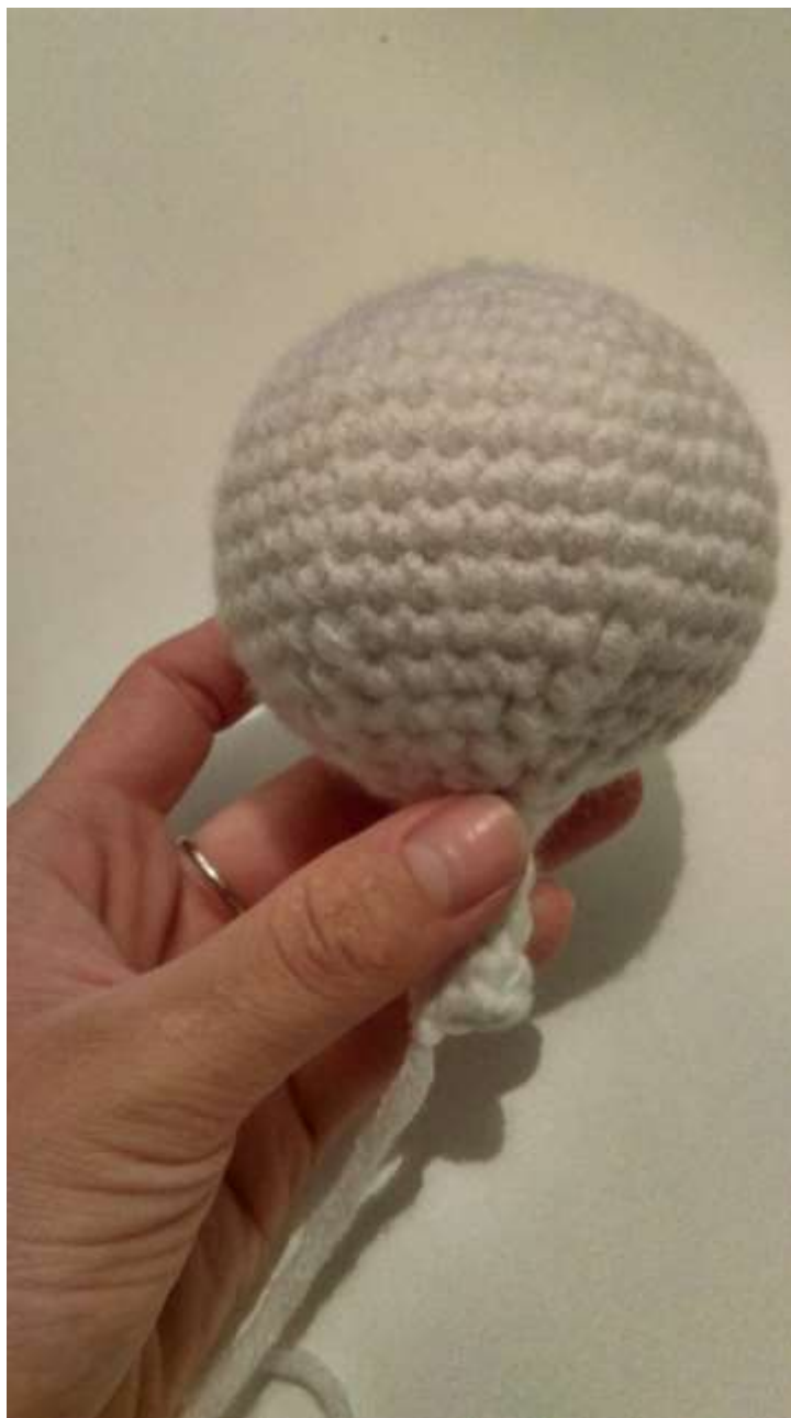
Slika 5 Glava 2

Nakon što sam dovršila cijelu glavu, napunila sam ju rižom kako bi lutka bila malo teža da bi se lakše upravljalo njome (inače heklane lutke punim polieterskim punjenjem kojim bi marioneta u mom slučaju bila prelagana).