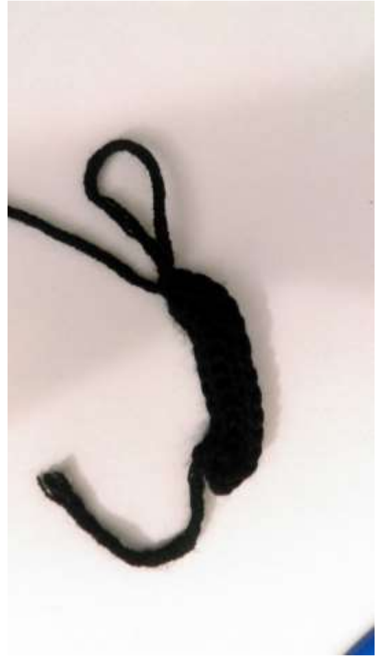
Slika 17 Početak izrade kaputa