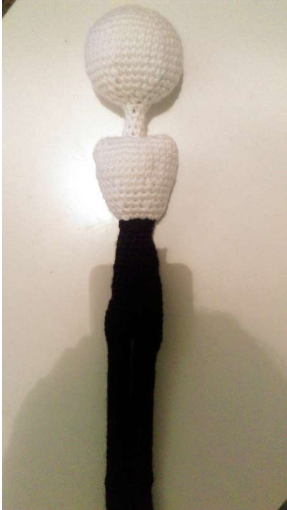
Slika 15 Tijelo lutke

Ruke sam napravila na isti način kao i noge (napunila s patronama i zašila po sredini za pokretljivost) te ih prišila na kaput koji ide preko prsa.