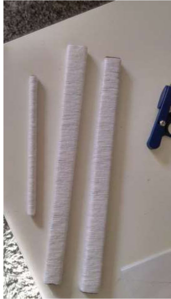
Slika 25 Mehanizam za pokretanje