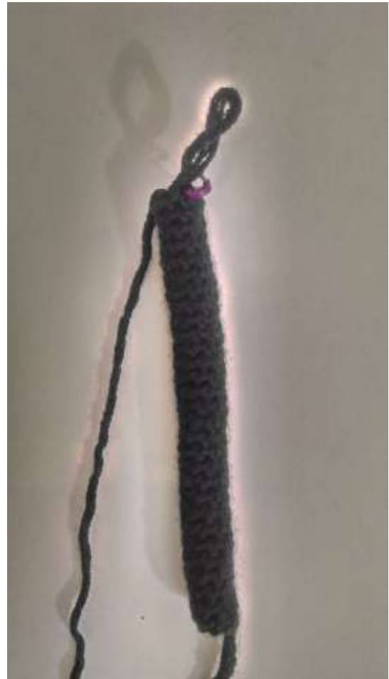
Slika 12 Prva noga