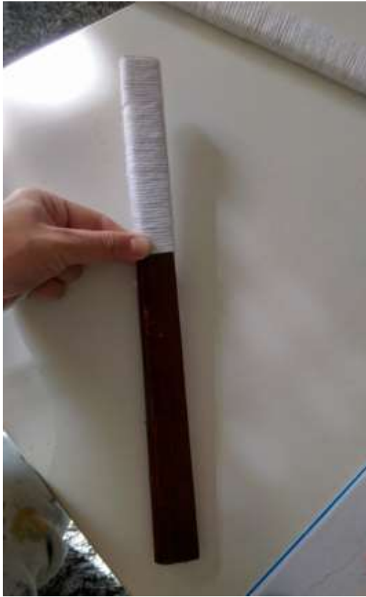
Slika 22 Omatanje daščice

Slijedila je izrada mehanizma za pokretanje koji sam napravila od dvije drvene daščice i okruglog štapića. Dvije drvene daščice sam omotala s bijelom vunom i slijepila zajedno.