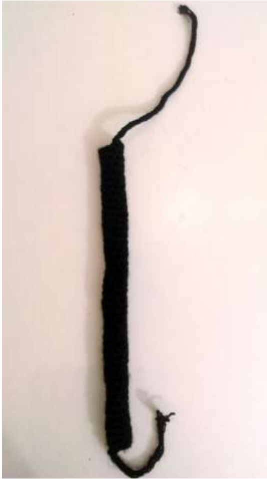
Slika 16 Ruka