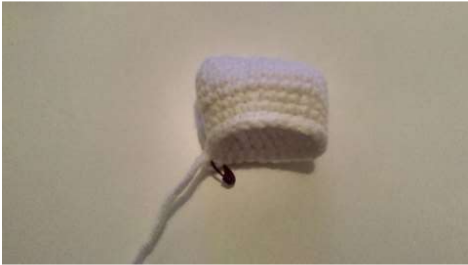
Slika 8 Prsa

Sa završenim prsima koja sam napunila rižom spojila sam glavu s drvenim štapićem kako glava ne bi padala te zašila zajedno.