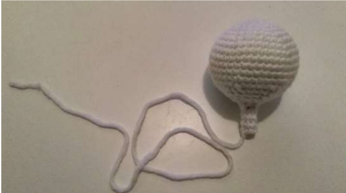
Slika 6 Dvršena glava

Poslije glave, počela sam raditi prsa koja sam isto kao i glavu napunila rižom.