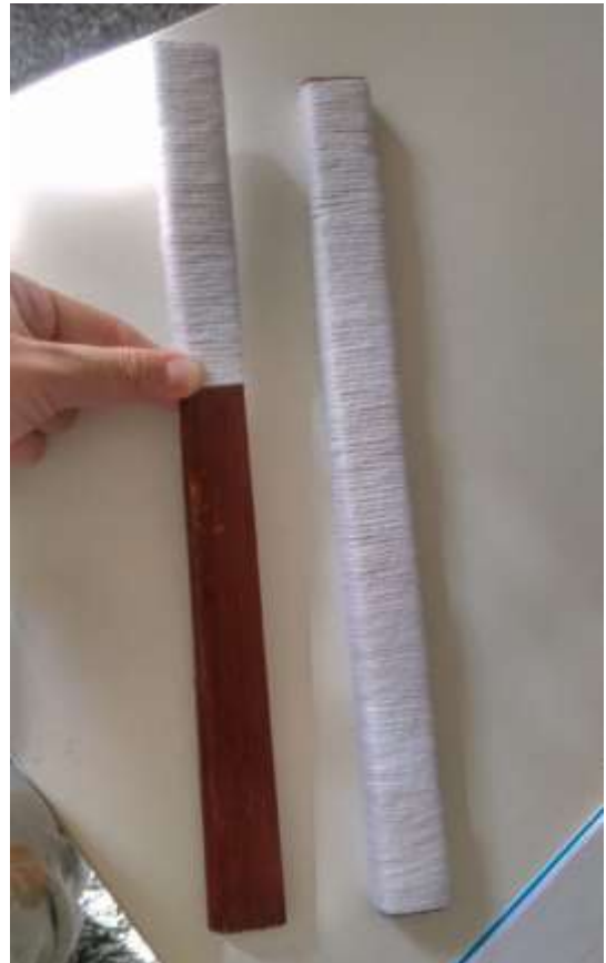
Slika 23 Omatanje daščice 2

Nakon što sam omotala daščice, omotala sam i okrugli drveni štapić.