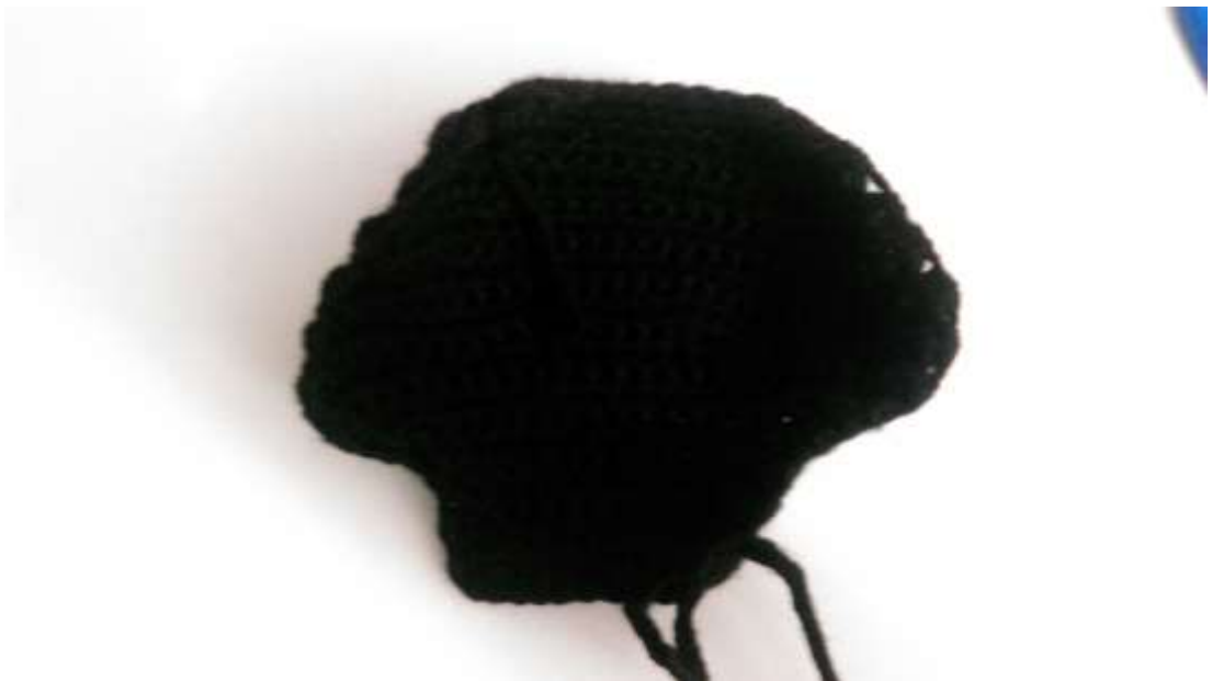
Slika 18 Kaput- izrada