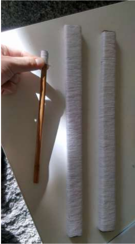
Slika 24 Omatanje štapića