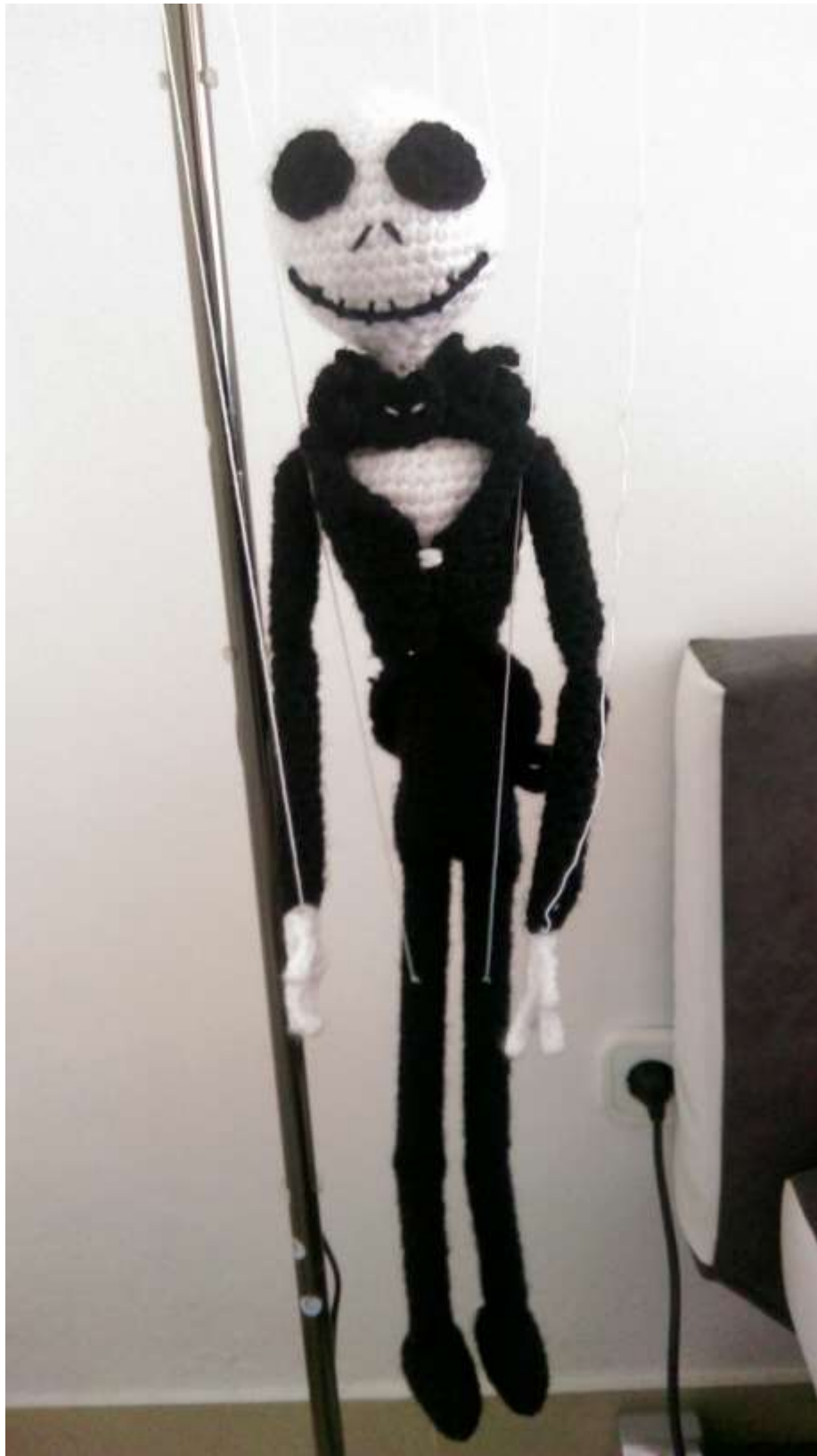
Slika 27 Moja prva marioneta