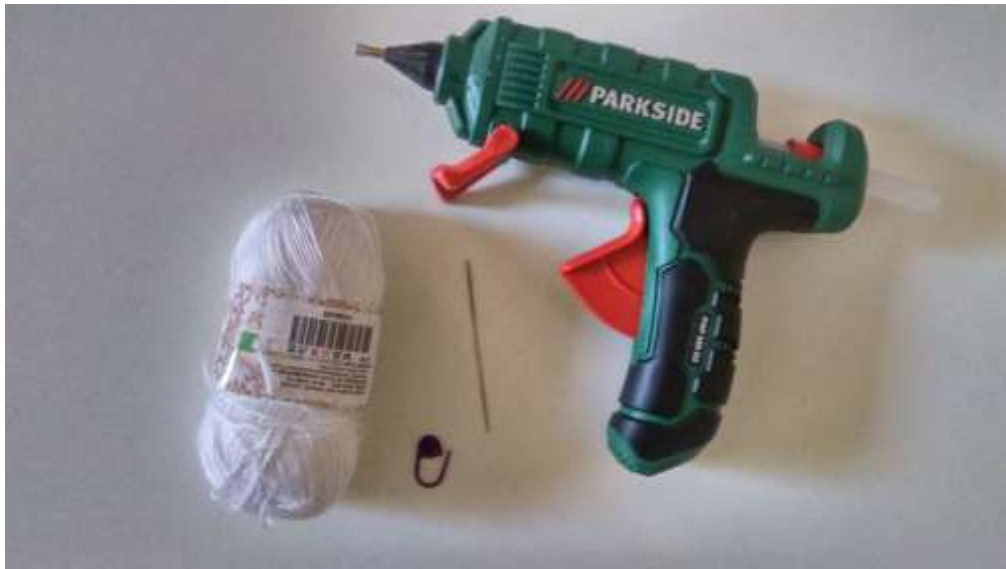
Slika 2 Pribor za rad 2

Počela sam s izradom marionete počevši od glave za koju sam koristila bijelu vunu ("Tango")