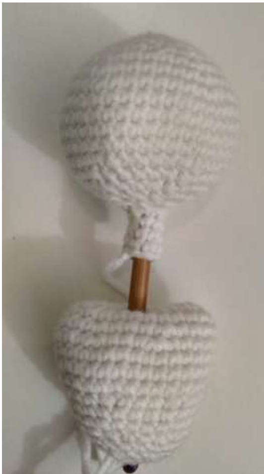
Slika 9 Spajanje glave i prsa

Sa završenim prsima koja sam napunila rižom spojila sam glavu s drvenim štapićem kako glava ne bi padala te zašila zajedno.