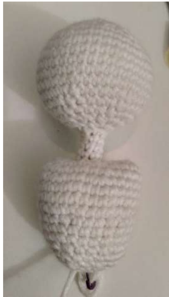
Slika 10 Spojena glava i prsa