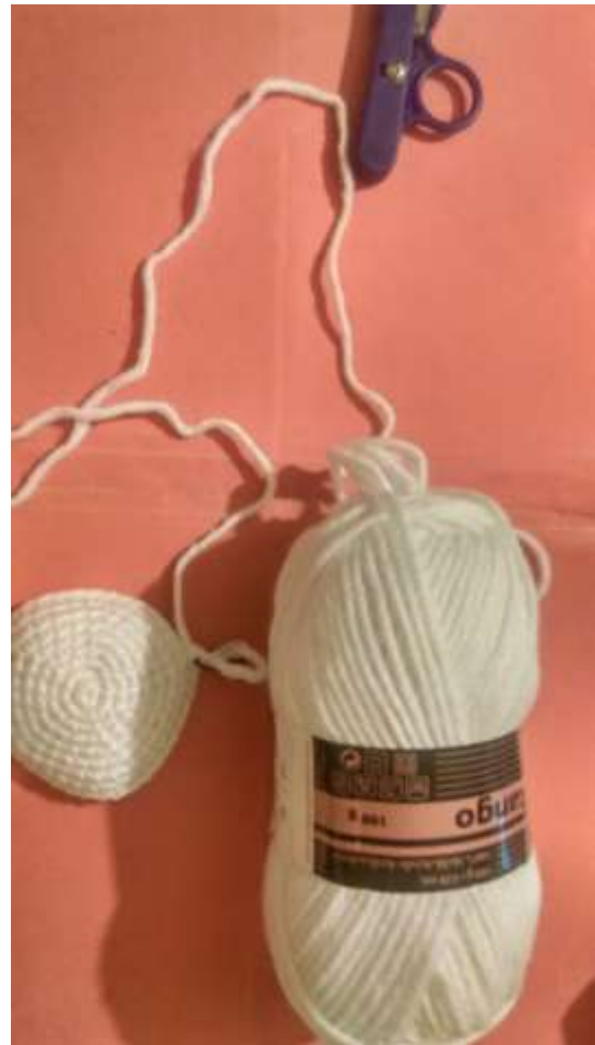
Slika 4 Glava