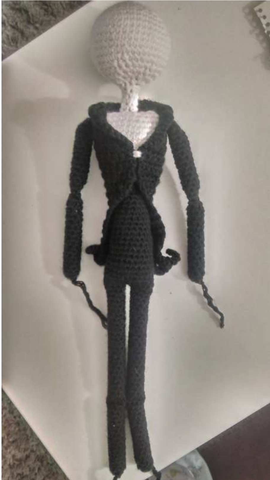
Slika 20 Zašiven kaputić

Za kraj sam napravila šake koje sam zašila na ruke i stopala na noge. Isheklala sam oči koje sam kao i usta, s pištoljem za vruće lijepljenje zalijepila na glavu. Za vrat