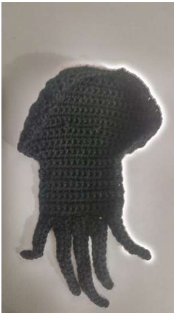
Slika 19 Dvršeni kaput

Kada sam napravila cijeli kaput, stavila sam ga preko prsiju i prišila zajedno s komadićem bijele vune.