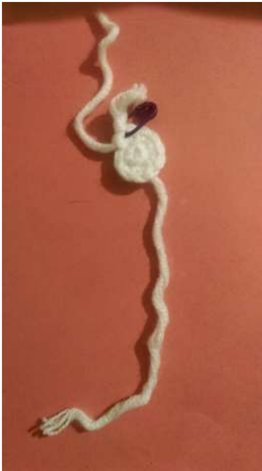
Slika 3 Početak heklanja- glava

Počela sam s izradom marionete počevši od glave za koju sam koristila bijelu vunu ("Tango")