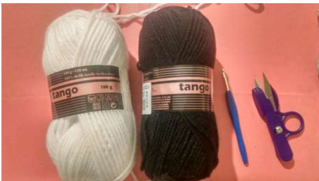
Slika 1 Pribor za rad 1

Za izradu marionete odabrala sam lik iz crtića Jack Skelington, a tehniku izvedbe heklanje. Nakon što sam pronašla uzorak lika počela sam s radom (prilog 1). Materijal koji sam koristila je crna i bijela vuna ("Tango" 100 grama~ 120 metara), bijela tanka vuna koja mi je poslužila umjesto konaca ( "Alize Forever" 50 grama~300 metara), heklaricu veličine broj 4, iglu za vunu, sigurnosnu iglu za označavanje reda u kojem se nalazim, pištolj za vruće lijepljenje i tri komada drveta od kojega sam napravila kontrolni mehanizam.