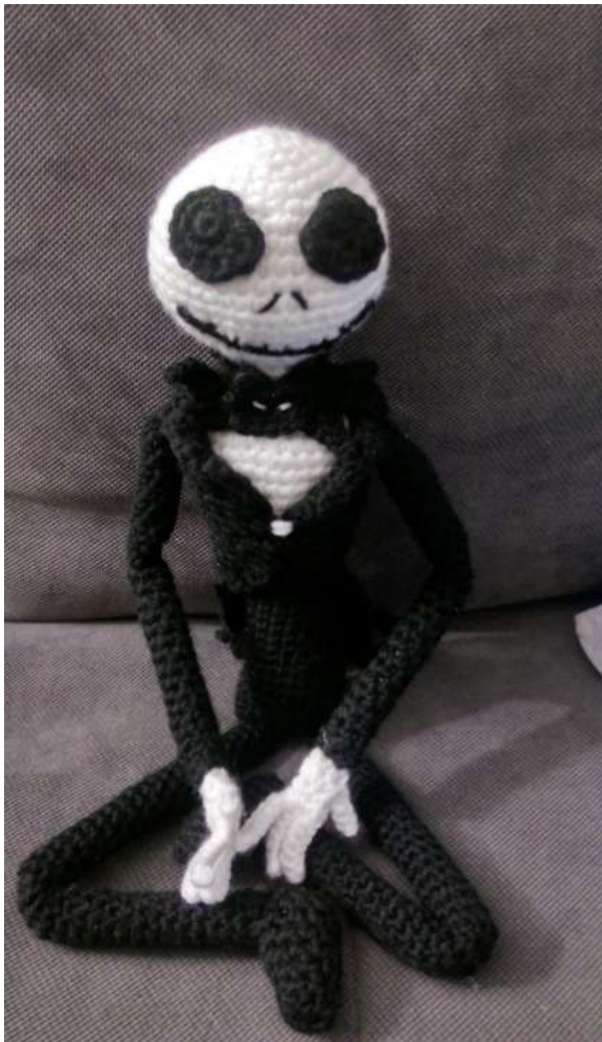
Slika 21 Napravljena lutka do kraja (fotografija: Ivana Bađura)

sam napravila mašnu u obliku šišmiša koji sam isto tako s pištoljem za vruće lijepljenje zalijepila za vrat (ispod glave). I tako je moj lutak bio gotov.