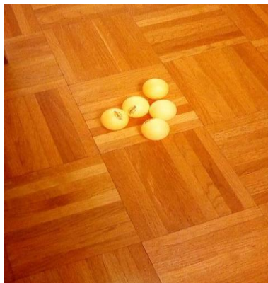
Slika 1. Loptice korištene za test MPGK

Uvježbavanje: ispitanik ima probni pokušaj (baciti svih pet loptica)