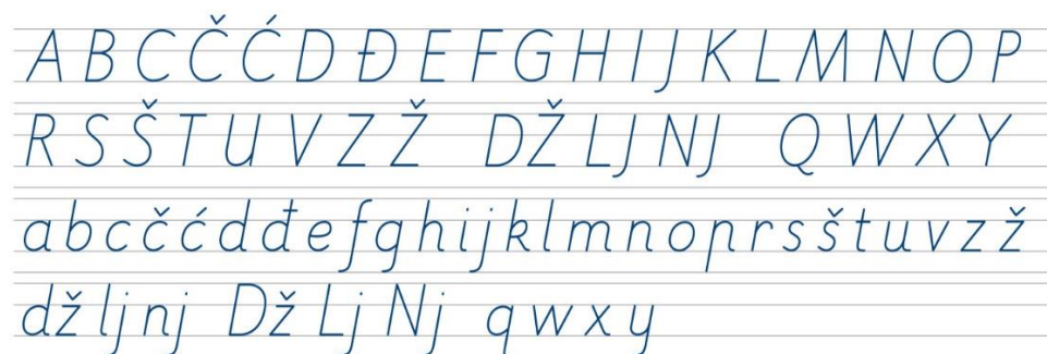
Slika 2. Školsko formalno koso pismo

Slično je i s inačicama rukopisnoga kosog pisma, također postoje dvije – velika rukopisna slova i mala rukopisna slova. Definirana su kao slova namijenjena stvaranju osobnoga rukopisa te ga je važno prilagoditi dječjoj anatomiji, objašnjava Reberski (2014).