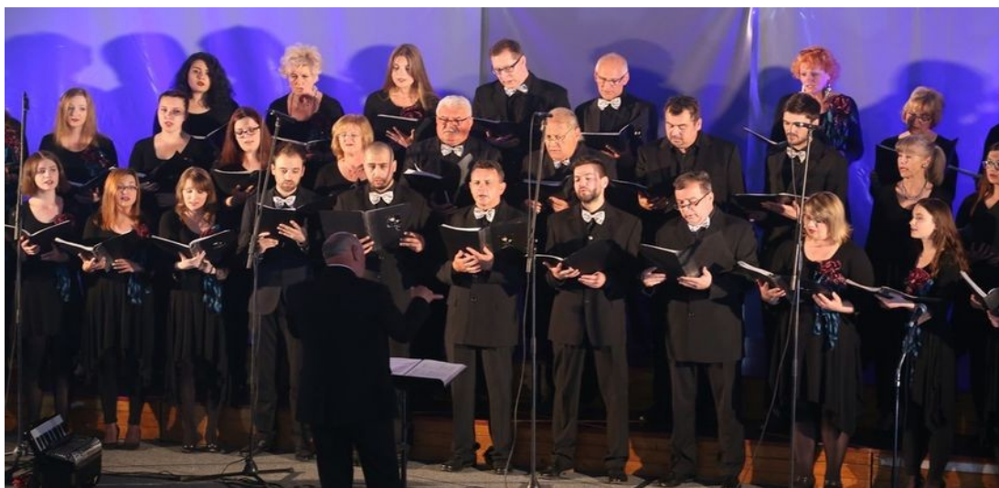
Slika 3. Današnji pjevački zbor Josip Vrhovski

Vrhovski je i nakon završenog studija nastavio nizati odlične skladbe, a dio opusa koji se odnosi na religioznu glazbu koju je pisao zaokružuje i čini ukupno šest misa: Hrvatska misa u h-molu za mješoviti zbor, orgulje i orkestar, Hrvatska misa u e-molu za mješoviti zbor i orgulje koju je u svom članku o Josipu Vrhovskom spominjao i Miroslav Magdalenić 9 , Hrvatska pučka misa u C-duru za dvoglasni zbor a cappella i tri Pučke mise (u tonalitetima F-dur, D-dur, d-mol) za dva glasa i orgulje. Za navedene Pučke mise izgubljen je notni zapis i materijal, ali znamo da su postojale jer ih je sam Vrhovski prijavio Hrvatskom autorskom društvu 1943. godine. Brojni kritičari isticali su i spominjali kako su njegove mise pisane u narodnom duhu, da iz cijelog djela proviruje Međimurje, pohvale poput Lučićeve: „...velika je odlika skladbe, da ju resi naša slavenska nota.”