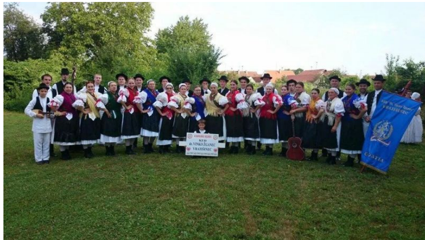
Slika 10. Kulturno-umjetničko društvo Vinko Žganec, Vratišinec

Pedagoški rad Vinka Žganeca također je usko vezan uz etnomuzikologiju, folklor i pučke napjeve. Bio je poznat po svojevrsnim metodama analiziranja, zapisivanja, organiziranja i općenitom pristupu pučkim napjevima za koje je nerijetko pisao vlastite harmonizacije. Iako je bio vezan za Međimurje (zapisao je 1093 različitih pučkih i tradicijskih pjesama u Međimurju), Vinko Žganec proširio je svoj etnomuzikološki rad na Slavoniju, Baranju, Bačku te okolicu Samobora. Uz njegove zapise izuzetno su cijenjene i snimke hrvatskog glagoljaškog liturgijskog pjevanja na području Krka, Raba, Paga, ali i na području Brača, Šibenskih otoka i Istre. 24 Ovim svojim istraživanjima i zapažanjima Vinko Žganec često je održavao i vodio predavanja i stručne skupove o svojem etnomuzikološkom radu i folkloru kod nas, ali i u inozemstvu. Za svoj izuzetno uspješan rad na području glazbe i skladateljstva Vinko Žganec je 1970. godine primio nagradu AVNOJ-a. Umro je nakon pada u šetnji 12. prosinca 1976. godine.