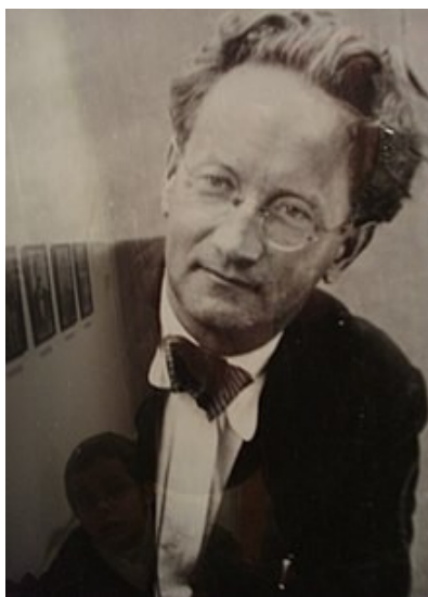
Slika 6. Josip Štolcer Slavenski

Josip Štolcer Slavenski rodio se 1986. godine u Čakovcu. Kao i većina druge djece tog vremena rodio se i živio u teškim materijalnim uvjetima te je nakon završetka građanske škole 1911. godine položio ispit za pekarskog kalfu. Zbog navedenih razloga Slavenski nije imao nikakvo glazbeno obrazovanje osim očeva poučavanja sviranja citre po notama te učenja tradicijskih napjeva od svoje majke. Prvi ozbiljni pokušaj glazbenog obrazovanja Slavenskom su omogućile mecene koje su dale novac potreban za njegovo putovanje u Budimpeštu i upis u Konzervatorij. Njegov zahtjev za upis je odbijen jer su u Glazbenom zavodu smatrali da nije dovoljno kvalificiran što je Slavenskog slomilo, ali nije uništilo njegovu upornost i želju da se bavi glazbom.