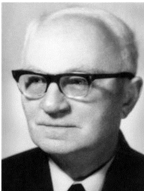
Slika 9. Vinko Žganec

Vinko Žganec bio je poznati međimurski skladatelj, pisac i etnomuzikolog koji se rodio 1890. godine u Vratišincu. Kao i prethodno spomenuti glazbenici pohađao je pučku školu na mađarskom jeziku. Nakon pučke škole upisao je klasičnu gimnaziju u Varaždinu te je nakon završetka triju razreda gimnazije odselio u Zagreb. Polazio je gornjogradsku gimnaziju, a osmi je razred završio u nadbiskupskom liceju. Bio je izvrstan učenik, a posebno se istaknuo na području književnosti, glazbe i folklor.