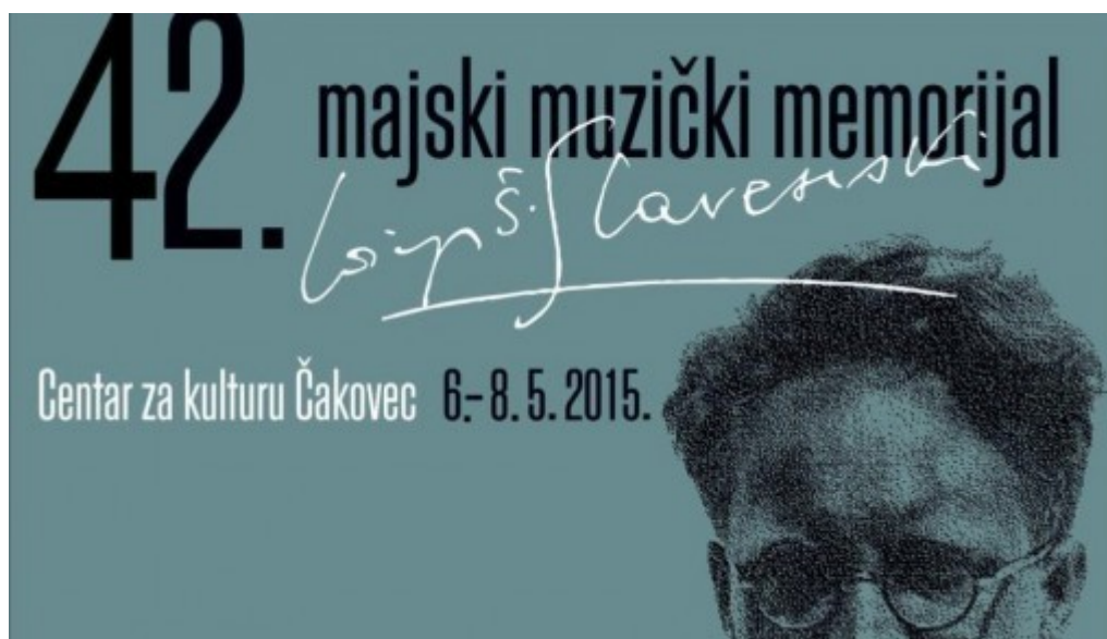
Slika 7. Majski muzički memorijal u čast Slavenskom

Umro je 1955. godine u Beogradu, a u Čakovcu se svake godine održava Majski muzički memorijal „Josip Štolcer Slavenski” koji slovi kao najznačajnija glazbena manifestacija u Čakovcu i Međimurju koja je posvećena Slavenskom.