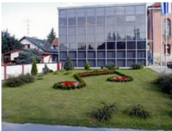
Slika 12. Umjetnička škola Fortunat Pintarić u Koprivnici

Kao učen i obrazovan čovjek Fortunat Pintarić bio je svjestan položaja u kojemu se nalazi hrvatski jezik te same potrebe za djelovanjem na svim područjima društvenih znanosti i kulture. Navedene činjenice dokaz su njegove posvećenosti toj zadaći koju je dodatno potaknuo poziv Maksimilijana Vrhovca fokusiran na buđenje svijesti i narodnosti. Djelo koje bih ja sam istaknuo je Dudaš koji se i dandanas pjeva u raznim prigodama vezanim uz Božić, a osim toga oslikava i ocrta njegov glazbeno-edukativni rad zbog kojeg je Fortunat Pintarić cijenjen.