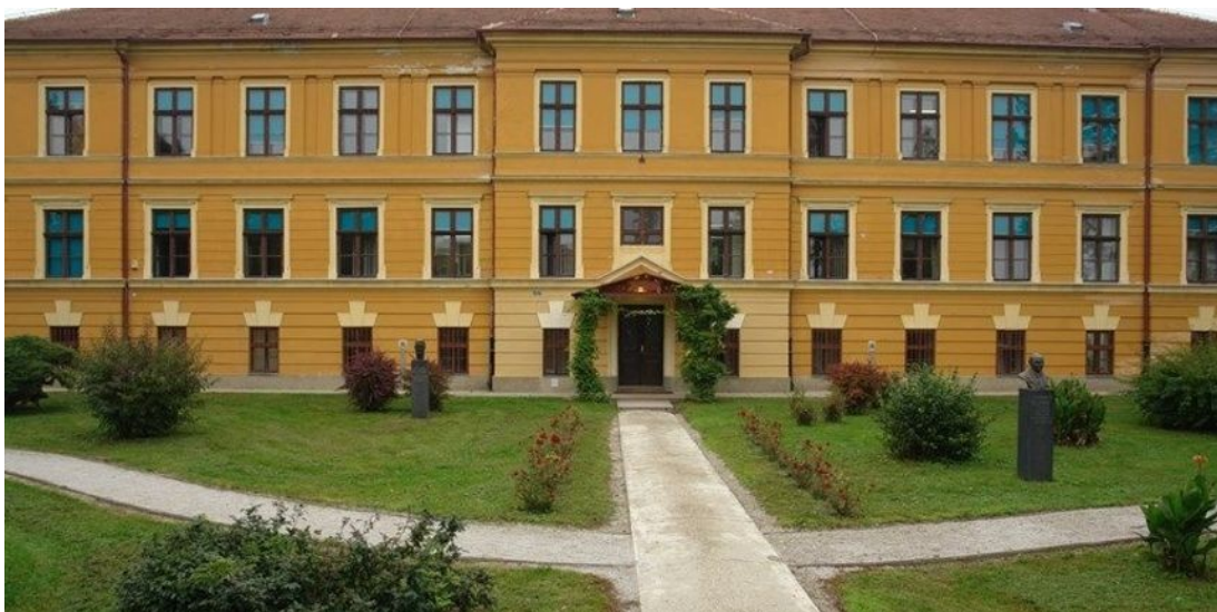
Slika 1. Učiteljski fakultet u Čakovcu