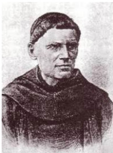
Slika 11. Fortunat Pintarić

Skladatelj i pedagog Josip Fortunat Pintarić rodio se 1798. godine u Čakovcu gdje je završio osnovnu školu, a svoje je školovanje nastavio u Zagrebu gdje je završio gimnaziju. 17. rujna 1815. godine stupio je u Franjevački samostan u Ivaniću gdje je dobio ime Fortunat. Svoje prve susrete s glazbom Pintarić ostvaruje uz pomoć Maksima Kovačića koji je bio orguljaš u samostanu. Vrlo je brzo postao vješt orguljaš, a uz sviranje orgulja bavio se i prepisivanjem orguljaških skladbi, preludija i pučkih napjeva.