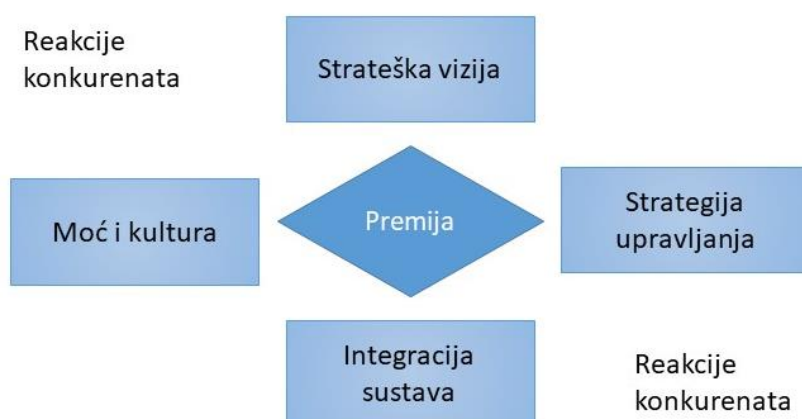
Slika 1. Temeljni čimbenici sinergije