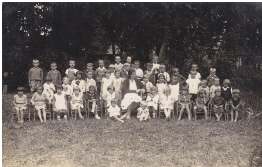
Djeca zabavišta pri Državnoj učiteljskoj školi u Čakovcu školske 1932./33. godine