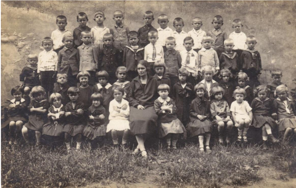
Zabavište Čakovec 1926.-1927. godine