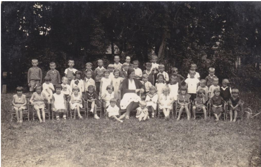
Djeca zabavišta pri Državnoj učiteljskoj školi u Čakovcu školske 1932./33. godine