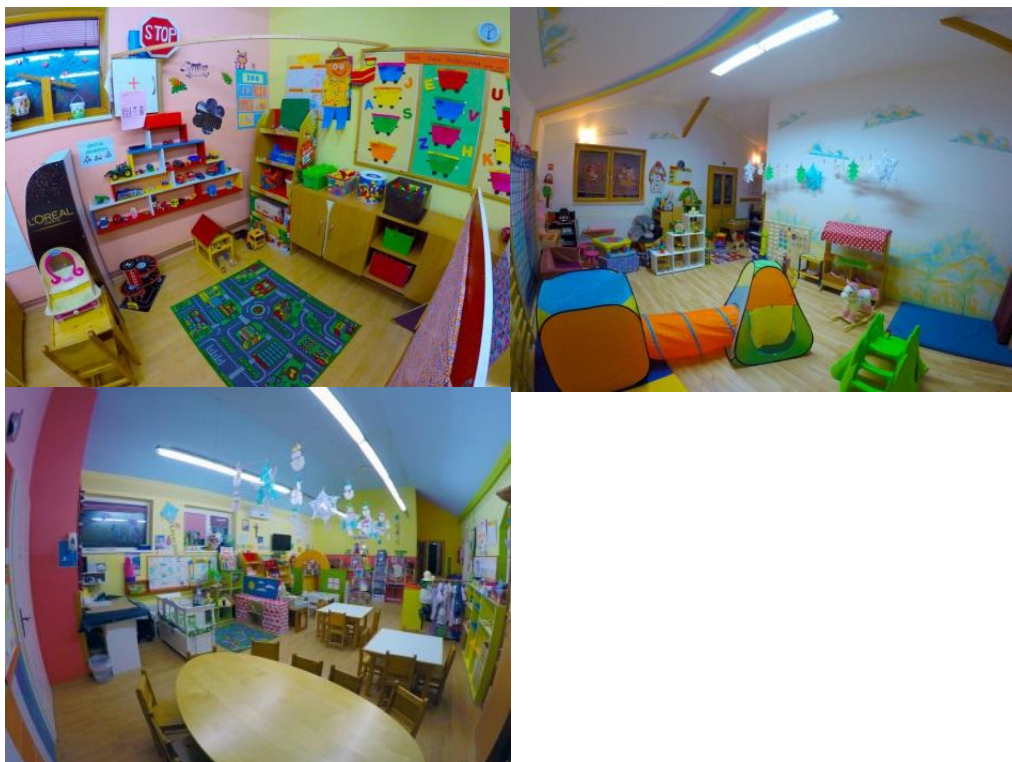
Slika 2: Dječji vrtić „ Ribica „ Žabnik

dolazi od odgajatelji, jer oni su ti koji su kreatori svega toga. Odgajateljima je danas puno lakše za raditi jer imaju dostupno puno više literature, ima više stručnih ljudi, te kompetentnih osoba ako im zatreba neka pomoć, dok toga svega nekad nije bilo. A te promjene najviše osjete i prepoznaju odgajateljice koje su radile nekad, pa kroz period kada se to sve mijenjalo na bolje.