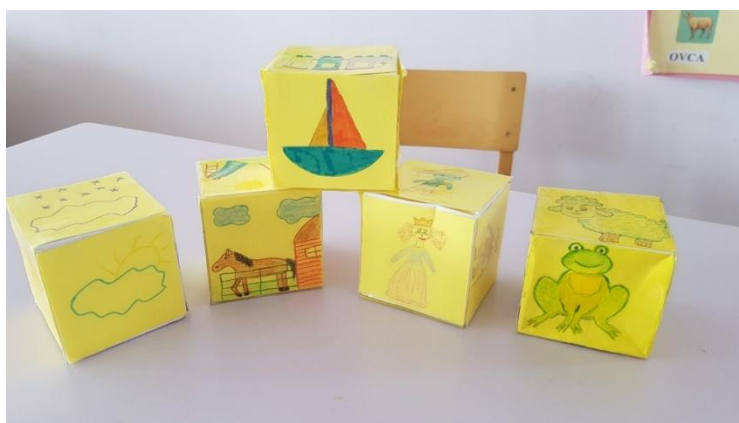
Slika 1 Izrađene kocke od papira

Opis igre: za ovu igru potrebno je nekoliko kocki sa različitim slikama na plohamama koje su djeca zajedno sa odgojiteljkom izradila. Za izradu kocki bili su nam potrebni tvrdi žuti papir, bojice, flomasteri, ljepilo i škare.