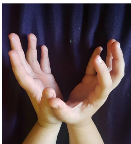
Slika 22 Ruke u položaju "otvorenog" cvijeta