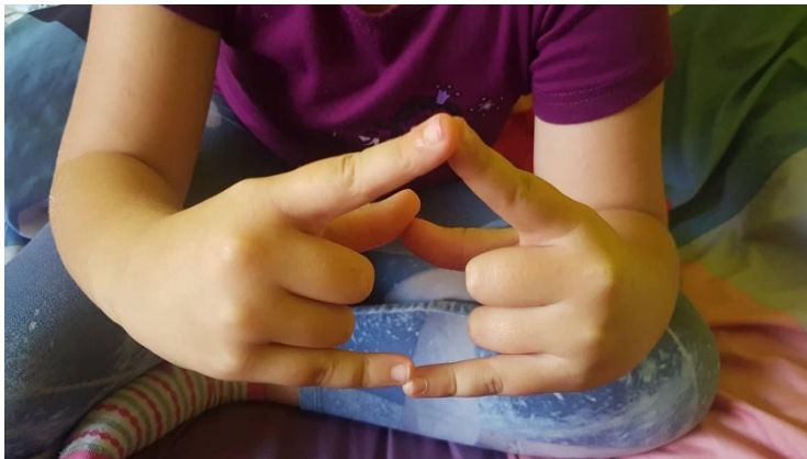
Slika 25 Ruke u položaju kozlića koji se bodu

Provođenjem jezičnih igara i igara za razvoj fine motorike moglo se primjetiti da su djeca veoma zainteresirana za njih i da ih provode bez većih poteškoća. U grupi djece sa kojom su se provodile igre bilo je djece koje imaju poteškoće u govoru, ali su uz poticaj odgojitelja i vršnjaka rješile sve zadane zadatke. Kod provođenja stručno – pedagoške prakse prošlih godina moglo se primjetiti da jezične igre nisu prisutne u vrtiću. Bez obzira na to djeca su već nakon 10 dana provođenja igara stekla naviku igranja jezičnih igri što se moglo zaključiti zadnji dan mog boravka, kada su pitala: „Hoćemo li opet igrati u ponedjeljak?“.