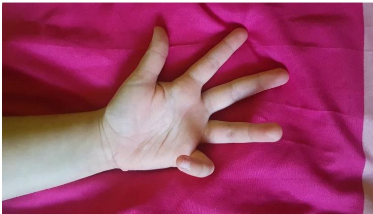
Slika 15 Slika ruke