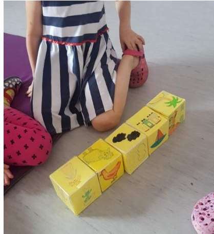
Slika 2 Pričanje priče na temelju slika s kocke