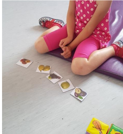
Slika 13 Lana slaže memory sličice