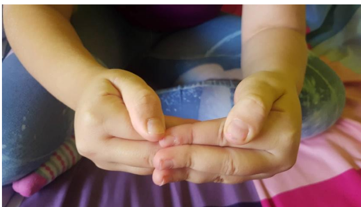
Slika 23 Ruke u položaju zaglavljenih kozlića