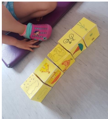
Slika 3 Pričanje priča na temelju slika s kocke