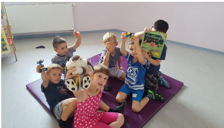
Slika 14 Djeca su odabrala predmete na temelju kojih će pričati priču

Opis igre: svako dijete odabere jedan predmet pomoću kojeg osmišljava priču. Vrlo je važno da se u toj priči spominje predmet koji je dijete prethodno odabralo.