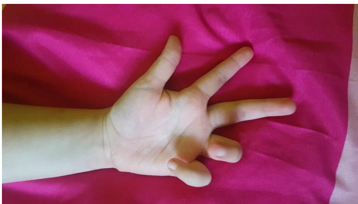
Slika 16 Slika ruke