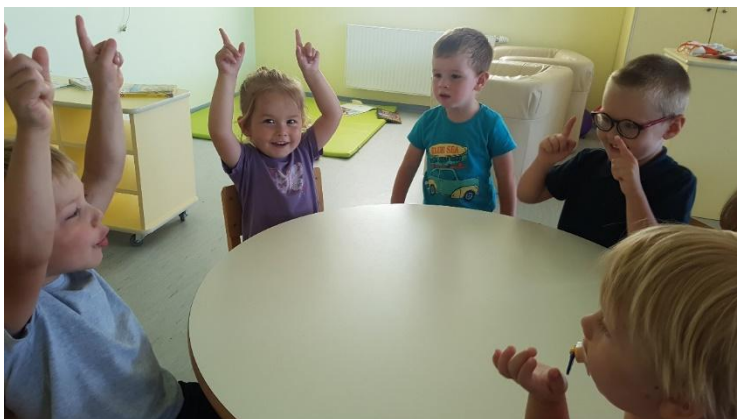
Slika 8 Leti, leti u jasličkoj skupini

manjoj skupini dok sa djecom predškolske dobi u većoj grupi. Nakon nekoliko odgojiteljevih rečenica djeca zamjenjuju njegovu ulogu.