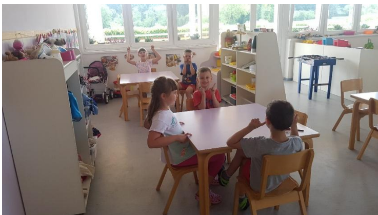
Slika 9 Leti, leti u vrtičkoj skupini