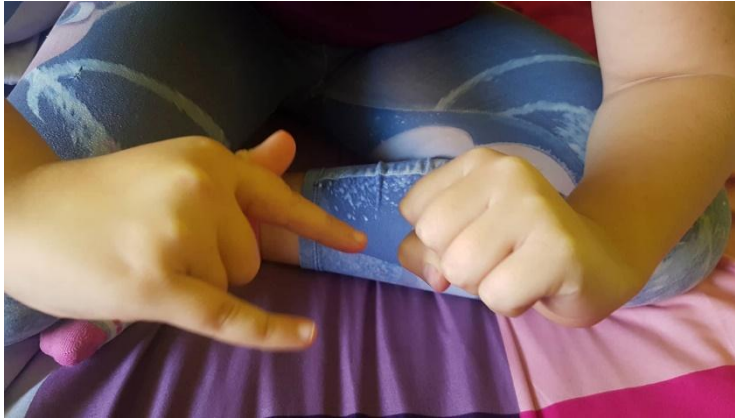
Slika 24 Ruke u položaju kozlića u svađi