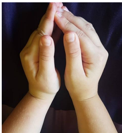
Slika 21 Ruke u položaju "zatvorenog" cvijeta