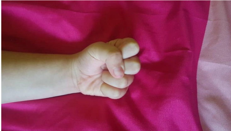
Slika 19 Slika ruke