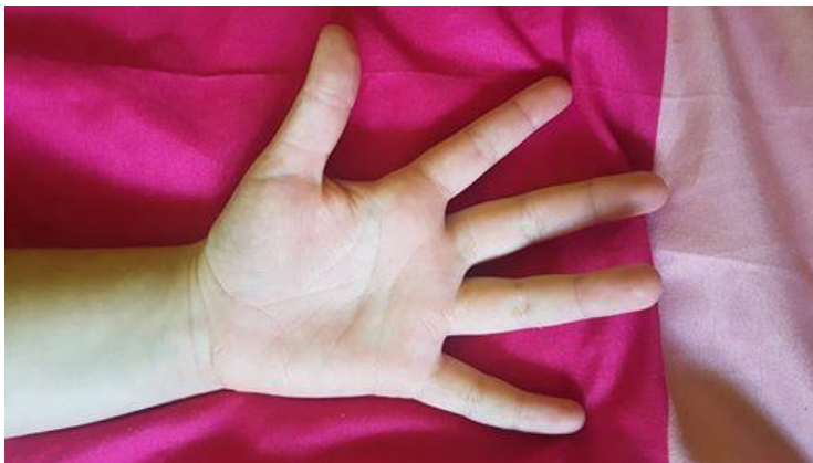
Slika 20 Slika ruke