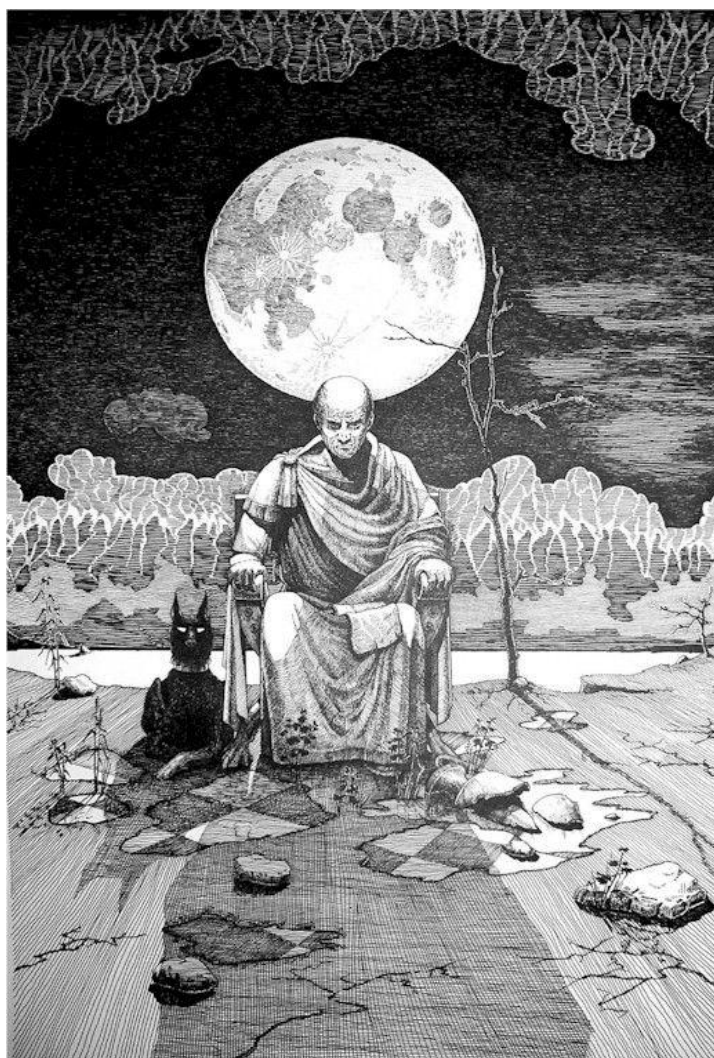
Slika 1. Poncije Pilat 67

Mjesec je obasjavao prostor zelenim i jarkim svjetlom, i Margarita je uskoro opazila u pustinjском kraju naslonjač i u njemu bijeli lik čovjeka. Možda je čovjek bio gluh ili suviše zadubljen u svoja razmišljanja. On nije čuo kako je drhtala kamena zemlja pod težinom konja i konjanici su se približili ne uznemirujući ga. 66