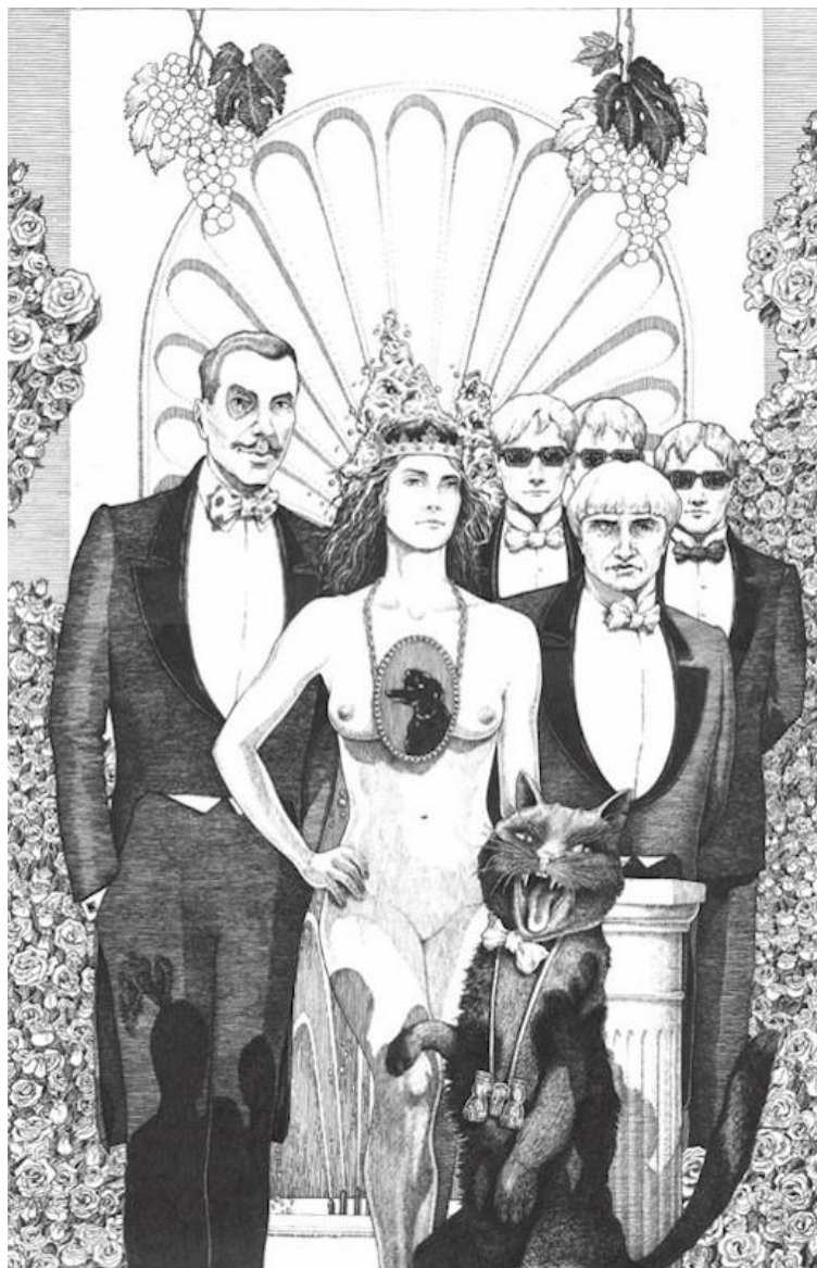
Slika 5. Korovjov, Margarita, Azazello i Behemot na Sotoninom balu 87

dirigenta, koji biva veoma počašćen zato što ga je pozdravila, a od Behemota saznajemo da je to Johann Strauss.