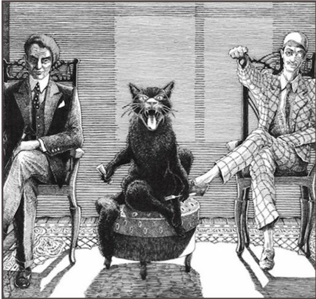
Slika 2. Woland, Behemot i Korovjov 71

Likove po kojima je roman nazvan, Majstora i Margaritu , upoznajemo kasnije. Oboje, barem ispočetka, pripadaju realnom svijetu. Majstora srećemo u bolnici, gdje se upoznaje s Ivanom i njemu ispriča svoju priču. On je pisac, a napisao je roman o Ponciju Pilatu. Taj roman je u poglavljima prepričavan od jednih likova drugima (npr. Woland priča Berliozu i Bezdomnom), ili pak likovi o njemu sanjaju. U romanu se izmjenjuju poglavlja koja prate biblijsku temu s Poncijem Pilatom i moskovsku temu koja prati suvremene događaje u Moskvi. Zbog toga možemo govoriti o tome da je Majstor i Margarita roman u romanu. Majstor započinje Ivanu svoju priču – jednog je dana na ulici susreo Margaritu koja je nosila žuto cvijeće i zapodjenu su razgovor. Ubrzo nakon toga su se zaljubili i ona je postala njegova tajna supruga, iako je ona već bila udana. Nalazili su se u njegovom malom podrumskom stanu koji je bio njegova oaza mira. Ondje su provodili dane, a Majstor je tada uz veliki poticaj i podršku Margarite uspio dovršiti svoj roman. Nakon što je napisao roman,