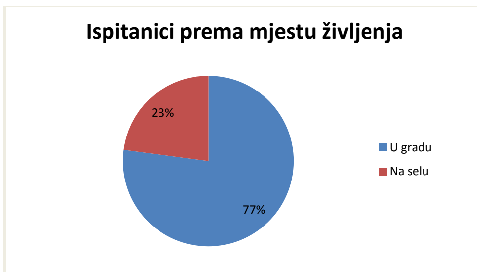
Tablica 4: Ispitanici prema mjestu življenja

Ispitanici su odgovarali na dva pitanja vezano uz obitelj u kojoj su odrasli i obitelj u kojoj trenutno žive i najveći postotak ispitanika je odrastao u obitelji s oba roditelja (76,5 %, f= 587), zatim u obitelji sa samohranom majkom (20,7 %, f= 159) i najmanje ih je odraslo u obitelji sa samohranim ocem (2,7 %, f= 21). Većina ispitanika trenutno živi u obitelji s oba roditelja (59,5 %, f= 456), zatim oni koji žive sami (19,4 %, f= 149) i oni koji žive sa samohranom majkom (18,8 %, f= 144), a najmanje ih živi u obitelji sa samohranim ocem (2,3 %, f= 18).