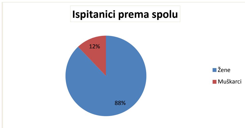
Tablica 1: Ispitanici prema spolu

Većina ispitanika ima srednju stručnu spremu (44,2 %, f= 339), zatim slijede ispitanici s visokom stručnom spremom (29,9 %, f= 229) i višom stručnom spremom (22,7 %, f= 174). Najmanje ispitanika ima osnovnu razinu obrazovanja (0,9 %, f=7), te ispitanici sa završenim poslijediplomskim studijem (2,3 %, f= 18). Prema Državnom zavodu za statistiku (2011.) u Republici Hrvatskoj većina stanovništva ima završeno srednje obrazovanje (53 %), zatim slijede stanovnici s visokim ili višim obrazovanjem (16 %) i