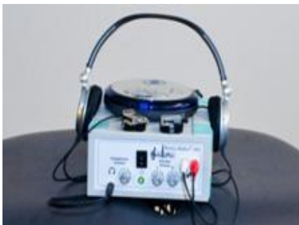
Slika 6. Musica Medica aparatura (sastoji se od dvije male vibracijske sonde, slušalica, posebno dizajniran zvučnik)