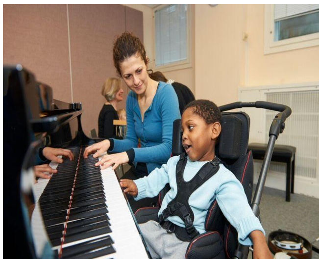
Slika 5. Individualna Nordoff-Robbinsonova glazboterapija (glazboterapeut s dječakom svira klavir)