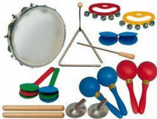
Slika 1. Orffov instrumentarij (tamburin, trianql, zvončići, kastanjete, udaraljke, činela, zvečke)